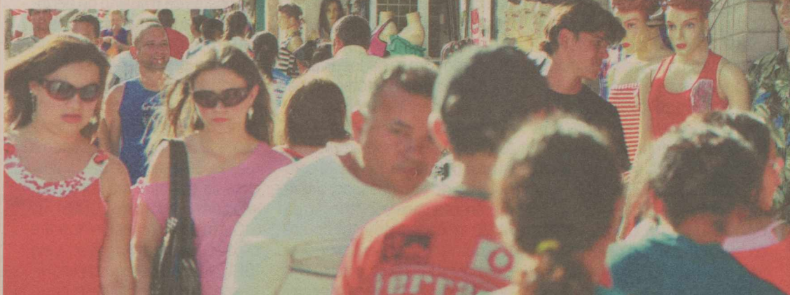
Levantamento mostrou que tempo de vida do brasileiro aumentou 10 anos, sete meses e seis dias em relação a 1980

Apesar do aumento da expectativa de vida da população em geral, ainda permanecia em 2009 a ampla diferença de gênero. A esperança de vida para as mulheres aumentou em 11,26 anos desde 1980, até 77,01 anos em 2009, e a dos homens cresceu 9,76 anos no mesmo período, até 69,42 anos em 2009. Para essa diferença contribuiu especial-