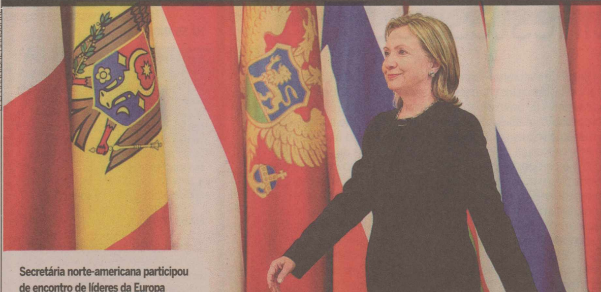
Secretária norte-americana participou de encontro de líderes da Europa