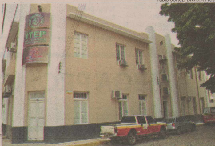
Procedimento do órgão contraria recomendações do Ministério Público