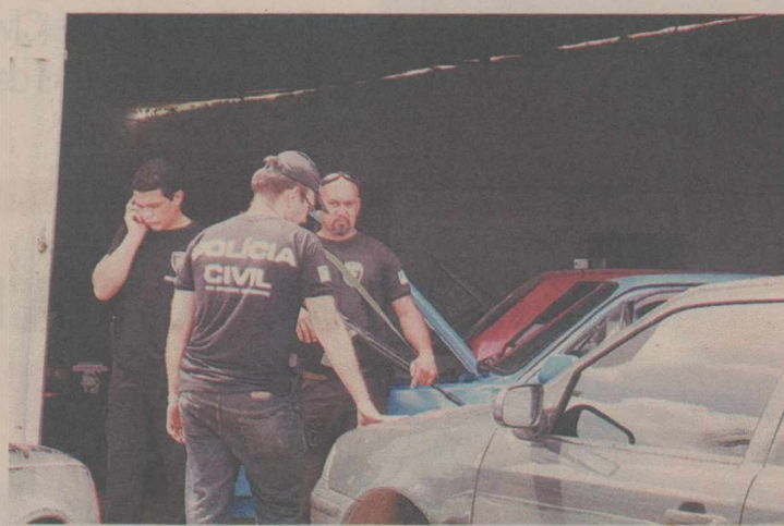
Por meio de denúncia anônima, policiais encontram desmanche em Nova Natal

Além das prisões, o delegado destacou, também, a apreensão de dois revólveres, 120 pedras de crack e mais uma porção pesando cerca de 100 gramas, além de sete veículos roubados e vários com impedimento judicial.