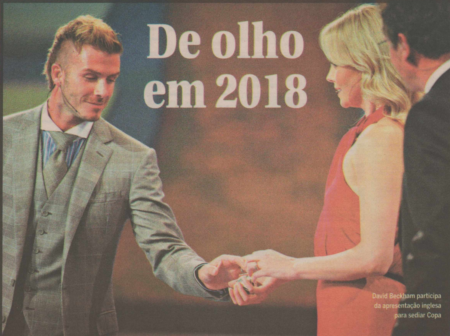
David Beckham participa da apresentação inglesa para sediar Copa

De acordo com o periódico, Gross, que está atualmente sem clube, já que em outubro deixou o Stuttgart, assumiria a função de Magath, caso este deixe o cargo. O conselho do Schalke convocou para esta quarta-feira uma reunião para discutir a situação da equipe, que não vive boa fase no Campeonato Alemão. Para agravar ainda mais o momento do time, o Schalke 04 sofreu uma goleada por 5 a 0 contra o Kaiserslautern neste fim de semana, o que deixou Magath na 'corda bamba' do comando do clube alemão.