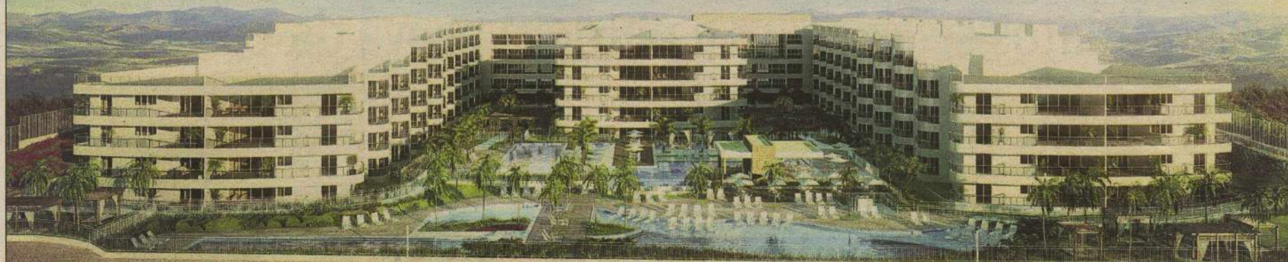
Perspectiva ilustrada da fachada posterior

Rota do Sol – Praia de Cotovelo – Parnamirim-RN