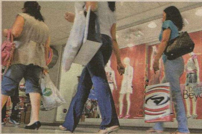
Depois do freio à ganância, busca por financiamentos teve um recuo de 17,1%