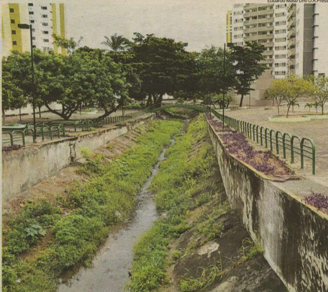
População da área denuncia que espaço sofre com sujeira e violência. Polícia Militar informa que não recebeu denúncias

balagens de produtos industrializados se acumulando no local.