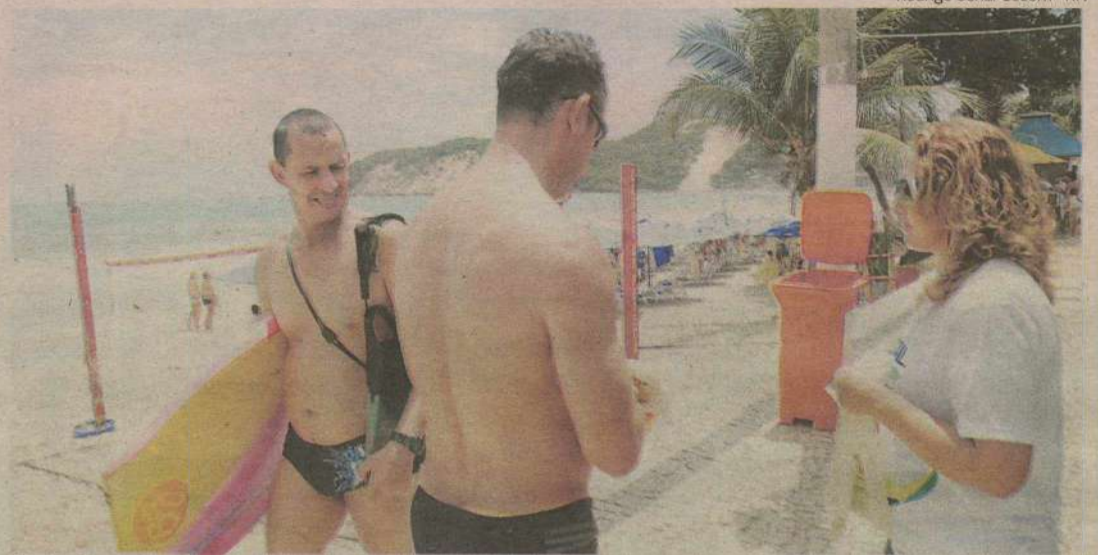
Atividades acontecerão até o dia 27 deste mês, em vários pontos da cidade, incluindo as praias urbanas

A estrutura montada contou com as unidades móveis da Secretaria Municipal de Saúde, da Secretaria Municipal de Turismo e uma tenda de apoio para atender a população. O objetivo das ações é educar a população, conscientizando-a da importância da preservação da cidade, bem como a garantia do bem-estar social dos natalenses e a prática de boas-vindas aos turistas. A blitz cidadã acontecerá até o dia 27 de