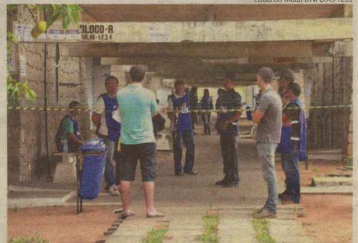
Horário de verão confundiu vários bacharéis, que acabaram sem fazer o exame