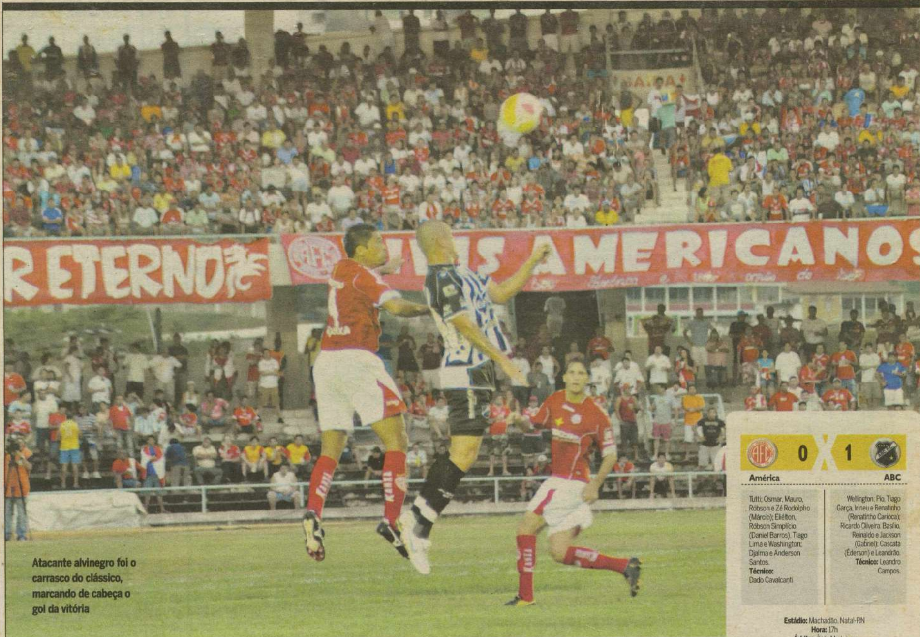
Atacante alvinegro foi o carrasco do clássico, marcando de cabeça o gol da vitória