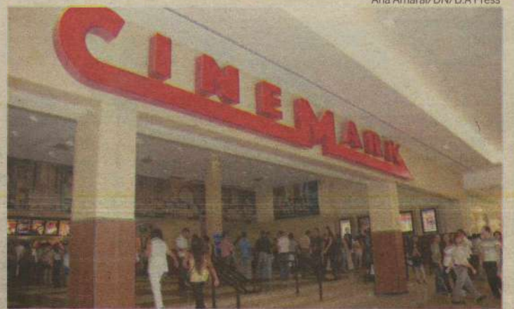
Clientes foram orientados a ir aos caixas para receber o dinheiro de volta

Pouco tempo depois a sala 3D, que exibia o filme "Santuário", foi liberada. Os clientes que chegavam para comprar ingressos eram informados pela atendente que as sessões das outras seis salas estavam suspensas "por conta de um problema técnico ainda não identificado". A repor-