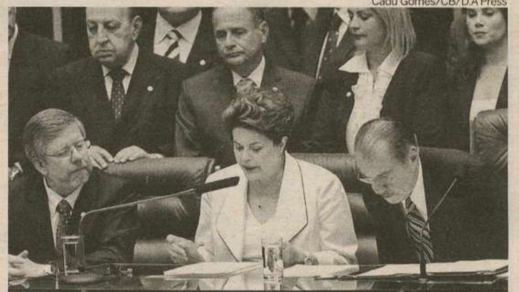
Dilma entre os presidentes da Câmara (E) e do Senado: fiéis escudeiros

Nos últimos dias, Dilma escalou diversos aliados para alertar aos dissidentes que confrontar as aspirações do Executivo não será empreitada profícua. O líder do gover-