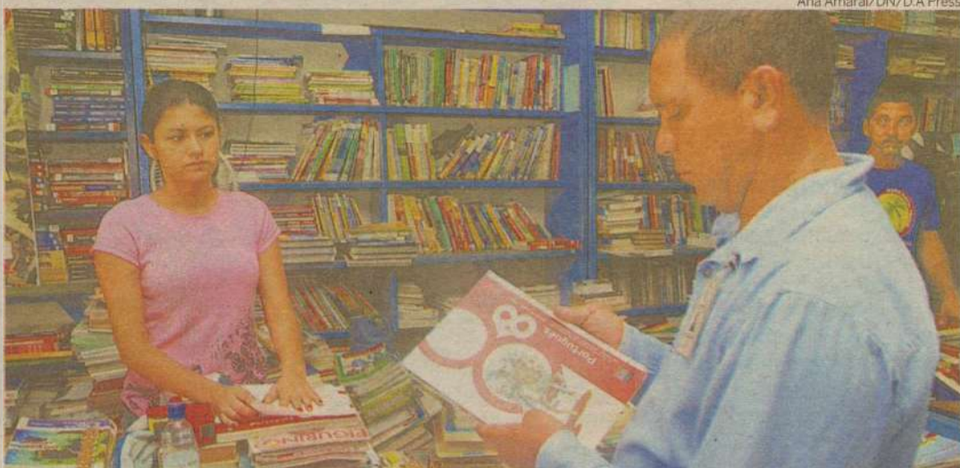
Comprar o livro didático usado, em sebos, é alternativa para aliviar o bolso dos pais e evitar gastos com novas unidades