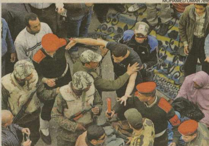
Polícia e exército trocaram tiros em manifestação realizada ontem pela manhã

Em seu comunicado, o quinto divulgado desde quinta-feira passada e o terceiro desde a renúncia do presidente Hosni Mubarak, o Conselho também diz que as Forças Armadas "assumem a representação do Egito no inte-