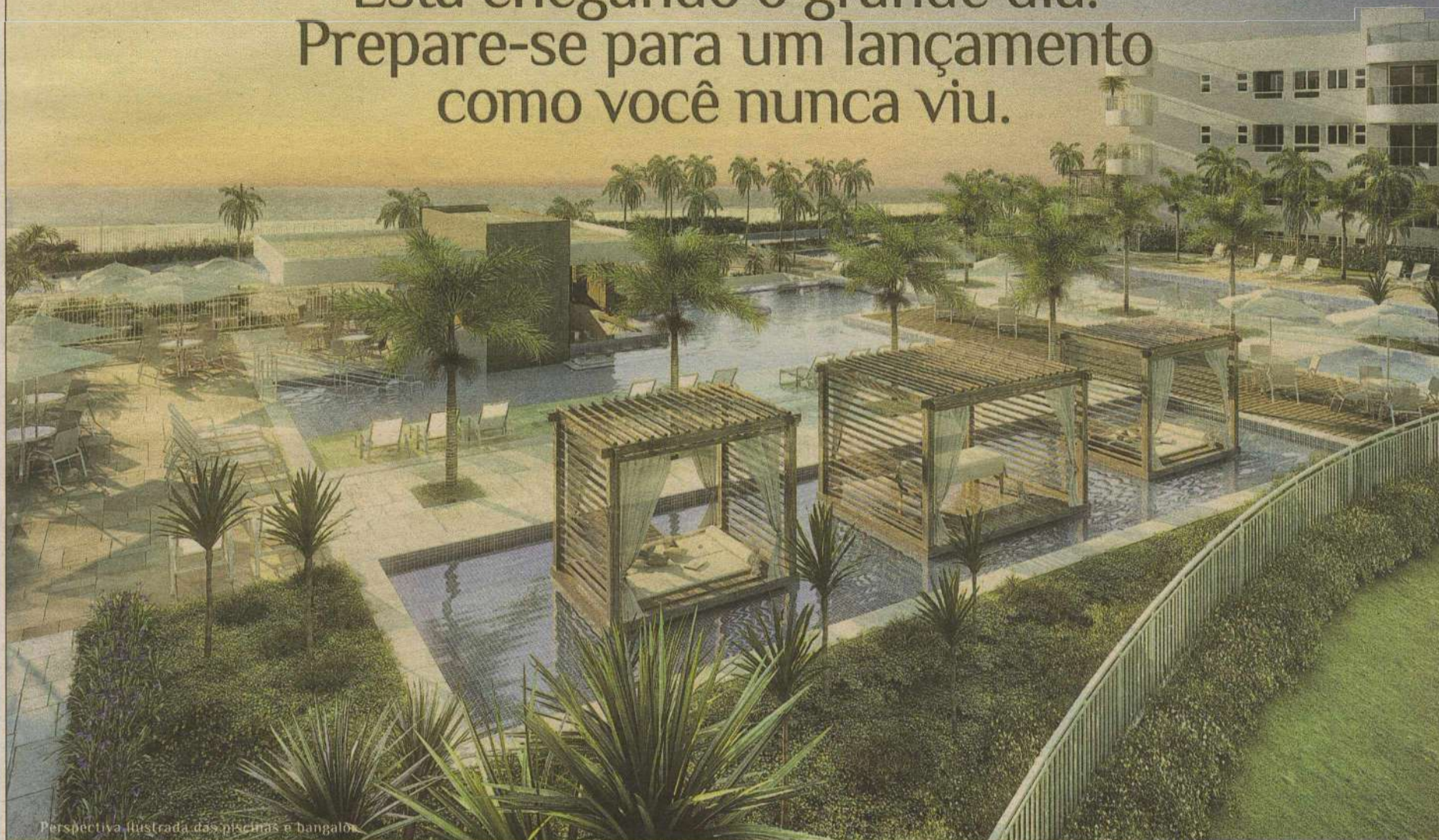
Perspectiva ilustrada das piscinas e bangalôs

Está chegando o grande dia. Prepare-se para um lançamento como você nunca viu.