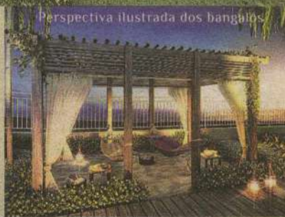
Perspectiva ilustrada dos bangalôs