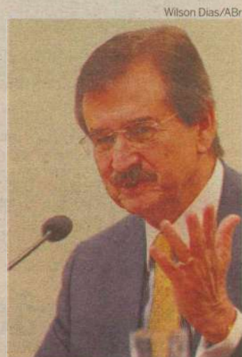
Peluso lançou "pacto republicano" pela modernização do Judiciário

Pelo menos 22 leis foram aprovadas entre 2004 e 2009, a maioria focada no aprimoramento da legislação para que os processos andassem mais rápido. Duas leis que criaram a súmula vinculante do STF e a repercussão geral foram responsáveis por uma redução significativa na quantidade de processos que chegam ao STF: de cerca de 100 mil em 2007 para 41 mil em 2010.