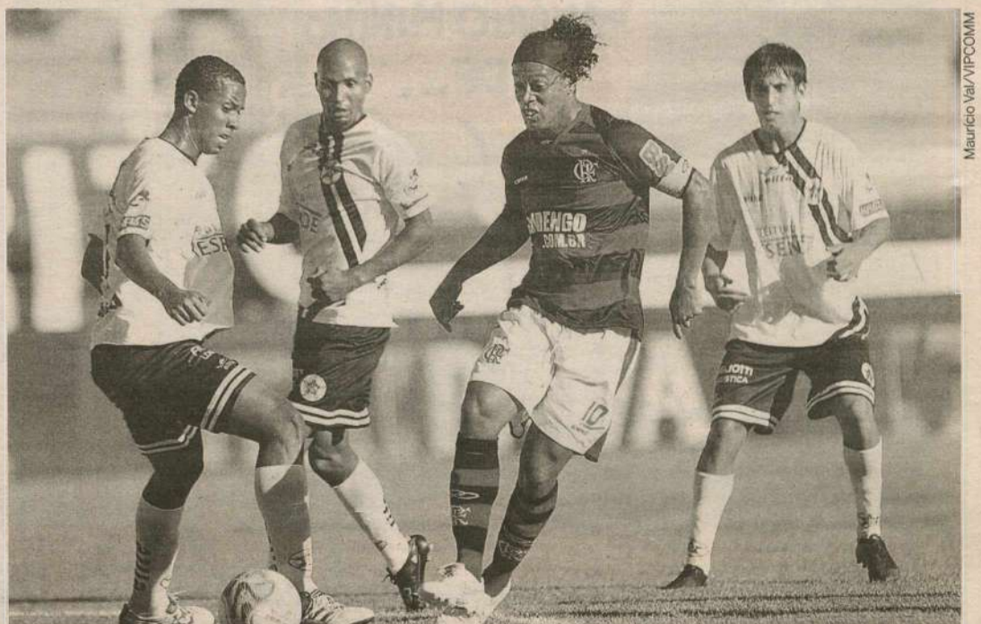
Ronaldinho Gaúcho recebeu forte marcação e apareceu pouco no jogo de ontem pela Taça Guanabara

Somando 13 pontos, o Resende acabou perdendo a classificação no saldo de gols para o Boavista, que venceu o Nova Iguaçu por 5 a 3. A equipe de Saquarema irá enfrentar o Fluminense tentando buscar uma vaga na decisão da Taça Guanabara. A outra semifinal será entre Fluminense e Boavista. Mais uma vez, o atacante Rafael Moura tratou de salvar o Fluminense. Agora, marcando o gol da vitória do Tricolor sobre o Madureira por 1 a 0, ontem, no Raulino de Oliveira. Com o em-