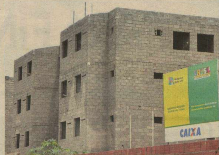
Apenas projetos que estejam em áreas urbanizadas poderão receber recursos