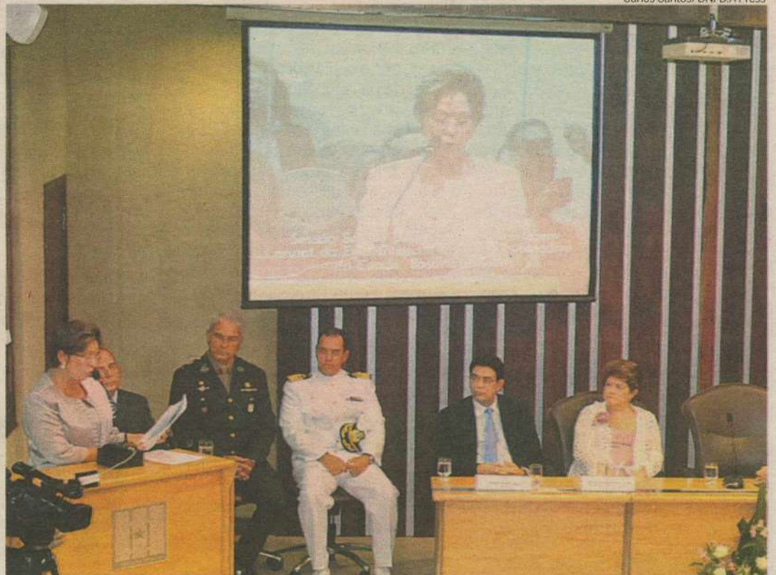
Governadora diz que problemas do RN viraram preocupação nacional e destaca risco de perder transferências federais

A governadora ressaltou ainda que as dívidas comprometeram todo o orçamento deste ano. “Toda esta dívida não foi incluída no Orçamento de 2011. Para pagá-la, serão necessárias suplementações orçamentárias, com a anulação de outras rubricas do atual Orçamento”, advertiu. Ela explicou