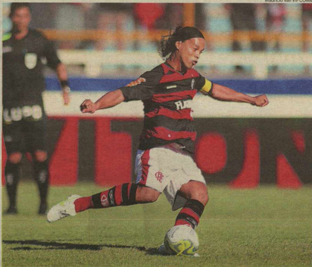
Ronaldinho Gaúcho é a grande atração no jogo entre Flamengo e Murici, em Alagoas

Caso o Rubro-negro vença o Murici por dois ou mais gols de diferença no duelo de ida, não haverá a necessidade de que o jogo de volta seja realizado. O vitorioso deste confronto enfrentará o ganhador de Fast-AM e Fortaleza na segunda fase. Devido à fragilidade do adversário, os torcedores esperam uma grande atuação de Ronaldinho. Como existem muitos Flamenquistas na região, a expectativa é de que o estádio esteja lotado para o jogo. Ronaldinho ainda não passou por esta experiência