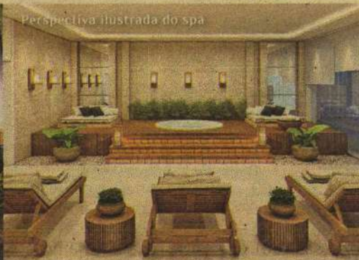
Perspectiva ilustrada do spa