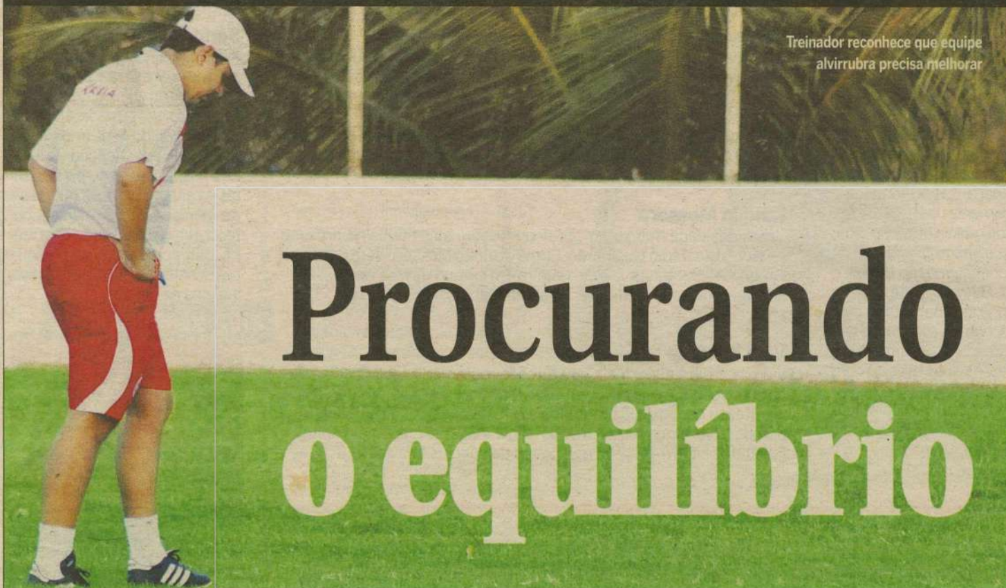
Treinador reconhece que equipe alvirrubra precisa melhorar

EDITOR &gt;&gt;&gt; Fábio Pacheco (fabiopacheco.rm@dabr.com.br) esportes.rm@dabr.com.br