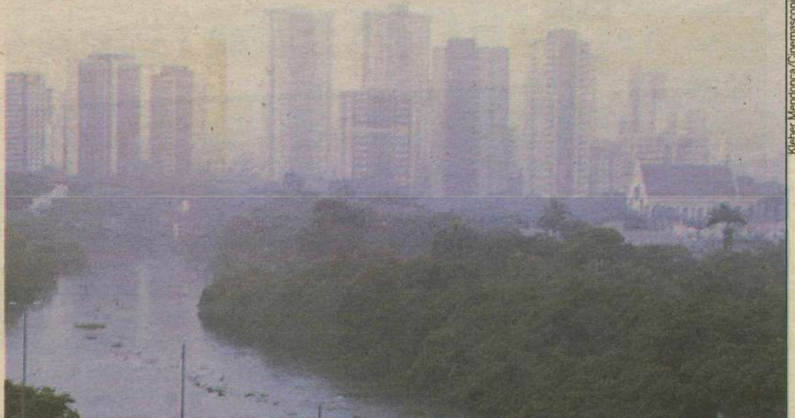
Terceira mostra competitiva, hoje, exibirá mais sete filmes, como Recife Frio e Haruo Ohara , na UnP da Roberto Freire

O cineasta – autor do documentário Sangue do Barro , junto com