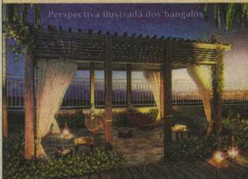
Perspectiva ilustrada dos bangalôs

Sofisticados apartamentos de 57 a 310 m 2 com suíte.