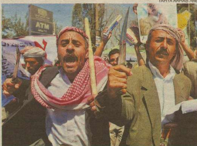
Populares foram às ruas para pedir a saída do presidente Saleh no Iêmen

Já na capital iemenita, ontem foi quarto dia consecutivo de enfrentamentos entre opositores e partidários do presidente, Ali Abdala Saleh. Há semanas estão sendo realizados protestos liderados pela oposição, o que forçou no dia 2 de fevereiro Saleh, no poder desde 1990, a recuar sobre reformas constitucionais com as quais buscava se perpetuar no poder. Cerca de mil ativistas de direitos humanos, estudantes universitários