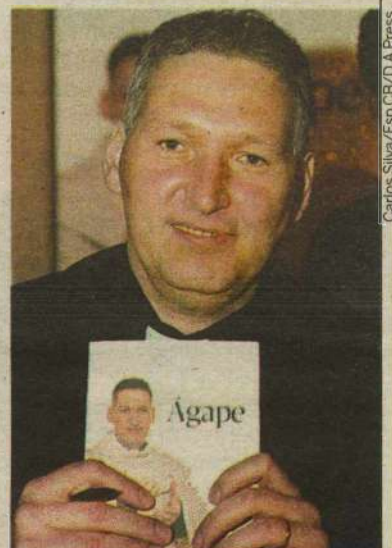
O sacerdote autografará o best-seller hoje, das 11h às 22h, na Siciliano

Madre Teresa de Calcutá e Zilda Arns são alguns exemplos evocados pelo sacerdote para ilustrar as manifestações do ágape, seja pela via da caridade, seja na forma do amor ao próximo, sem exigências nem cobranças. O amor ágape, salienta o autor, não é contemplativo nem se encerra no indivíduo, mas exige ação pessoal e ação interpessoal.