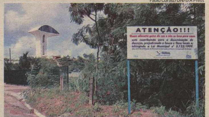
Dez placas alertam que gatos não devem ser alimentados, revoltando ONG