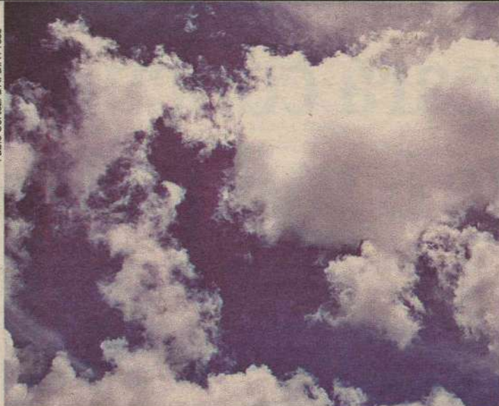
Emparn prevê precipitações de 800 a 900 milímetros, um bom indicador para economia rural, segundo Gilmar Bristot

normal, como aconteceu em 2008, repetindo-se em 2009.