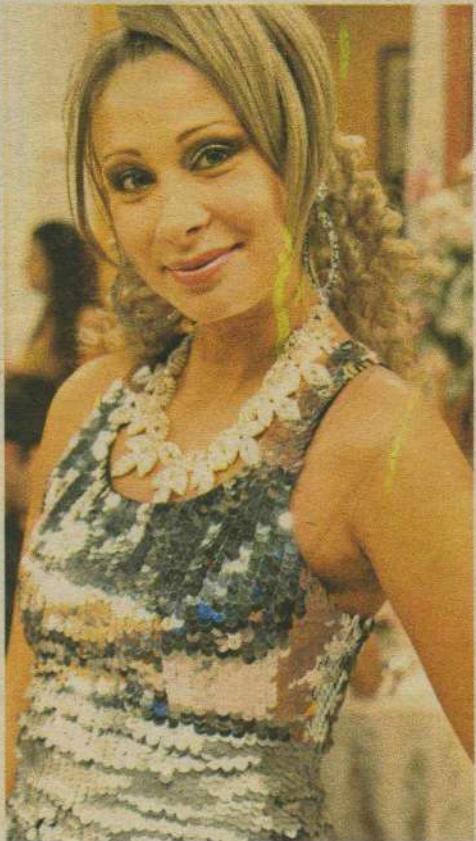
A TURMA DO ZORRA TOTAL LEVA HUMOR AO TELESPECTADOR NAS NOITES DE SÁBADO