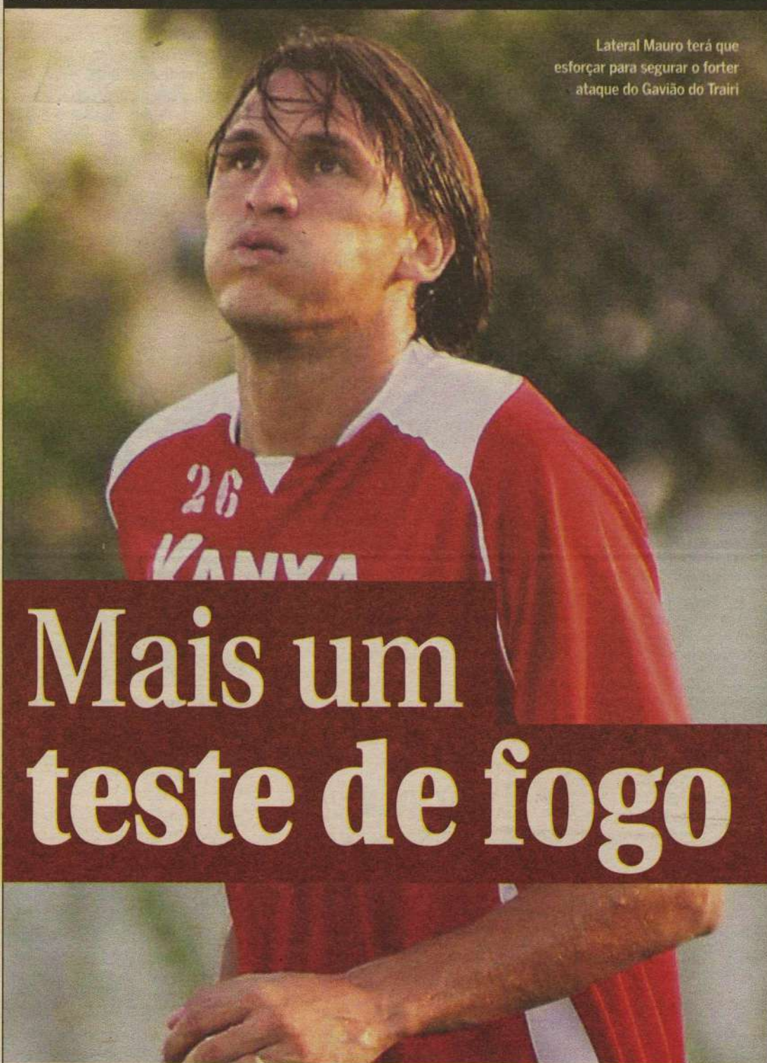
Lateral Mauro terá que esforçar para segurar o forter ataque do Gavião do Trairi

EDITOR >> Fábio Pacheco (fabiopacheco.m@dabr.com.br) esportes.rn@dabr.com.br