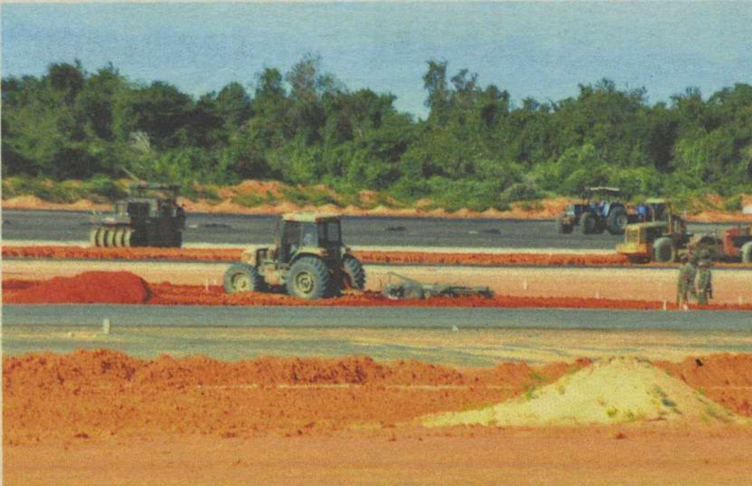
Mínimo para vencer a concessão do aeroporto de São Gonçalo é de R$ 51,7 mi, mas vencedor terá que investir até R$ 650 mi