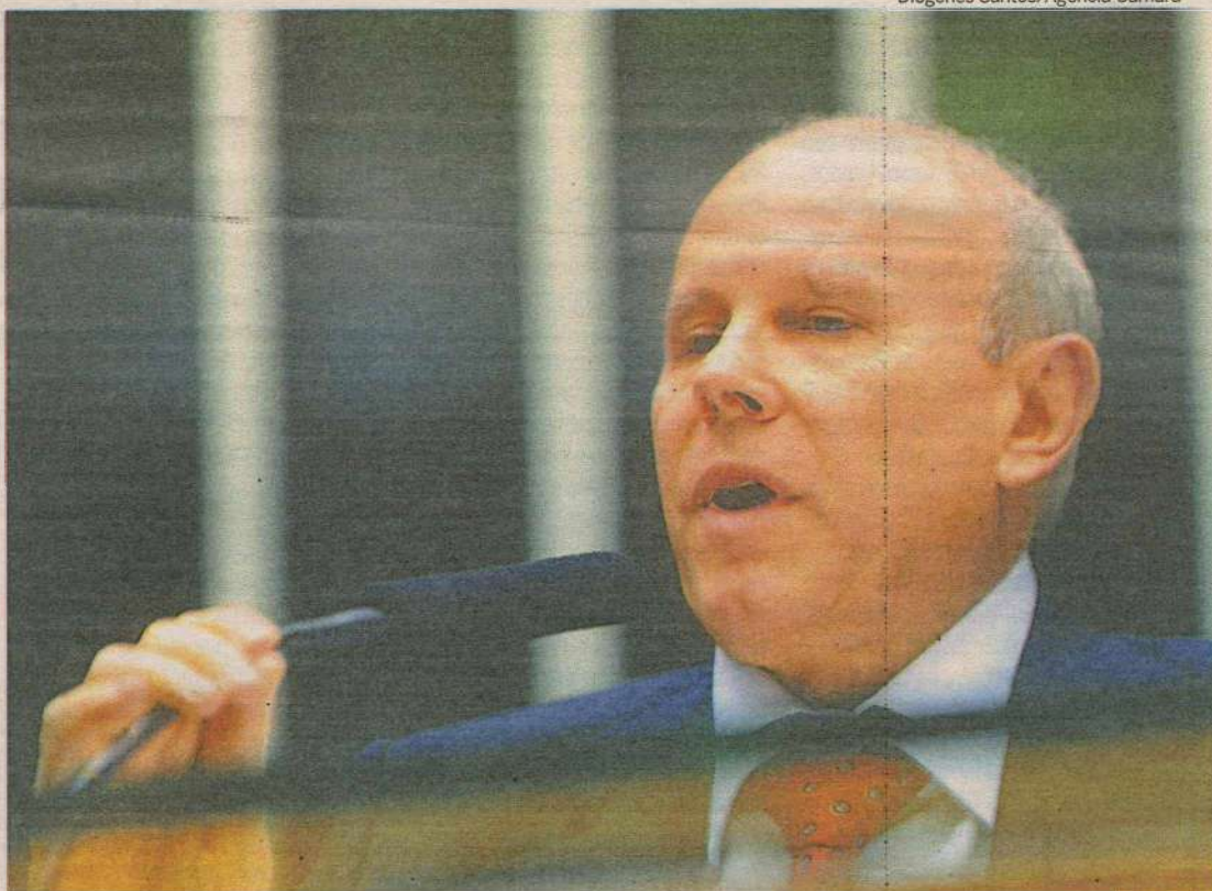
"Os preços estão caindo e aparecem no IPCA de abril. Daqui para frente, vão cair mais ainda", afirmou o ministro

Além da desaceleração do preço das commodities, consideradas uma das principais causas da inflação mundial e da brasileira, Mantega destacou o começo da safra no Brasil, que repercute no preço dos alimentos, como outro bom sinal para a queda da inflação. "Os preços estão caindo e aparecem no IPCA de abril. Daqui para frente, vão cair mais ainda", afirmou.