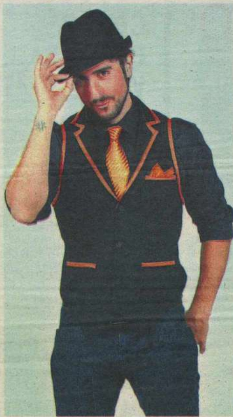
MARCOS MION COMANDA O LEGENDÁRIOS, NA TV RECORD