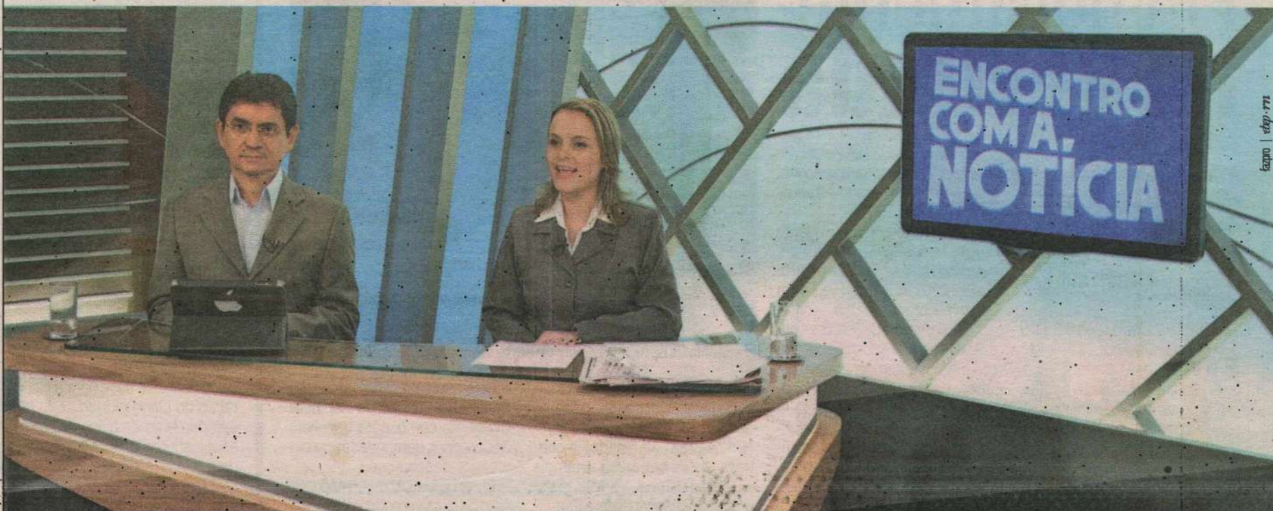
fazp - r77