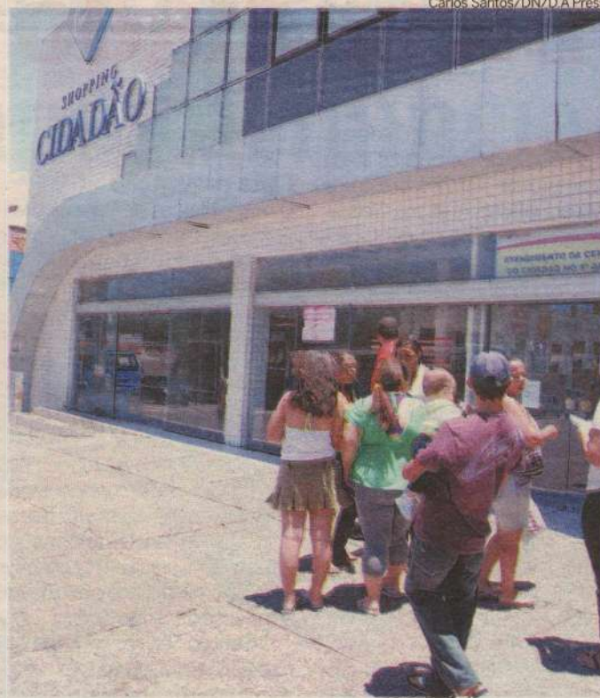
Secretaria Estadual de Justiça e Cidadania promete reabrir unidade amanhã