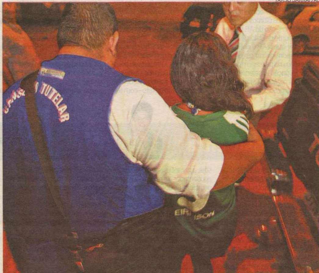
Menina disse ter procurado ajuda aos vigilantes que estavam nas cabines de segurança e não foi atendida

A menina contou que uma mulher entrou em contato com ela na segunda-feira passada, em uma praia de Belém, oferecendo dinheiro para realizar alguns trabalhos domésticos em Santa Izabel. Na terça-feira, ela teria sido conduzida ao presídio junto com outras duas meno-