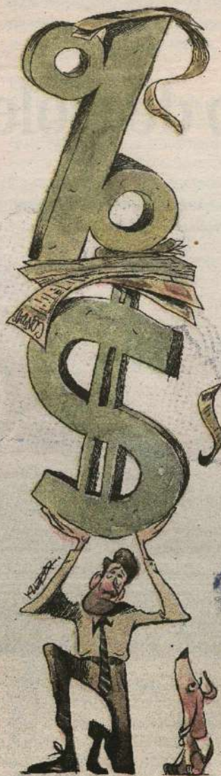
Kleber Sales/CE/DA Press

Na reforma do financiamento, todos os benefícios subsidiados, rurais, do "velho Funrural", autônomos e micro-empresendedores, do "novo Funrural" etc. deverão ser custeados pelo Tesouro. A conta dos rurais do velho é muito alta. A do novo será alta. O artigo 1º da nova Lei de Custeio terá a seguinte redação: "é proibida a concessão de benefício sem financiamento".