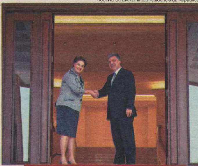
Presidenta foi recebida pelo primeiro-ministro turco Recep Erdogan

Em seguida, a presidenta acrescentou que essas "políticas monetárias excessivamente