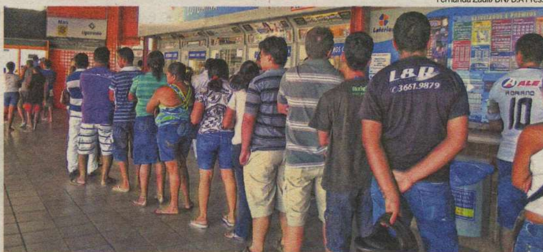
Sem saída: mesmo com bancos fechados, contas em atraso sofrerão cobranças de multas e juros

Apesar da greve dos bancos, os clientes que atrasarem o pagamento de suas contas estarão sujeitos a multas e juros. Nas lotéricas é possível pagar faturas da Caixa Econômica Federal (CEF), mesmo após