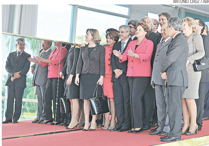
▶ Dilma recebeu senadores do PT

“A SBPC e a ABC (Academia Brasileira de Ciências) consideraram precipitada a decisão tomada na Câmara dos Deputados, pois não levou em consideração aspectos científicos e tecnológicos na construção de um instrumento legal para o país”, concluiu a entidade em nota a nota.