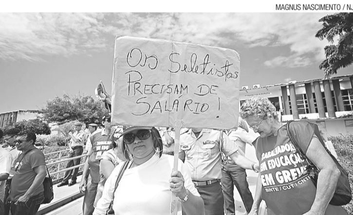
► Grevista segura cartaz durante protesto