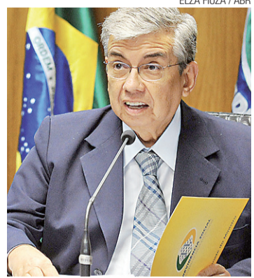
▶ Garibaldi Alves

As centrais sindicais se reuniram ontem com o ministro Garibaldi Alves para reivindicar mudanças nas aposentadorias. Entre as solicitações, está o fim do fator