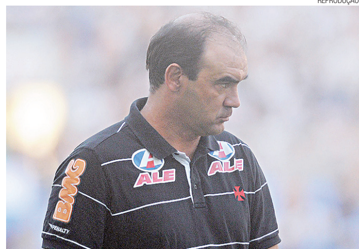
► Ricardo Gomes, técnico do Vasco: primeira partida em casa