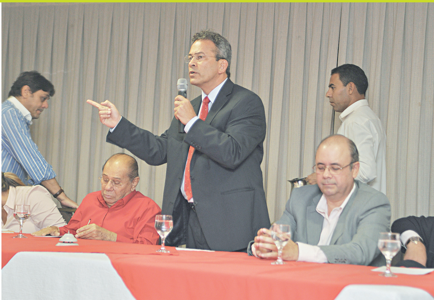
► Hermano discursa no ato de posse