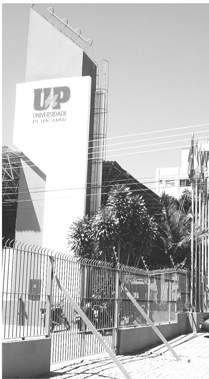
► Universidade Potiguar mobiliza estudantes de Ciências Exatas e Humanas ao realizar palestras, debates, exibição de filmes, mini-cursos e exposições sobre temas da área

A inauguração oficial do mestrado ocorreu nesta semana. As inscrições para o processo seletivo já estão abertas no site da UnP. Serão 12 vagas para o Campus Natal e 12 para o Campus Mossoró.