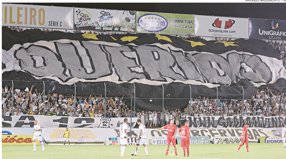
▶ ABC venceu o rival América em pesquisa de popularidade

/ TORCIDA / ALVINEGRO POTIGUAR APARECE COM DIFERENÇA DE QUASE 10% EM RELAÇÃO AO RIVAL AMÉRICA. EM MOSSORÓ, POTIGUAR E BARAÚNA TÊM EMPATE TÉCNICO