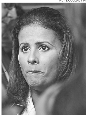
► Mícarla: rejeição

De acordo com o levantamento, 60,08% dos 390 entrevistados que afirmaram ter visto ou ouvido as propagandas responderam que a opinião sobre a administração continua a mesma. Ao todo, a pesquisa ouviu 556 pessoas entre os dias 22, 23 e 24 de maio em 35 bairros de Natal - 107 disseram não ter visto ou ouvido as propagandas e 59 afirmaram ter ouvido falar.