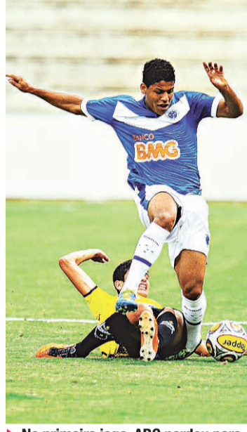
▶ No primeiro jogo, ABC perdeu para o Cruzeiro e complicou classificação