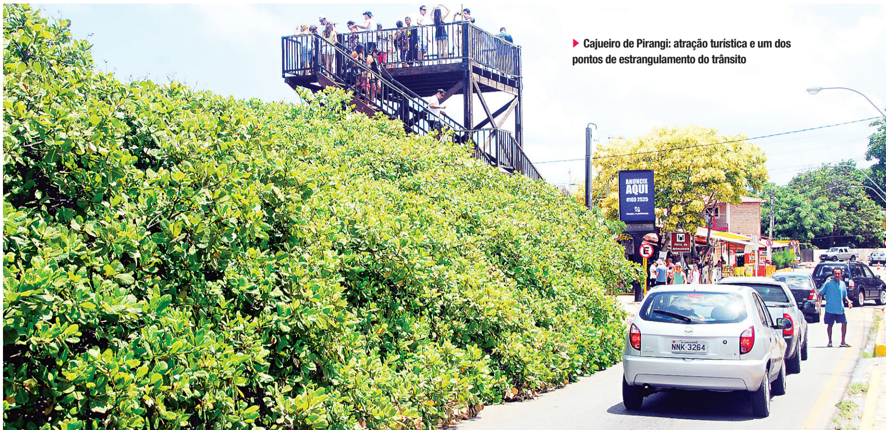
▶ Cajueiro de Pirangi: atração turística e um dos pontos de estrangulamento do trânsito

/ TRÂNSITO / ESTAÇÃO MAIS FESTEJADA DO ANO REPETE EM 2012 OS VELHOS PROBLEMAS DE SEMPRE: FALTA MOBILIDADE NO LITORAL SUL E NORTE E UMA SIMPLES IDA À PRAIA PODE SE TRANSFORMAR NUMA AVENTURA