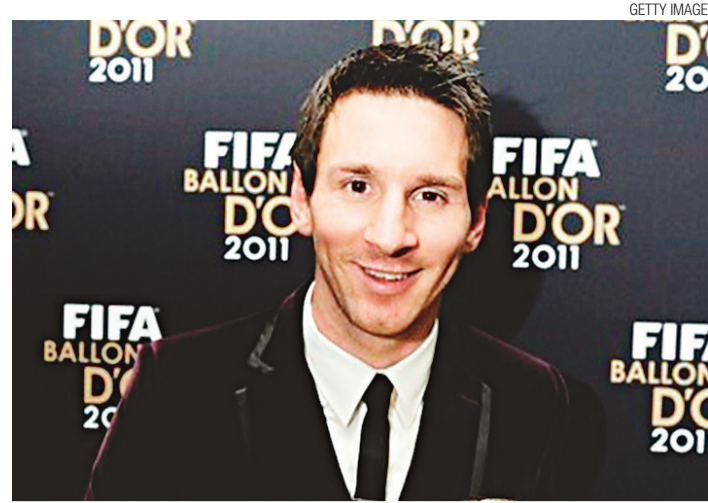
▶ Lionel Messi: tricampeão

Entre os vencedores do final de semana, destaque para o Palmeira de Goianinha que bateu o Flamengo-PB por 3 a 1 e o Potiguar de Mossoró que derrotou o Horizonte-CE por 1 a 0 com gol marcado por Rafael Matos, de falta, aos 35 minutos do primeiro tempo. O Caicó derrotou um selecionado da cidade de Monteiro, na Paraíba, por 2 a 0. Vinícius e Soares marcaram para o time seridoense. O Assu bateu a equipe de Areia Branca pelo mesmo placar. ABC e Santa Cruz não fizeram realizaram amistosos no final de semana.