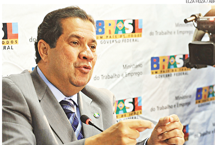
► Ex-ministro deixou o cargo depois da divulgação de que foi funcionário fantasma

Na frente do prédio onde ocorria a reunião, um grupo chamado Movimento de Resis-