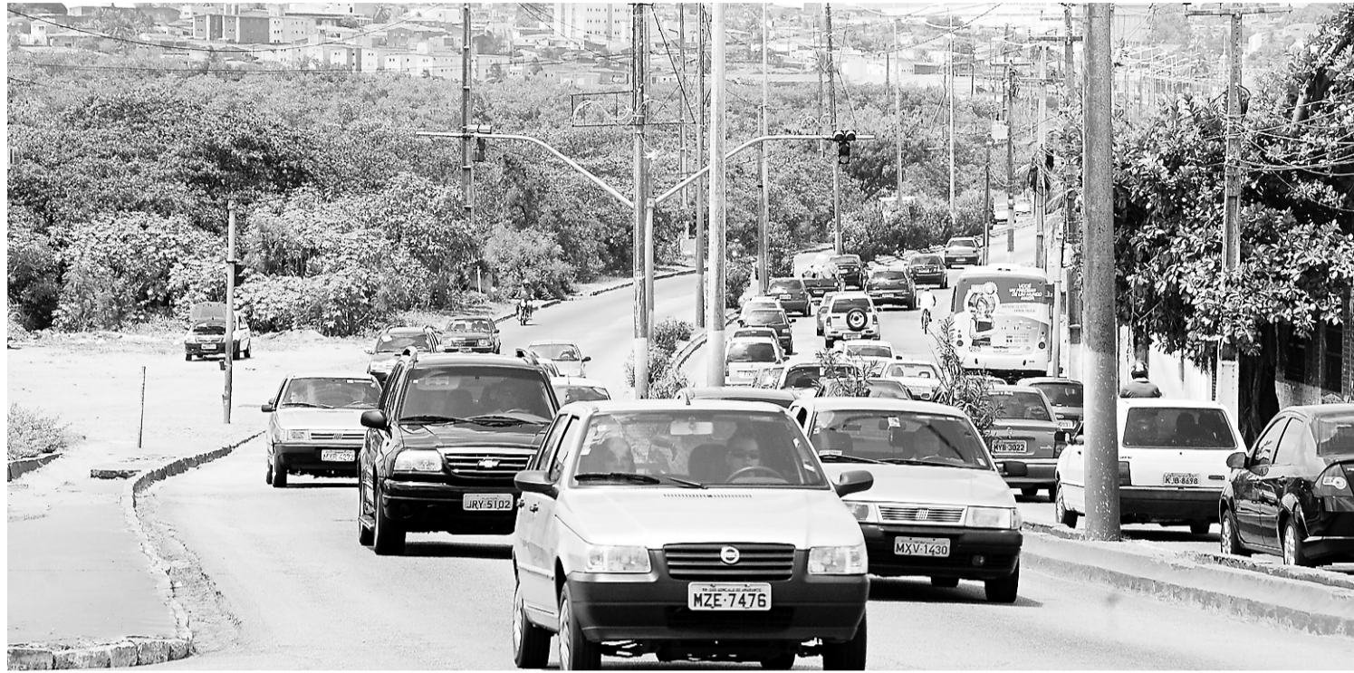
▶ Projeto das obras de mobilidade prevê a desapropriação de 10 mil metros quadrados de mangue, na avenida Felizardo Moura, próximo à ponte de Igapó