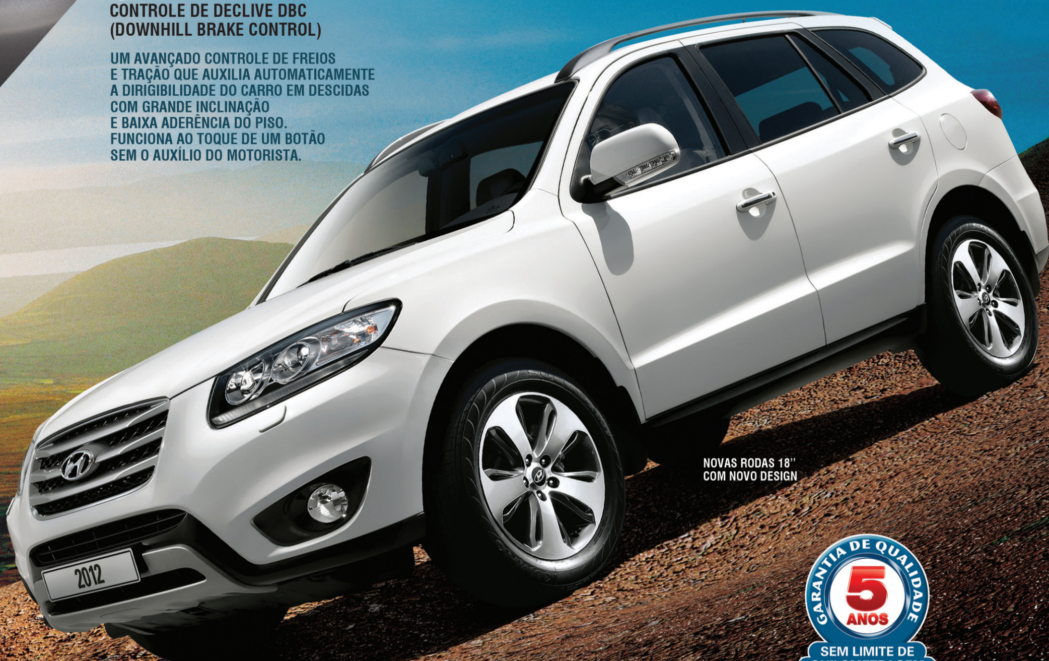
NOVAS RODAS 18" COM NOVO DESIGN

UM AVANÇADO CONTROLE DE FREIOS E TRAÇÃO QUE AUXILIA AUTOMATICAMENTE A DIRIGIBILIDADE DO CARRO EM DESCIDAS COM GRANDE INCLINAÇÃO E BAIXA ADERÊNCIA DO PISO. FUNCIONA AO TOQUE DE UM BOTÃO SEM O AUXÍLIO DO MOTORISTA.