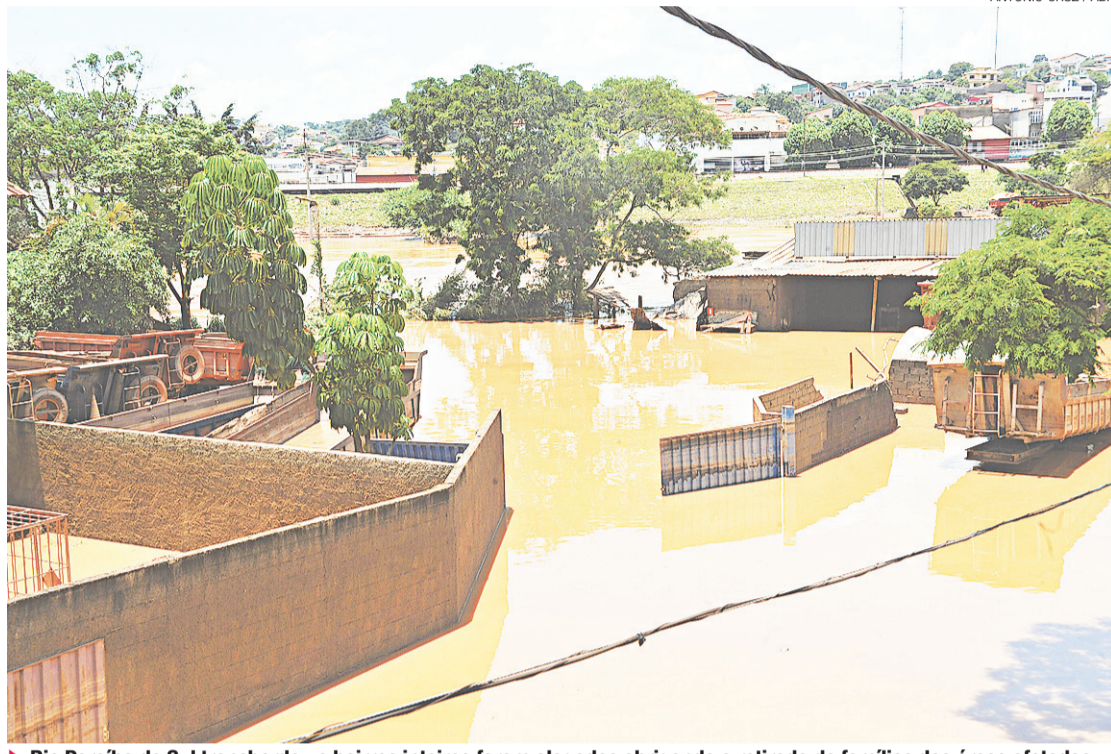
► Rio Paraíba do Sul transbordou e bairros inteiros foram alagados obrigando a retirada de famílias das áreas afetadas

Desde a tarde de ontem, chove forte na região do Médio Pa-