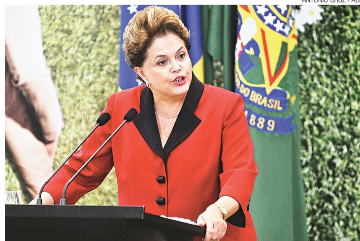
Dilma Rousseff falou no rádio sobre medidas para aquecer economia este ano

Dilma lembrou que as novas regras do Supersimples também entram em vigor em janeiro – para se enquadrar como microempresa, o limite de faturamento