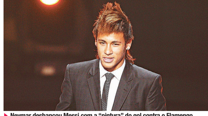
▶ Neymar desbancou Messi com a “pintura” do gol contra o Flamengo

“O Santos não é fácil. É o melhor time de seu continente, não pode ser nunca fácil. Conseguimos com que tivessem poucas chances. Se um time está na final de um Mundial, não é um time pequeno”, afirmou.