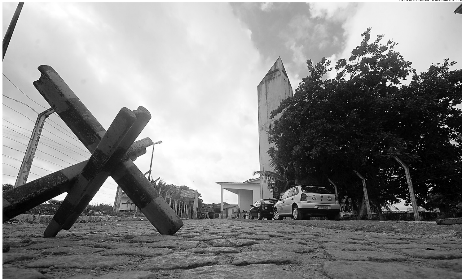
▶ Presos conseguiram escapar das carceragens por um antigo túnel com mais de oito metros de comprimento, escavado a partir do Pavilhão 1