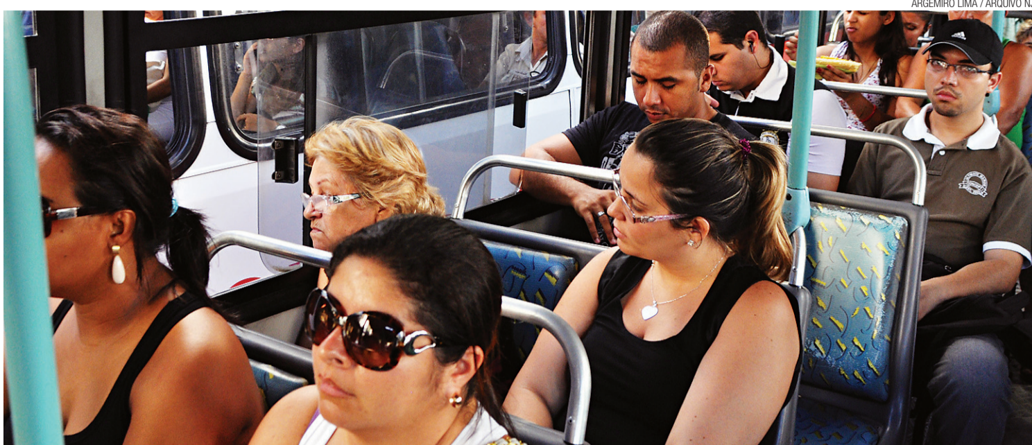
► Decisão judicial determina que, mesmo diante de uma paralisação do Sintro, 70% da frota deve atender aos usuários de transporte coletivo no horário de pico