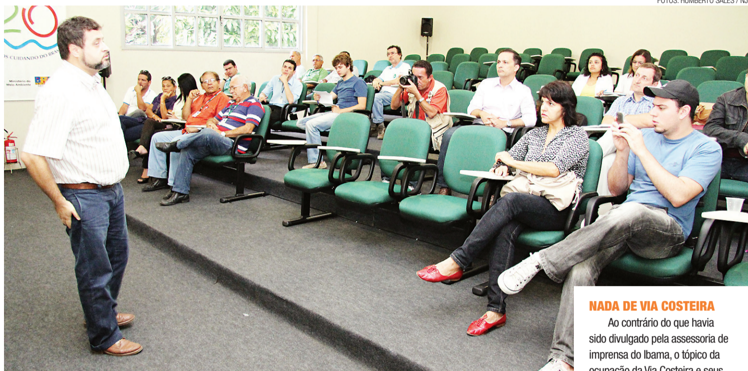
► Evento fez parte do projeto Doc Natal, iniciativa de analistas ambientais e estudantes de cinema da UNP

A palestra teve como tema principal os ecossistemas das praias e a maneira como se dá a interferência humana nesses ambientes. O encontro fez parte do projeto Doc Natal, iniciativa de analistas ambientais e estudantes de cinema da Universidade Potiguar (UnP) com o objetivo de produzir um documentário a respeito do tema "O que está errado com o meio ambiente na