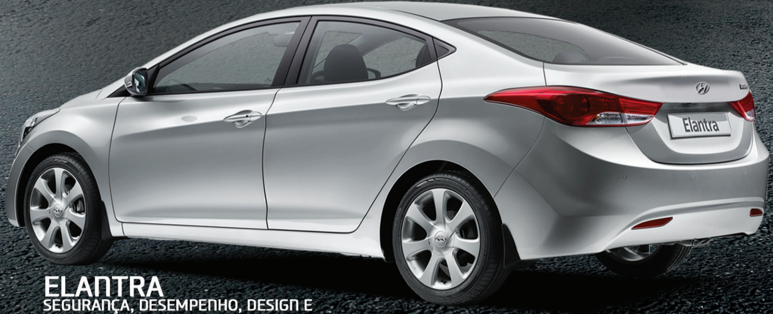
ELANTRA SEGURANÇA, DESEMPENHO, DESIGN E TECNOLOGIA QUE CONQUISTARAM O MUNDO.