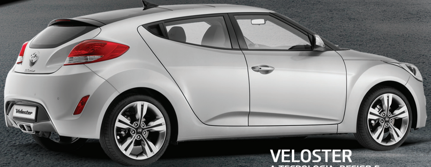
VELOSTER A TECNOLOGIA, DESIGN E SEGURANÇA DE UM CARRO GENIAL.