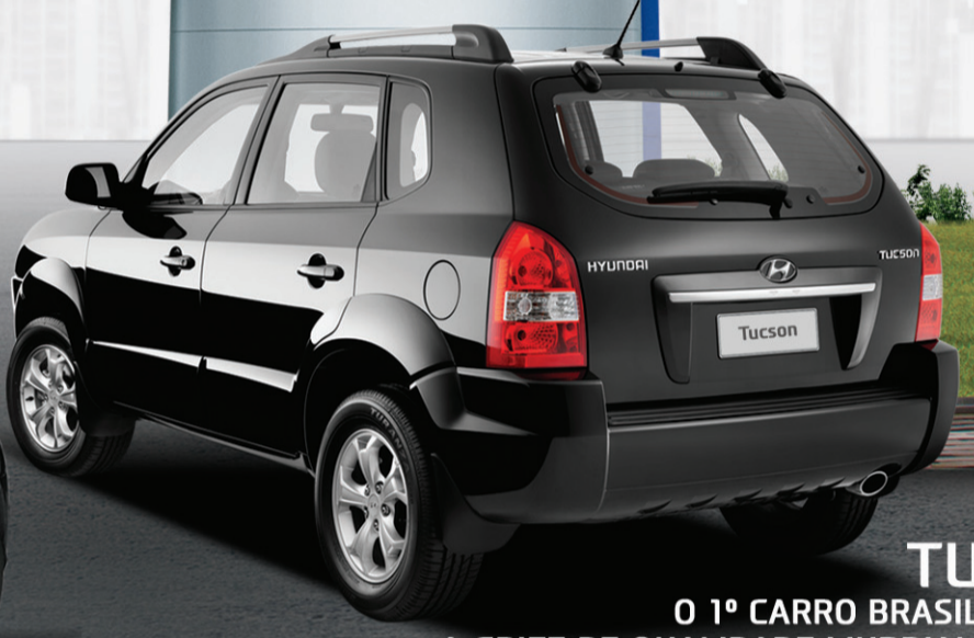
TUCSON O 1º CARRO BRASILEIRO COM A GRIFE DE QUALIDADE MUNDIAL HYUNDAI.