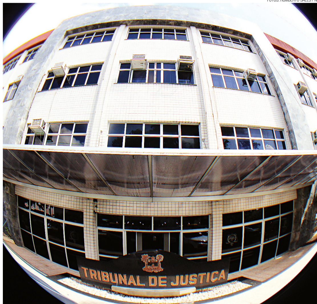
► Tribunal de Justiça do Rio Grande do Norte cumpre resolução do CNJ

Enfatiza ainda que nenhum servidor ou magistrado do Tribunal de Justiça do RN recebe remuneração em desacordo com o teto constitucional e a única mudança, a partir de agora, é a transparência e a ampla divulgação da folha por meio da internet.