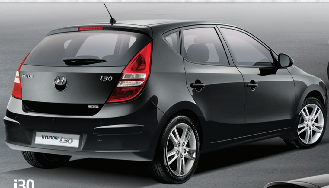
i30 O HATCH MÉDIO MAIS COMPLETO, EQUIPADO E PREMIADO DO MERCADO.