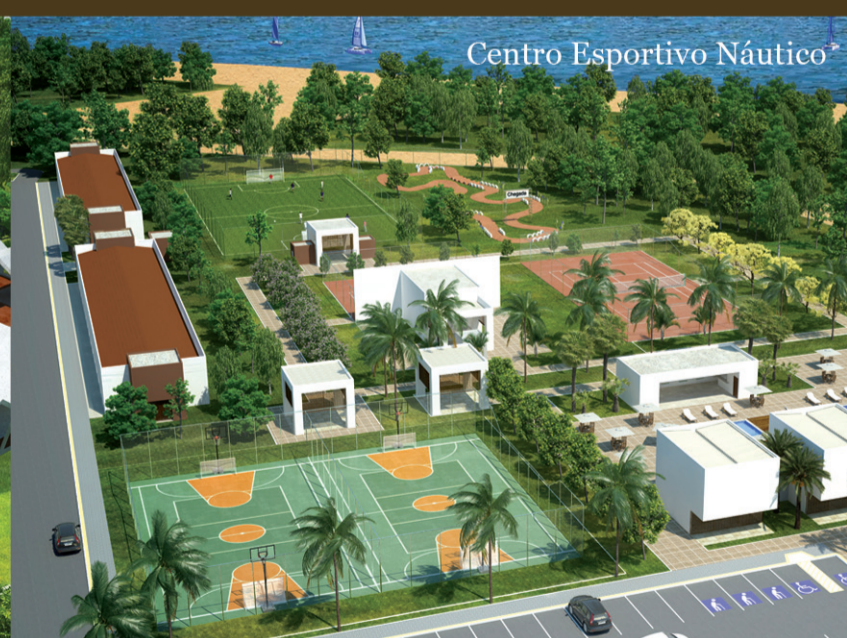
Centro Esportivo Náutico

Informações: 84 3207-2100 - www.ecocil.com.br