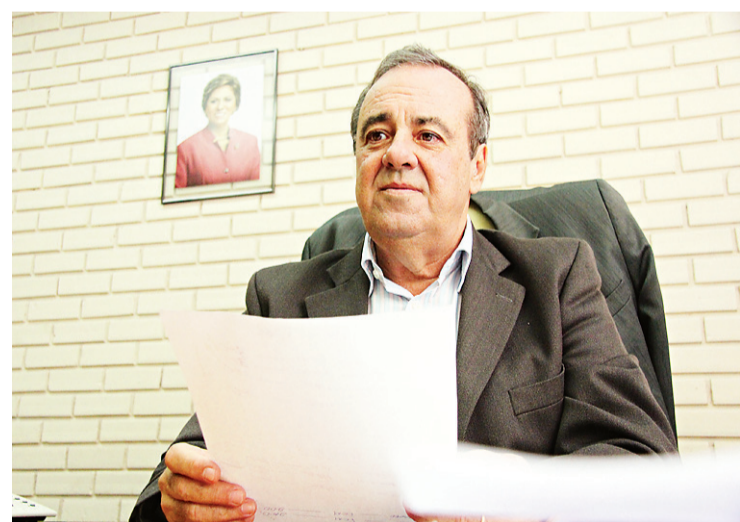
► Kércio Pinto, secretário estadual de Justiça e Cidadania

“O importante é que isso será feito em conjunto. Não vai ser como antigamente que o Ministério Público movia uma ação e a gente tinha que seguir”, ressaltou Pinto. Para nortear os próximos passos deste