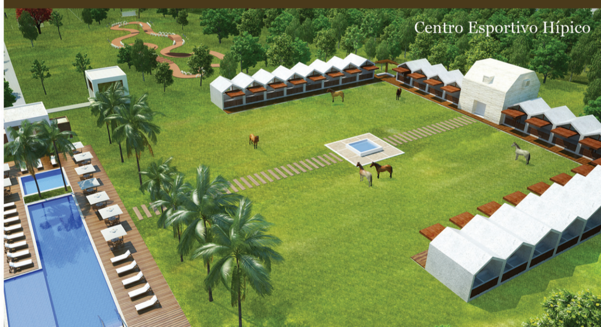
Centro Esportivo Hípico