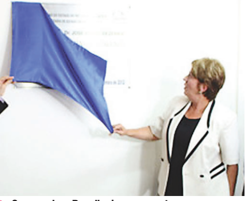
Governadora Rosalba inaugura setor