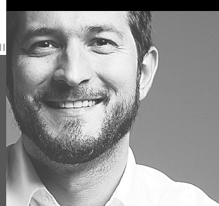
Carlos Fialho escreve nesta coluna aos sábados