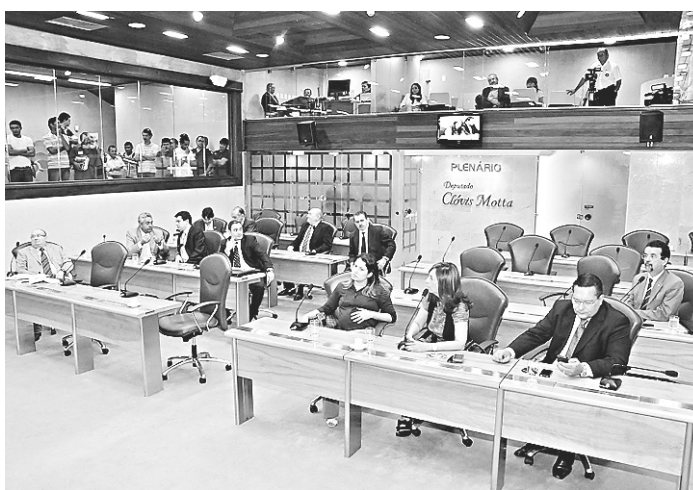
▶ Deputados encerraram o ano legislativo com as votações de ontem

/ VOTAÇÃO / APÓS TRÊS SESSÕES, GOVERNO CONSEGUE APROVAÇÃO DA ASSEMBLEIA LEGISLATIVA PARA EMPRÉSTIMO DE R$ 614,5 AO BANCO DO BRASIL E BNDES