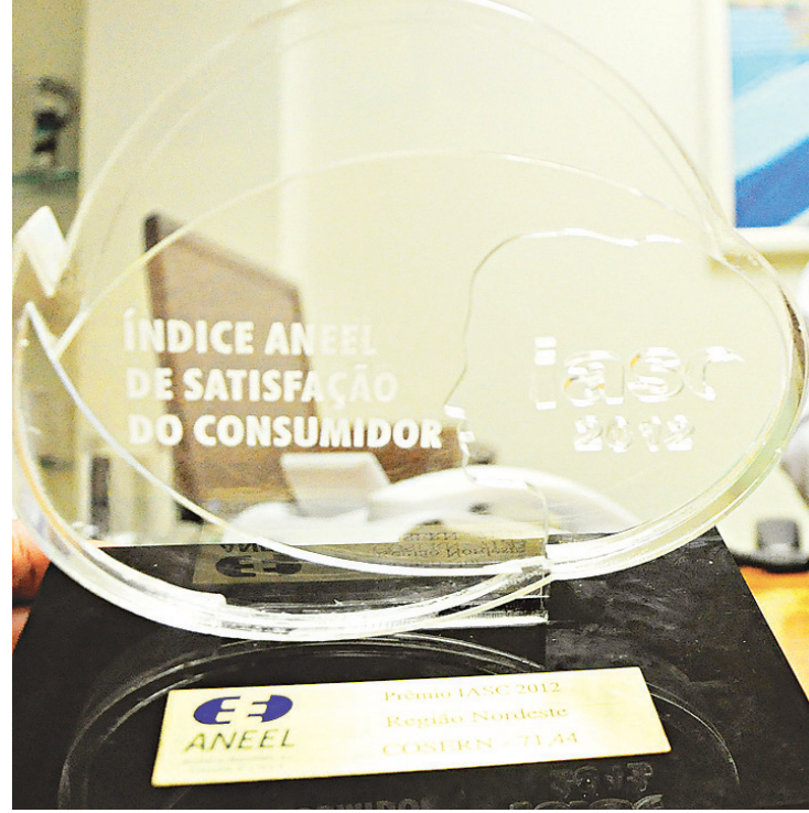
► O troféu de satisfação instituído pela Agência Nacional de Energia Elétrica

Concluindo, o presidente reforça que o prêmio IASC é um reconhecimento importante, porém o intuito de se aperfeiçoar segue independente dos estímulos externos. “Encaramos como um reconhecimento do consumidor. Por outro lado, ele nos traz uma responsabilidade cada-