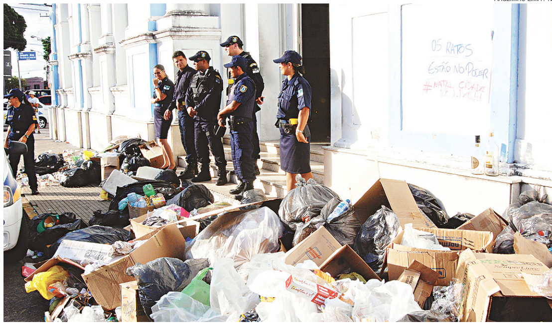
► Guardas Municipais não impediram que estudantes jogassem lixo na calçada da prefeitura

Guardas municipais ficaram na porta da Prefeitura para evitar