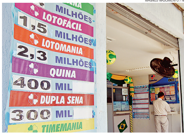
Casas lotéricas fazem apostas de Timemania até 13h de hoje

Sempre atentos ao mercado, os dirigentes optaram por recorrer à Timemania, que pode ser o maior patrocinador de ambos os clubes. Para que esta injeção financeira