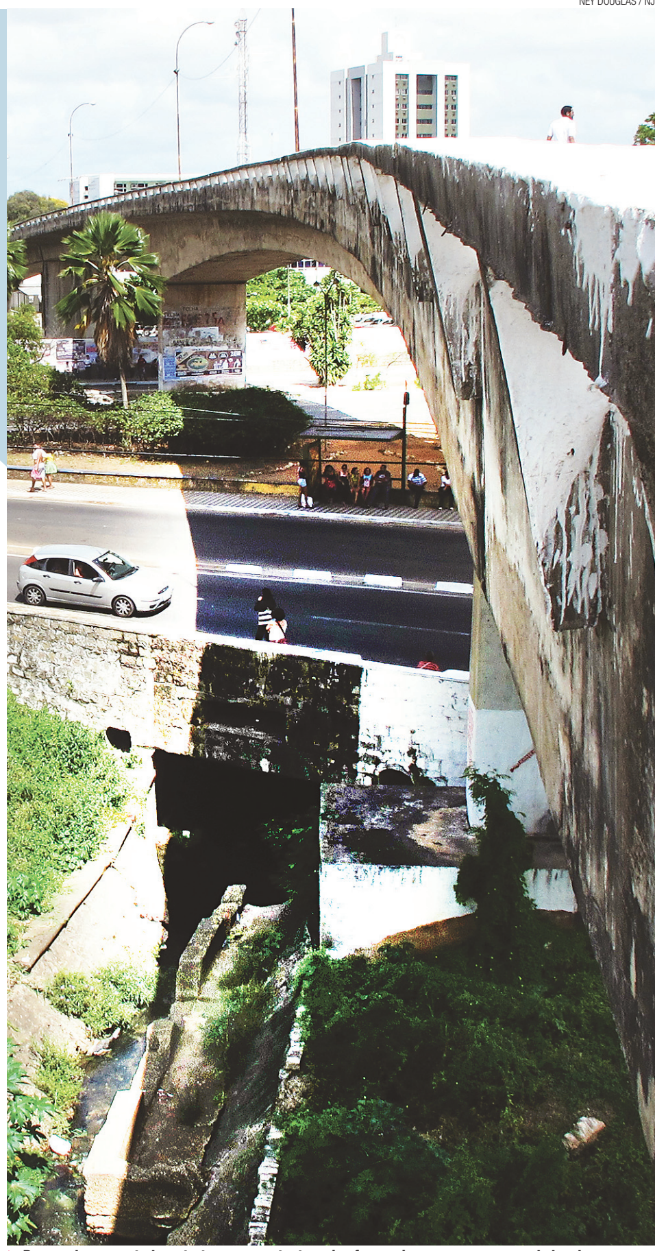
De acordo com estudo, estrutura que sustenta a via oferece risco a quem passa pelo local