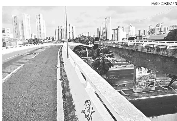
► Rachadura na cabeceira do Viaduto do Baldo já tem 14 cm e estrutura vai precisar receber o reforço urgente de uma escora