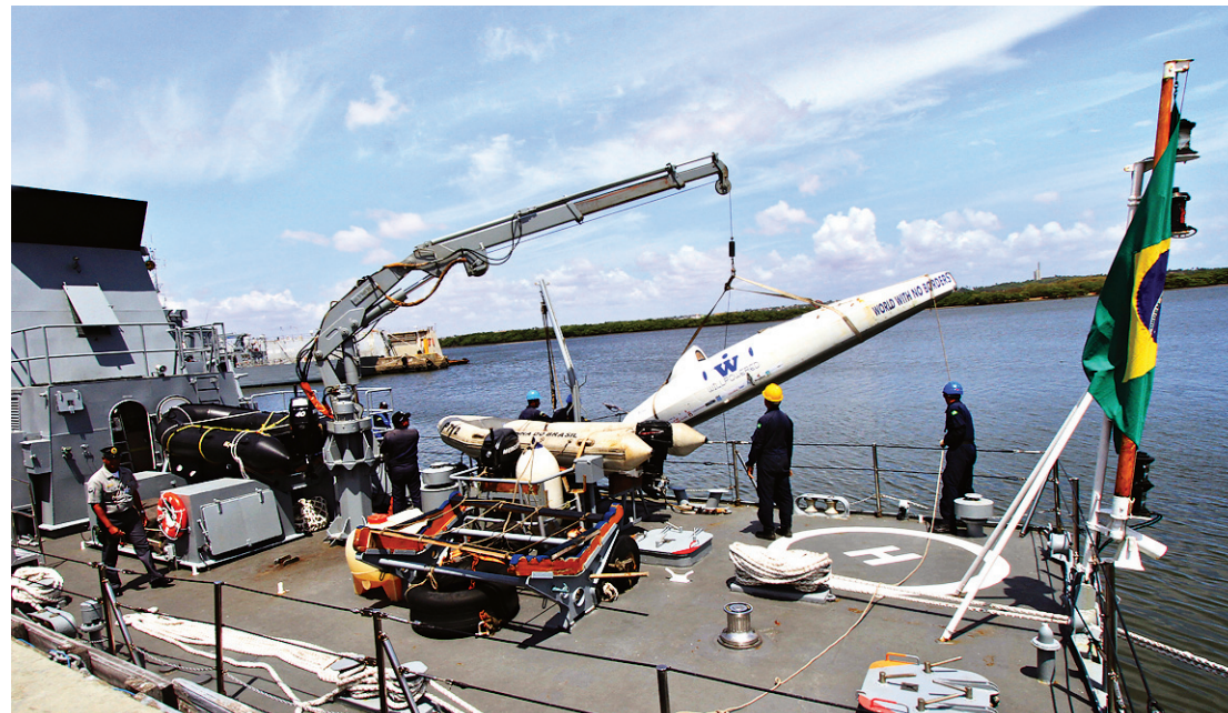
▶ Embarcação "Melanie" sofreu avarias, mas navegador quer utilizar equipamento para seguir viagem

A chegada de Ebrahim Hemmatnia na base naval atraiu a atenção de muitos integrantes da Ma-