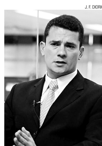
Sérgio Moro, juiz federal

O doleiro Alberto Youssef, o ex-diretor da área internacional da Petrobras Nestor Cerveró, o ex-diretor de Abastecimento da estatal Paulo Roberto Costa e o empresário Fernando Soares, conhecido como Fernando Baiano, também são réus nas ações penais da sétima fase da Lava Jato.