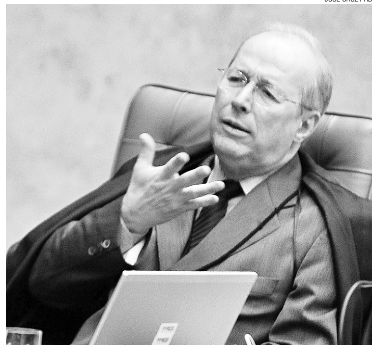
Ministro Celso de Mello: aposentadoria compulsória aos 70 anos

Até o momento, o plenário do Supremo está dividido em relação à validade do benefício, chamado de desaposentação. O ministro Luís Roberto Barroso, relator das ações principais sobre o assunto, admitiu a desaposentação e estabeleceu critérios para a Previdência Social recalcular o novo benefício. Marco Aurélio não reconhece o termo desaposentação, mas entendeu que o recálculo pode ser feito. Os ministros Dias Toffoli e