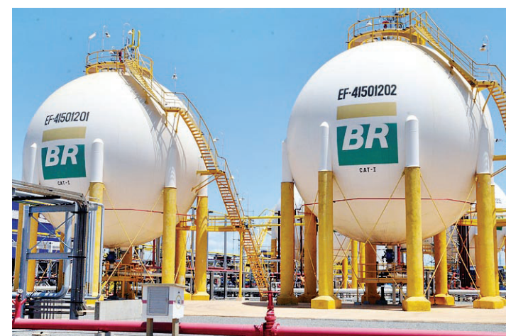
▶ Volume superou em 45 mil barris de petróleo por dia o recorde de 2013

Por isso, após identificada a suposta cobrança abusiva, o posto terá como se justificar, informando ao órgão fiscalizador os motivos de os valores não baterem. Sendo constatada a irregularidade, segundo Kleber Fernandes, o Procon tem poder de aplicar sanções ao estabelecimento.