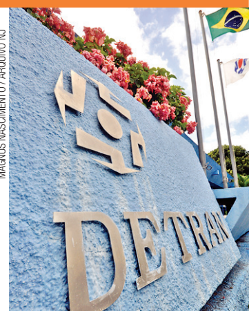
▶ Diretoria do Detran adota medidas para garantir eficiência da frota