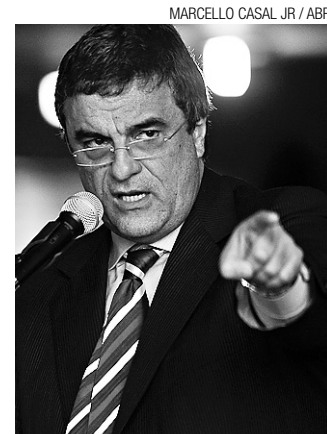
José Eduardo Cardozo