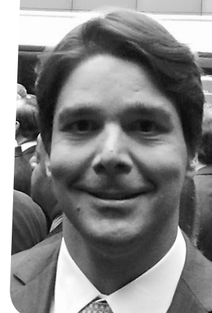
Felipe Maia toma posse para seu terceiro mandato na Câmara dos Deputados