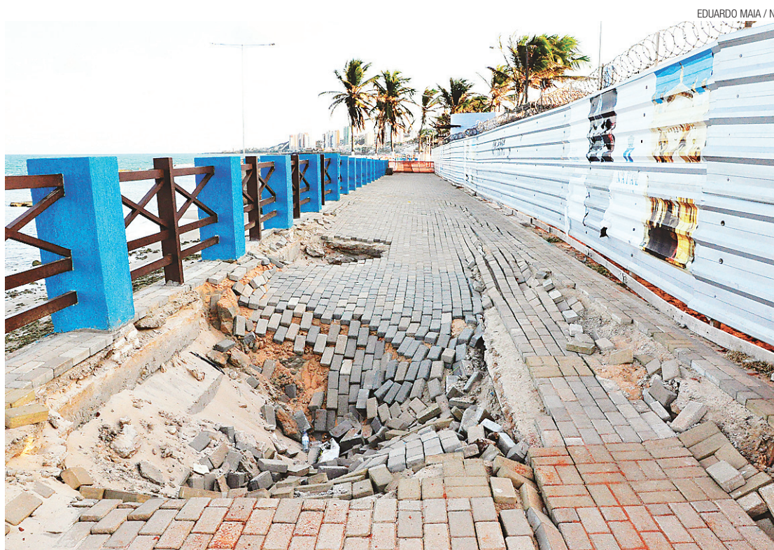
▶ Antes mesmo da conclusão da reforma da orla urbana, vários trechos do calçadão afundaram

Quando o diagnóstico não é feito, a Prefeitura está realizando obras paliativas para entregar a nova orla urbana como prometida, sem buracos e desníveis. Um contrato de R$ 212 mil está em vigência com a Tecompav, que deverá, num prazo máximo de 90 dias, realizar os reparos nas áreas já danificadas. "As obras de urbanização vão ser concluídas, restando