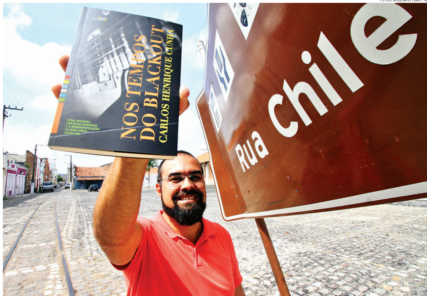
► “Nos Tempos do Blackout” será lançado amanhã no El Rock Bar, a partir das 19h30 pelo selo “Bons Costumes”, da editora Jovens Escribas

“Se você avisasse a sua mãe que iria para a Ribeira, ela era a primeira a gritar ‘Pelo amor de Deus! Vai fazer o quê ali?’”, brinca o professor que só começou a frequen-