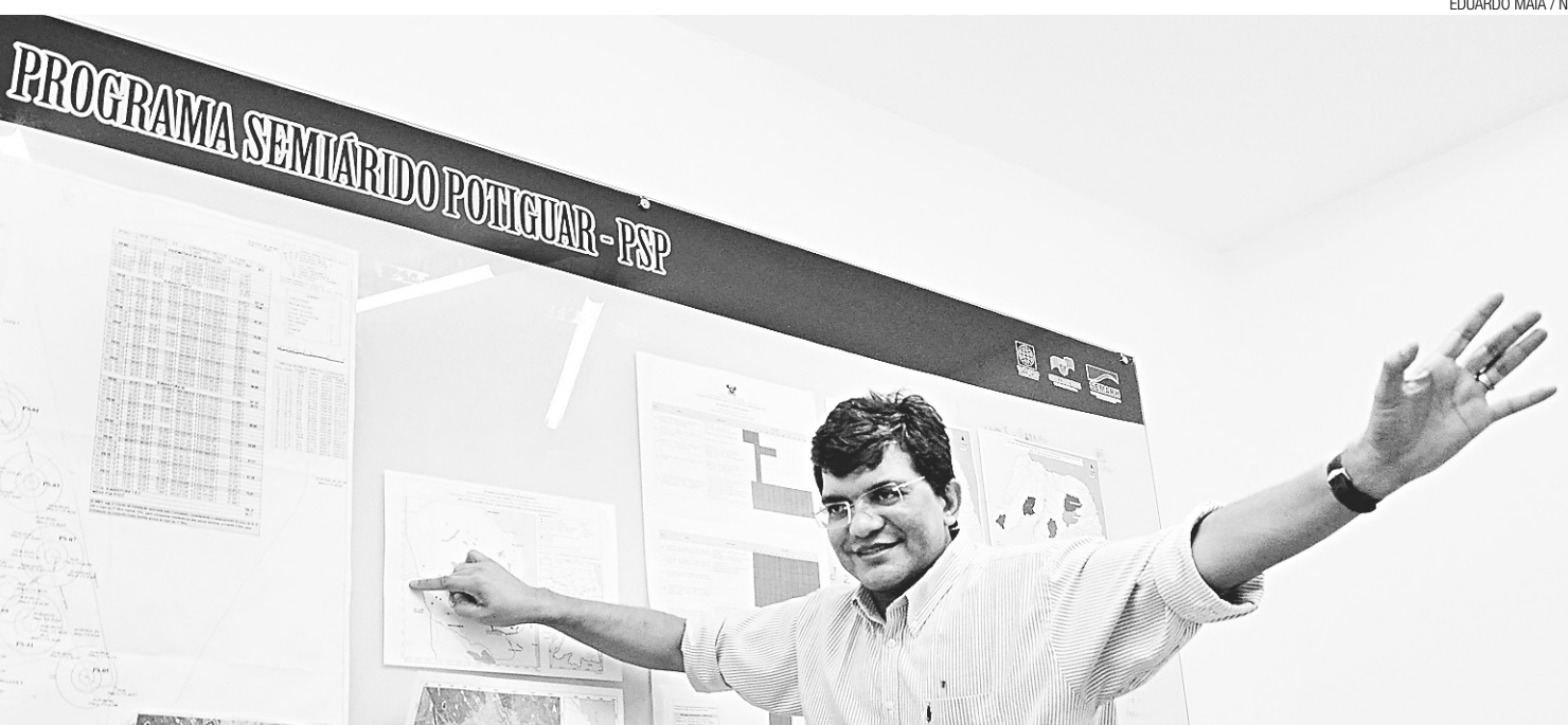
EDUARDO MAIA / NJ

/ SEMIÁRIDO / COMO NÃO UTILIZOU OS RECURSOS FINANCIADOS PELO BANCO MUNDIAL, ESTADO PERDEU PROJETOS DE MANUTENÇÃO E RECUPERAÇÃO DE 19 BARRAGENS