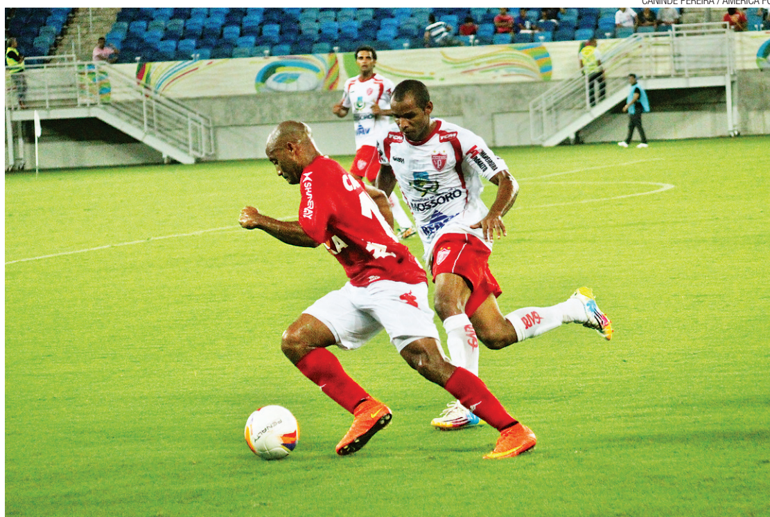
► O América começou o Estadual vencendo o Potiguar de Mossoró pelo placar de 2 x 0

Com o resultado de 2 a 0 sobre o Potiguar de Mossoró, na Arena das Dunas, o América é o vice-líder. E o Globo, que venceu o Baraúnas por apenas 1 a 0 no Estádio Walter Bichão, em Macau, ficou na quarta posição.