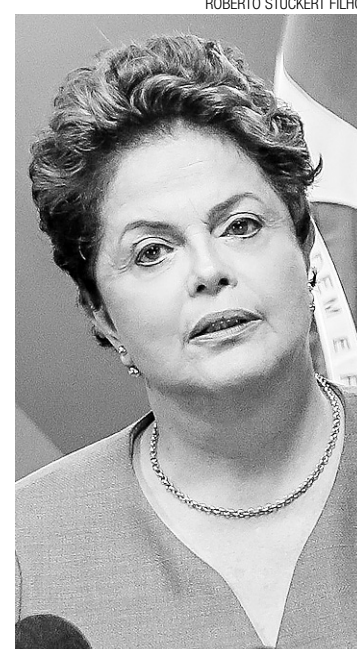
ROBERTO STUCKERT FILHO

A presidenta também destacou o incremento na capacidade de geração e transmissão de energia e a inclusão de fontes alternativas e limpas como a solar e a eólica. "Isso mostra que estamos fazendo os investimentos necessários para assegurar a oferta de energia em níveis necessários para o crescimento do país", ressaltou. Dilma voltou a garantir a disposição do governo em ajudar o governo de São Paulo em obras para garantir o abastecimento de água