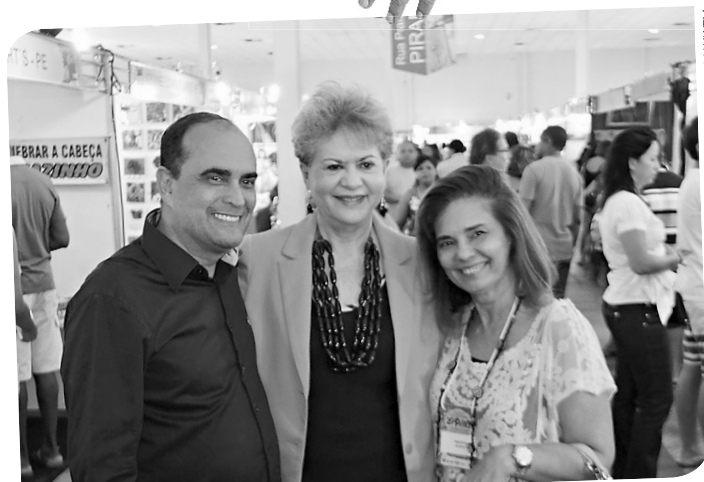
A vice-prefeita Wilma de Faria em visita à FIART