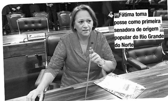
Fátima toma posse como primeira senadora de origem popular do Rio Grande do Norte