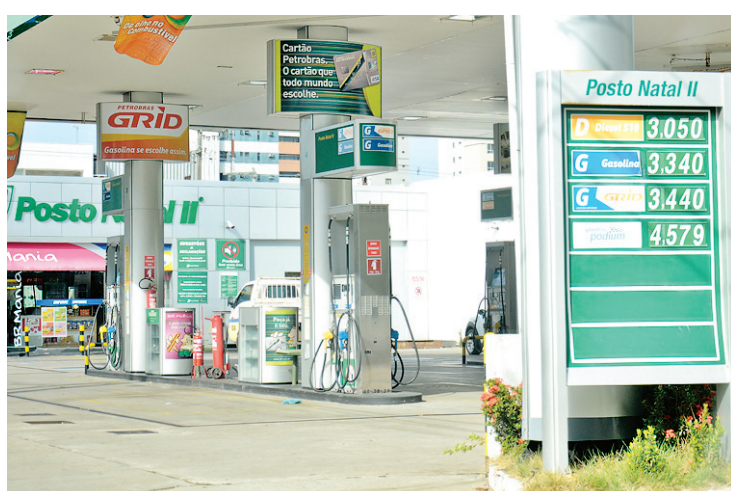
▶ Vários postos de combustíveis estão vendendo gasolina com um a R$ 3,34

O diretor do órgão de defesa do consumidor da capital explica que não há como os valores estarem todos iguais, porém é proibida a cobrança abusiva