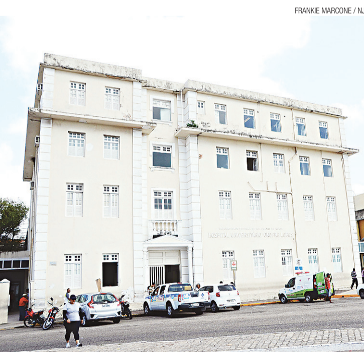
▶ Hospital Universitário Onofre Lopes: transplantes de córneas e de rins