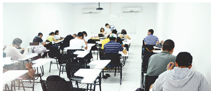
► Alunos estão assistindo aula no Complexo Cultural da Zona Norte

Fora esse valor já foram gastos mais R$ 4 milhões com a execução até o andamento atual. Isso resulta uma quantia de R$ 10,2 milhões que serão consumidos ao final. O projeto original para a execução prevê a construção de salas para alunos e professores, laboratórios, estacionamento, restaurante universitário e salas para os setores administrativos.