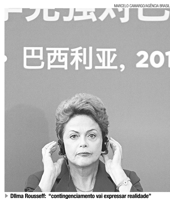
► Dilma Rousseff: "contingenciamento vai expressar realidade"

"Podem ter certeza que nem excessivo, porque não tem porquê; nem flexível demais, nem frágil demais, que não seja aquele necessário para garantir que as contas públicas entrem nos eixos", disse. O governo ainda negocia a votação de medidas do ajuste fiscal na Câmara dos Deputados para definir a dimensão dos cortes no Orçamento, entre elas o projeto de lei que trata da desoneração da folha de pagamento das empresas, e a Medida Provisória 668, que aumenta as alíquotas de PIS e Cofins sobre importação.