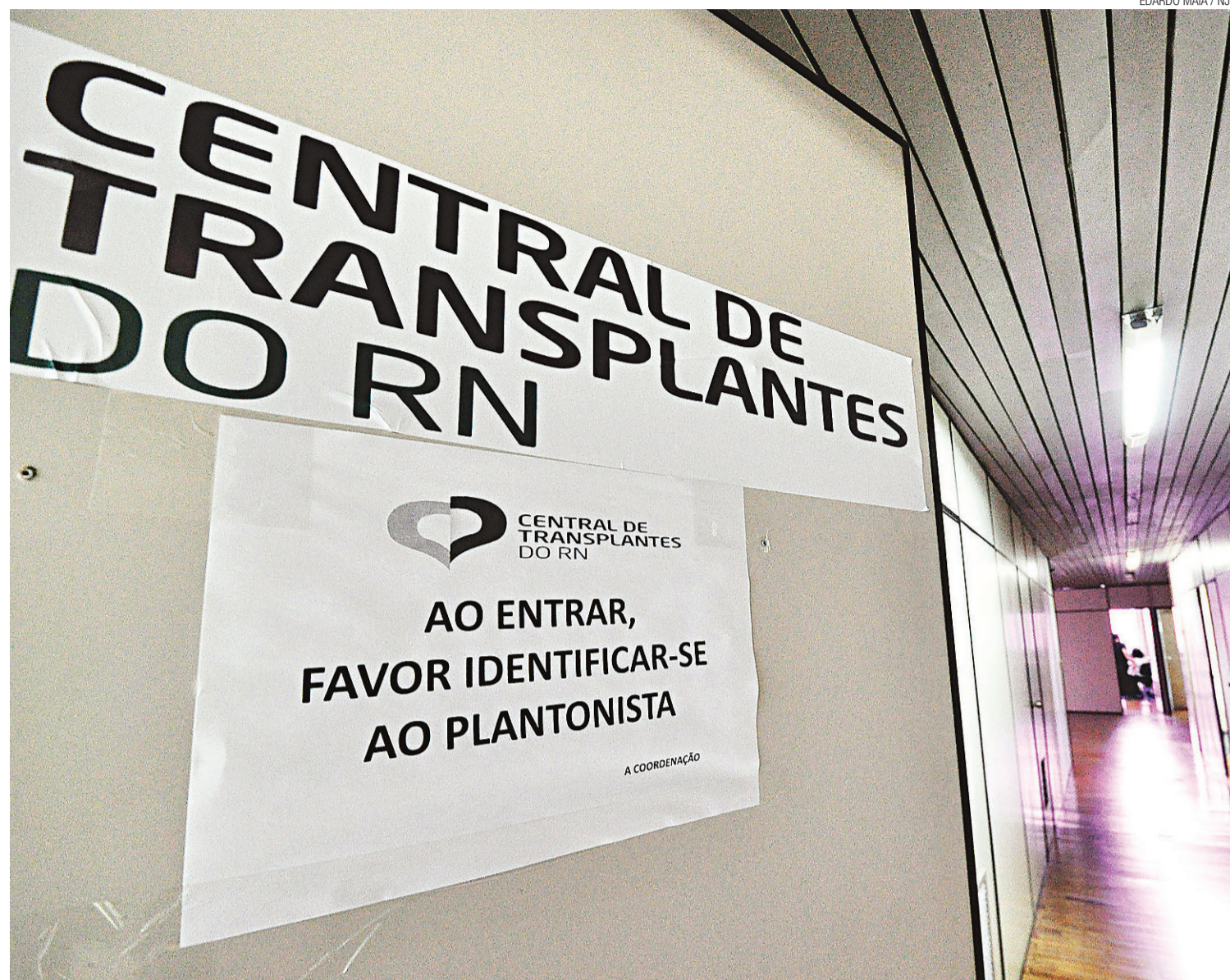
▶ Central de Transplantes do Rio Grande do Norte, localizada na Secretaria de Estado de Saúde Pública: queda de doações acompanha tendência nacional

A subcoordenadora conta que os servidores precisam ficar ligando para os hospitais ou mesmo se dirigirem até as unidades para saber desses registros. E muitas vezes as notificações deixam de ser feitas pela falta desse contato. "Essas notificações podem ter caído no primeiro trimestre, mas vamos ainda fazer um estudo para saber o que provocou a queda das doações, já que a aceitação das famílias aumentou".