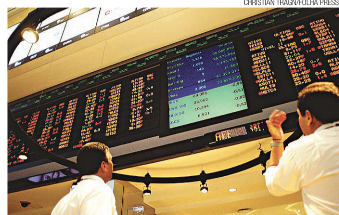
► Novas quedas do minério e gestão da Petrobras derrubam índice

tram-se os seguintes: vinhos e espumantes do Vale dos Vinhedos, região da Serra Gaúcha, no Rio Grande do Sul; a carne bovina de alta qualidade do Pampa Gaúcho da Campanha Meridional; e o camarão de Costa Negra, tipo de camarão criado em cativeiro, no Ceará, em fazendas do Baixo Acaraú, no litoral oeste do estado.