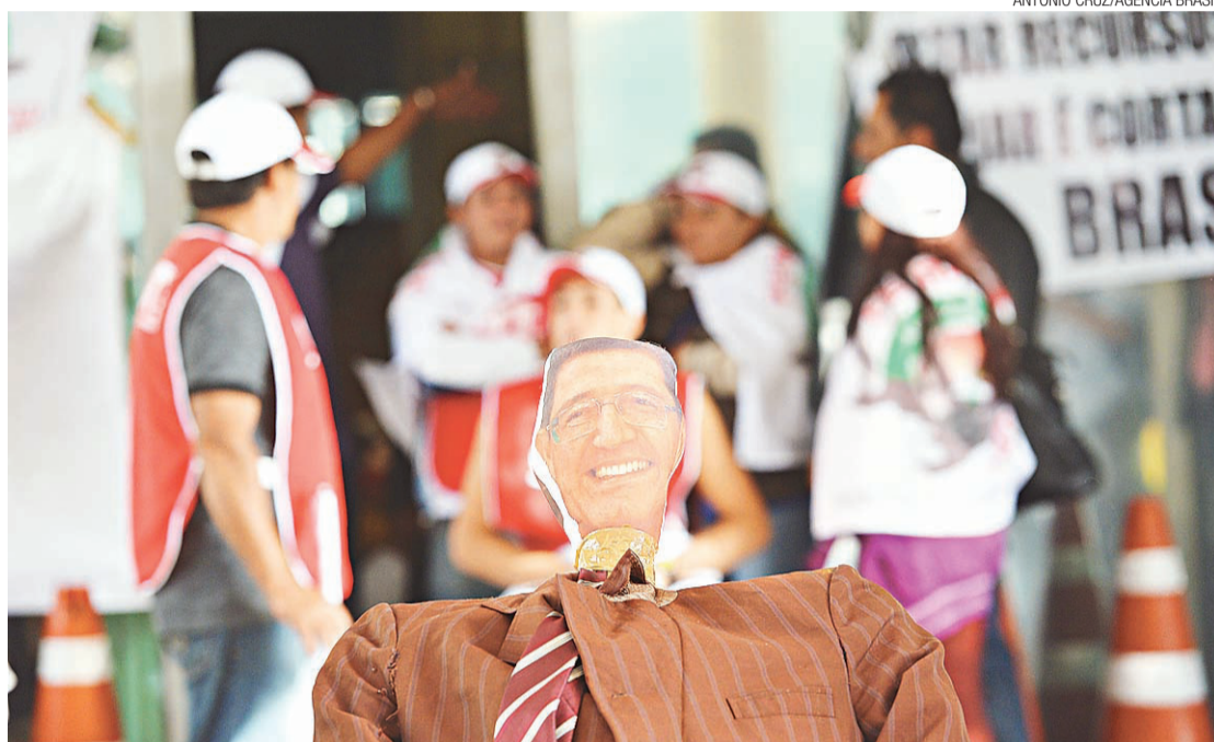
► Integrantes da CUT e Fetraf fizeram uma versão de "Judas" do ministro da Fazenda, Joaquim Levy

"Vim aqui trazer a mensagem que o governo brasileiro tem canais institucionais para responder às reivindicações. Então, temos que ajudar esses canais institucionais. Há disposição para conversar, particularmente no