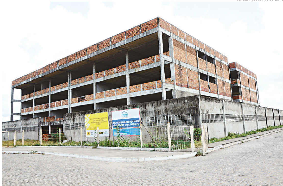
► A obra foi iniciada no segundo mandato do governo de Wilma de Faria e depende de liberação de financiamento do BB

Já a partir de 2011, no governo de Rosalba, decorreu a aprovação do empréstimo do Proinvest. “Quando o investimento foi aprovado pela Assembleia Legislativa, em dezembro de 2013, os recursos eram para chegar em 2014, quan-