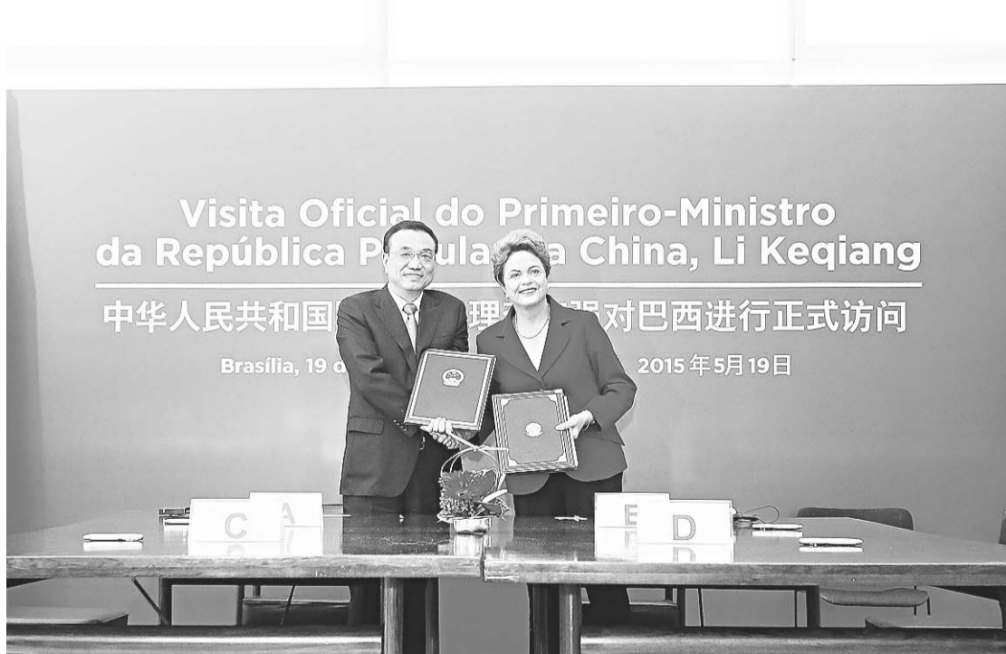
► Primeiro-ministro chinês, Li Keqiang, disse que China e Brasil "têm a tarefa de construção econômica"

De acordo com a presidenta, a implementação do plano de ação conjunta contará com o suporte do acordo de cooperação entre a Caixa Econômica