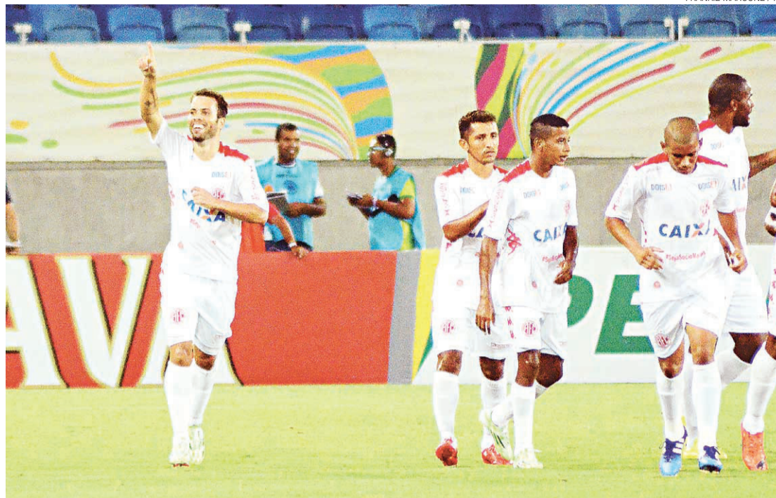
▶ Alvirrubro abriu vantagem no jogo da Arena das Dunas e tem situação confortável hoje, no Serra Dourada

Uma classificação para a terceira fase da Copa do Brasil neste momento, por isso, viria em boa hora, já que, caso avance, a CBF pagará R$ 560 mil ao clube rubro. Somados os valores recebidos nas duas primeiras fases (R$ 200 mil e R$ 240 mil), a Copa do Brasil pode render nada menos que R$ 1 milhão ao clube neste primei-