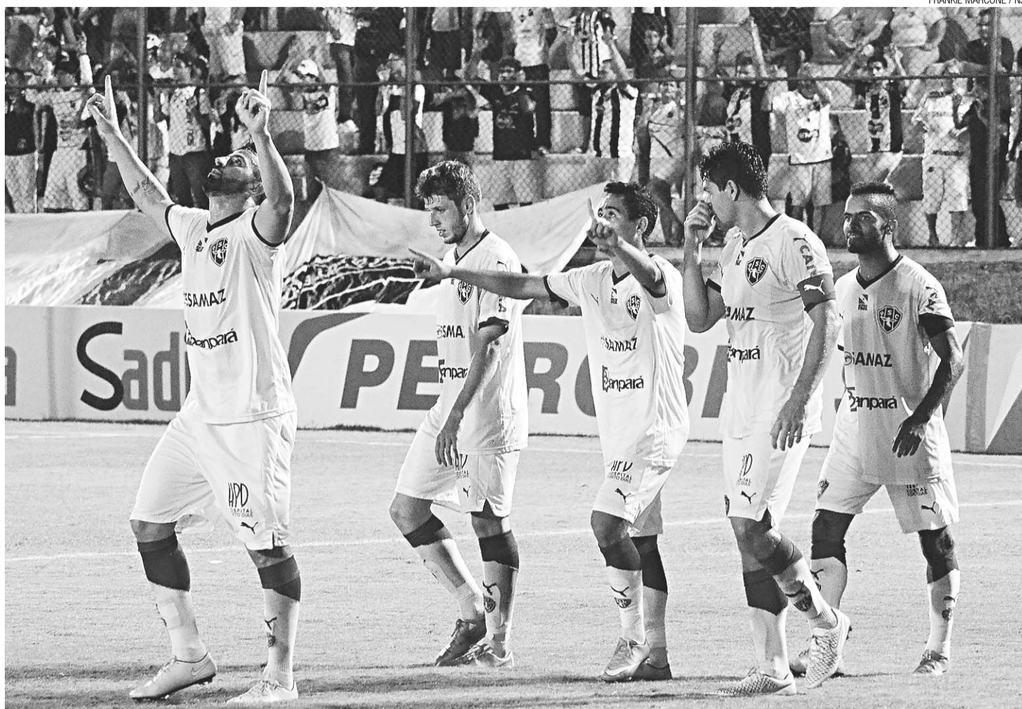
► Paysandu comemora a vitória e agora espera o resultado do jogo entre Luverdense e Bahia