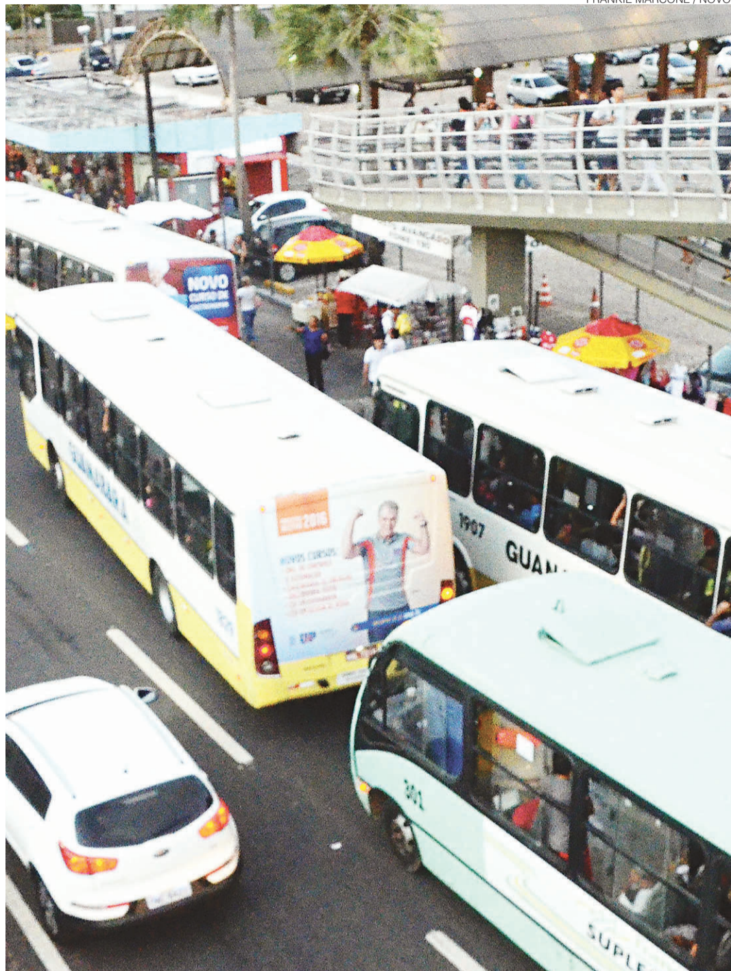
// Prefeitura de Natal espera implantar licitação sem as emendas aprovadas pelos vereadores

"O que a Prefeitura deseja é fazer o processo licitatório sem as exigências de algumas emendas que causariam o aumento da passagem. O que estamos pedindo, com essa questão da inconstitucionalidade, é a suspensão da eficácia dessas emendas até que elas sejam julgadas", disse Castim. O procurador, entretanto, não explicou quais argumentos foram apresentados. Por telefone, disse que estava em reunião e não teria tempo para tanto.