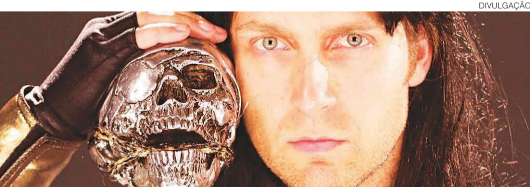
// Ator e humorista Bruno Sutter traz o personagem que nasceu de uma paródia às bandas de rock pesado

Para os que preferem curtir apenas os torneios gamers, a programação de hoje inclui “Ultra Street Fighter IV”, “Mario Kart 8”, “Mortal Kombat X”, na área Gamer, torneio de “Just Dance 2016”, na área voltada para o jogo, além de semi-final de “CS: GO” e “League Of Legends”.