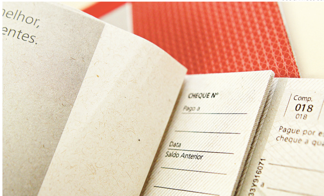
// Juros do cheque especial perdem apenas para o rotativo do cartão de crédito

Já para o crédito pessoal, a taxa total avançou de 49,8% em setembro para 52,9% em