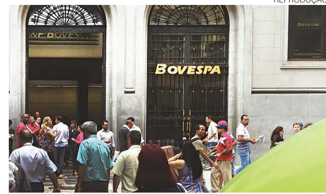
// Lava Jato e rombo no orçamento pesaram no índice

O BC informou também que a taxa de captação dos bancos no crédito livre caiu de 14,7% ao ano de setembro para 14,6% em outubro.