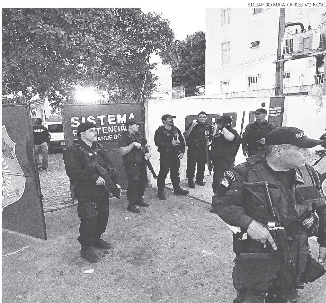
// CDP da Ribeira foi destruído em março e deverá ser reconstruído a partir do ano que vem

Os servidores têm até a segunda-feira (30) para responder ao chamamento e infor-