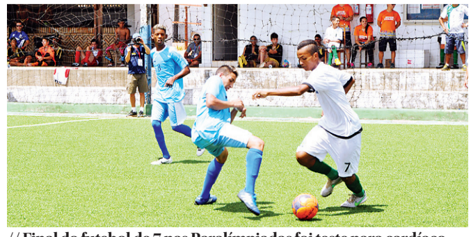
// Final do futebol de 7 nas Paralimpíadas foi teste para cardíaco

Hoje, junto com edição impressa do NOVO, tablôide PARNAMIRIM