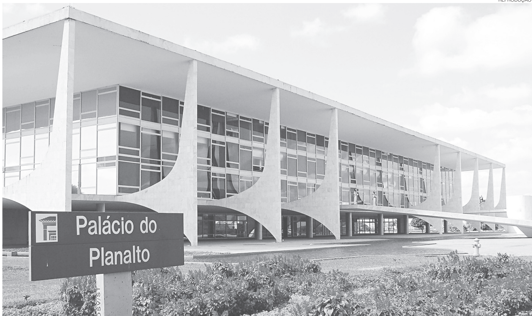
// Governo federal não vai liberar pagamento de serviços como telefone, água, luz, passagens e diárias enquanto meta fiscal não for aprovada

O Planalto fez questão de justificar que o novo contingenciamento foi necessário