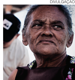
// Projeto mostra mulheres agentes da economia