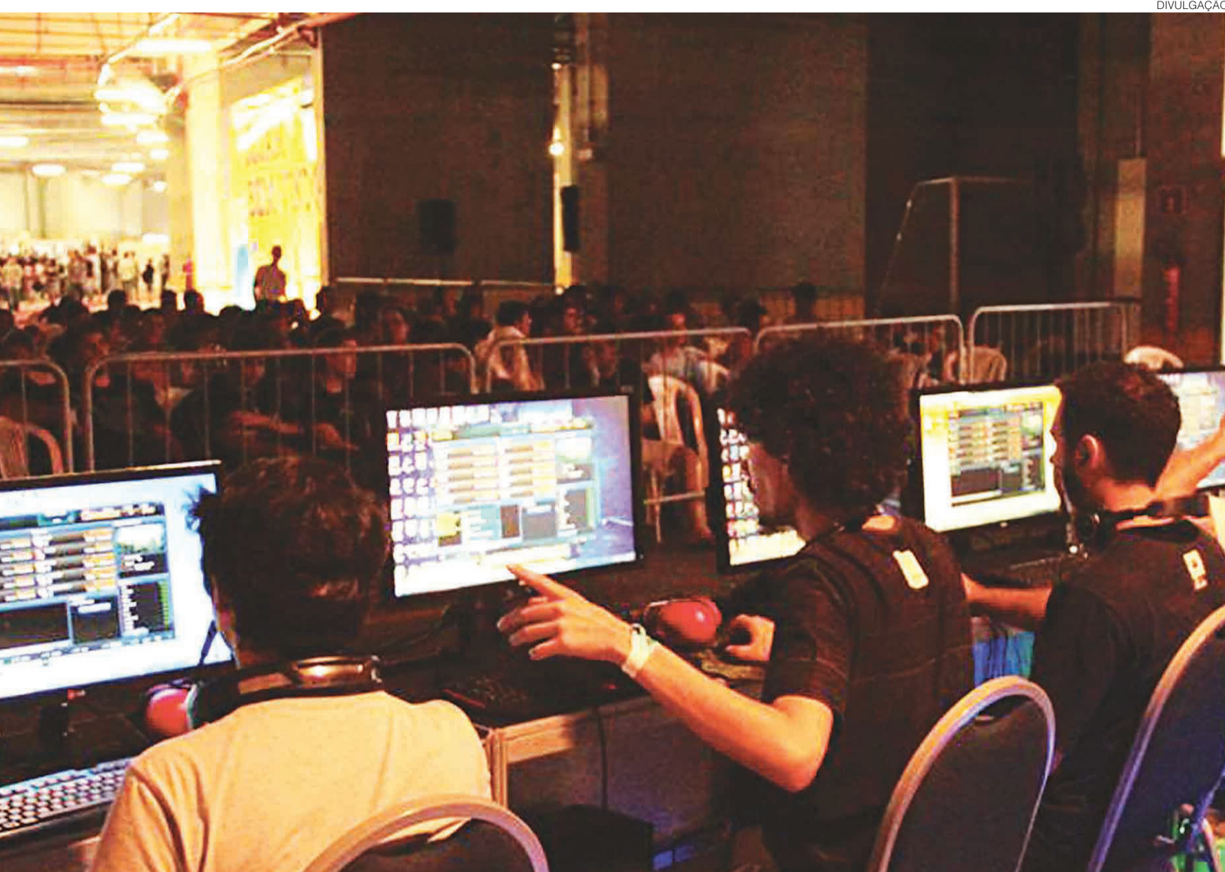
// Games terão grande destaque na feira deste ano; haverá torneios "Ultra Street Fighter IV" e "Mario Kart 8", além de campeonatos de "CS: GO" e "League Of Legends".