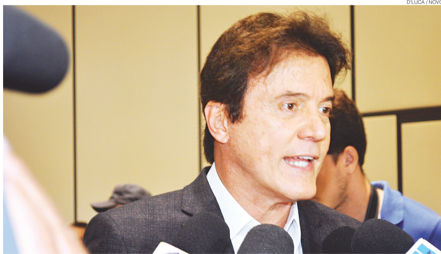
// Emergência e intenção de usar as forças armadas nessa batalha foi anunciada pelo governador em entrevista coletiva