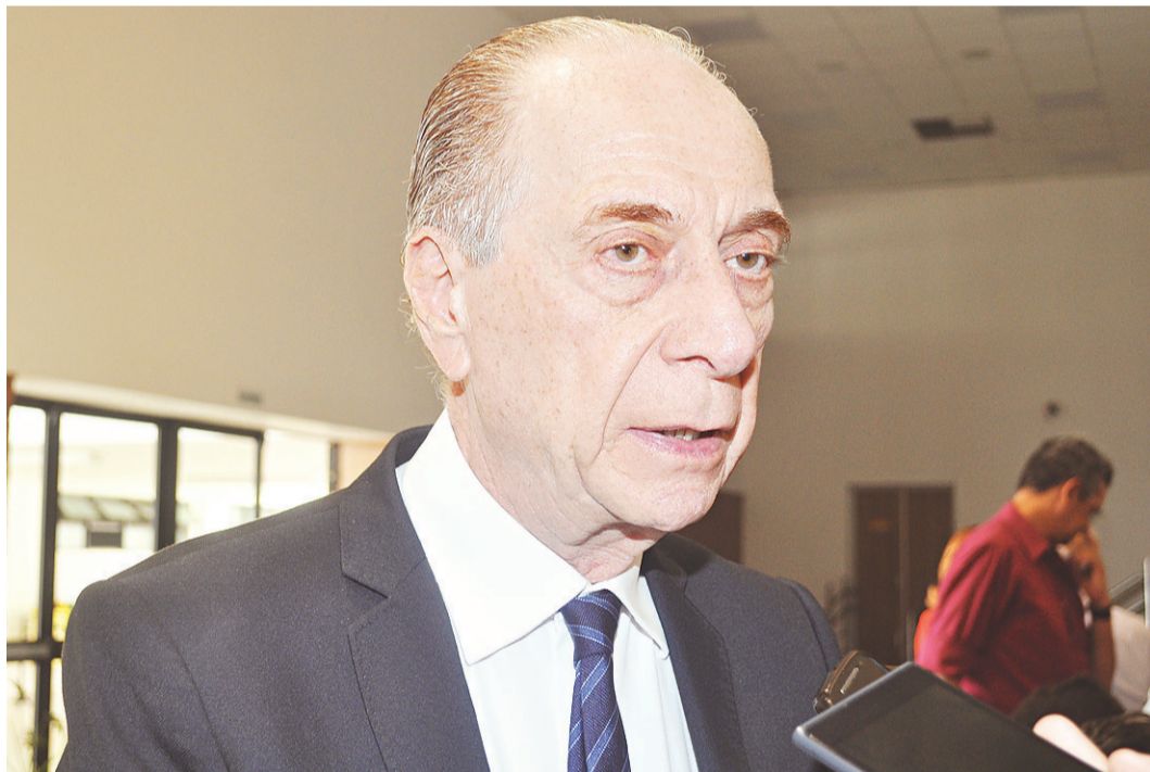
// Ricardo Lagreca, secretário estadual de Saúde: apoio da população para erradicar o mosquito