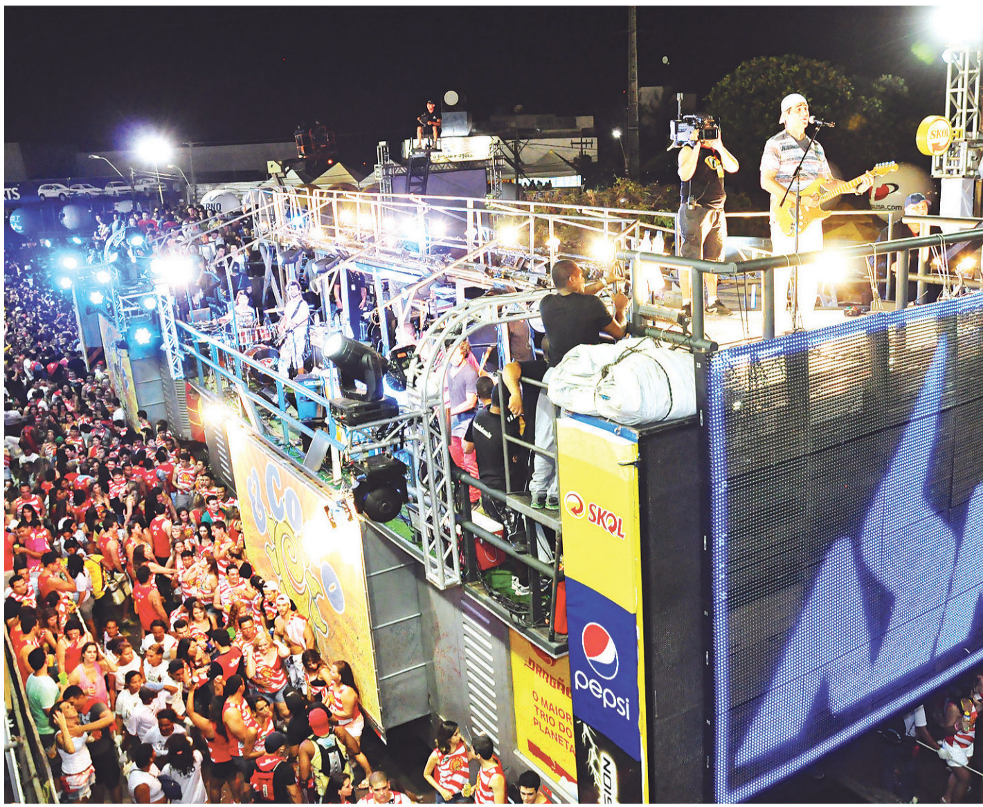
//Primeiro dia terá o encontro entre o bloco Vumbora!, de Bell Marques, e a banda Oito7Nove4, dos filhos do ex-Chiclete com Banana.

Na edição passada foram 350 metros de corredor e o camarote temático ficou localizado na parte externa da Arena das Dunas, o que gerou reclamações dos foliões pela distância do pico da festa. Com capacidade para uma média de 2,5 mil pessoas este ano eles trabalharão as quatro estações do ano como