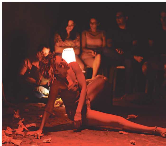
//Espetáculo “Manga Rosa” integra atual temporada da A.B.O.C.A