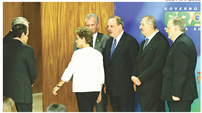
Presidente Dilma passa por ministros após seu pronunciamento

Ela rechaçou a possibilidade levantada pela im-