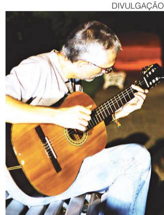
// Projeto vai selecionar novos talentos da música potiguar

“Está sendo uma boa experiência, e se der certo deste jeito, vamos continuar as atividades por editais. É uma forma de aproximar o público dessas escolhas sobre o que vamos postar, porque muito embora a gente pesquise constantemente é claro que com a ajuda do público esse garimpo se torna muito mais amplo”, comenta, frisando que um