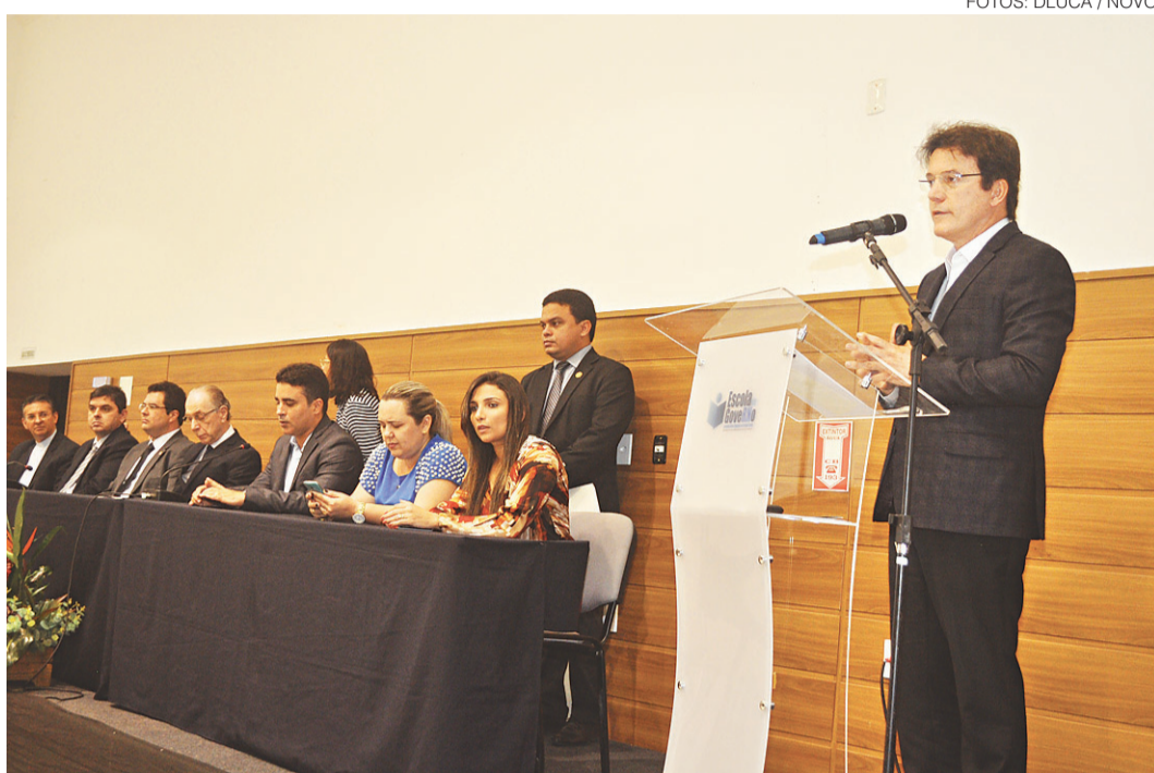
// Robinson Faria, governador: defesa da criação de um fundo para apoio e obtenção de recursos

“Temos cerca de quatro mil militares em Natal, espalhados em quatro batalhões e um comando de brigada, que podem se somar aos agentes de endemias no combate aos focos”, declarou o chefe do Executivo em uma reunião extraordinária, realizada na manhã desta quarta-feira, onde foram discutidas soluções para frear o avanço da zika e, consequentemente, da microcefalia.