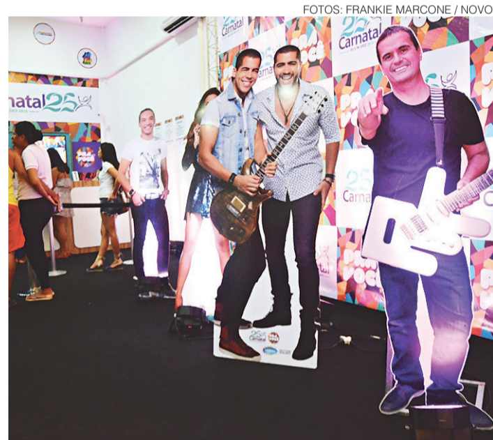
//Os quatro dias de folia terão desde axé até o forró de Wesley Safadão