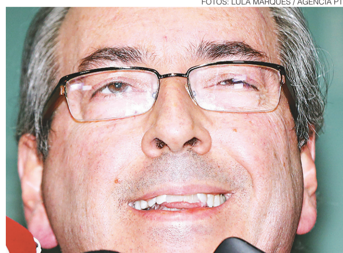
// Cunha: "Não tenho nenhuma felicidade de praticar esse ato"