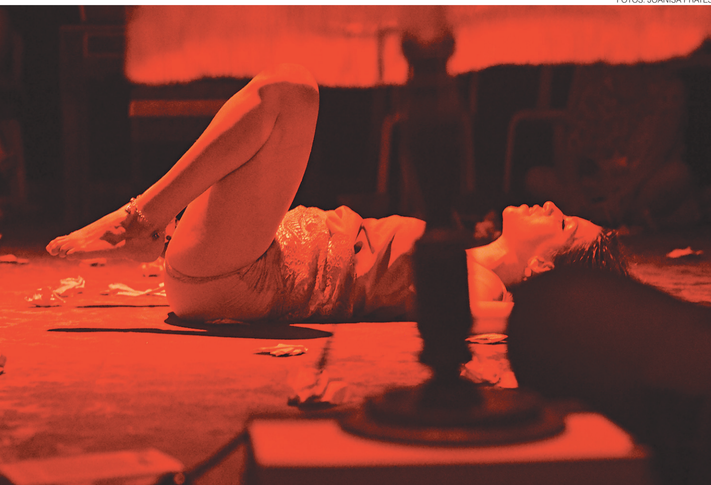
// A encenação de 50 minutos é costurada com as experiências pessoais de Luana Menezes e com os diários picantes da libertária Anaís Nin