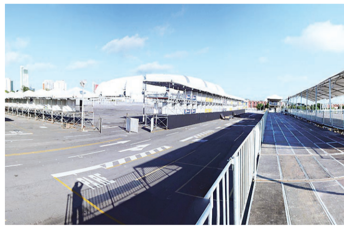
//Corredor da folia está pronto para os quatro dias da micareta

A entrega dos uniformes ainda está sendo feita no Centro de Convenções de Natal. Para quem quer participar da festa, mas prefere