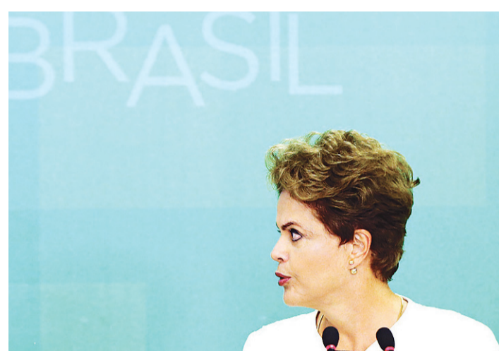
// Dilma: "Não existe nenhum ato ilícito praticado por mim"