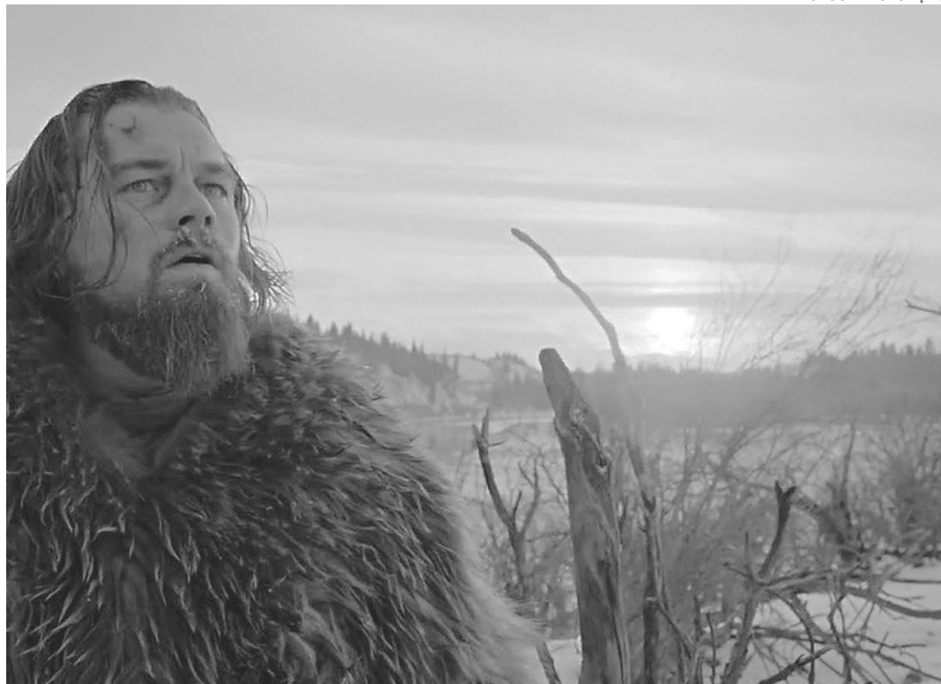
// Banca de apostas: "O Regresso" é o grande favorito para levar a estatueta de melhor filme

"Ele não é o melhor e é bem complicado pelos excessivos termos financeiros, mas é o mais qualificado em diversos