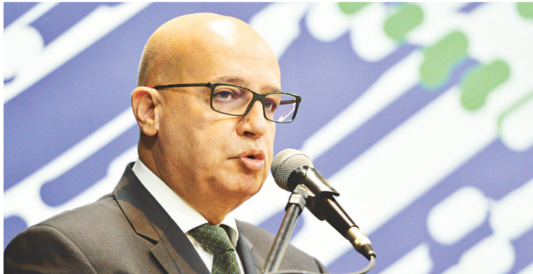
// Ministro do Planejamento Valdir Simão: despesa de pessoal estável nos últimos anos relação ao PIB

Mas, na área econômica do governo, há quem defenda uma revisão desses planos salariais, apesar do risco de desgaste político com os sindicatos. Fontes admitem que, se o resultado fiscal piorar, o governo terá de encarar