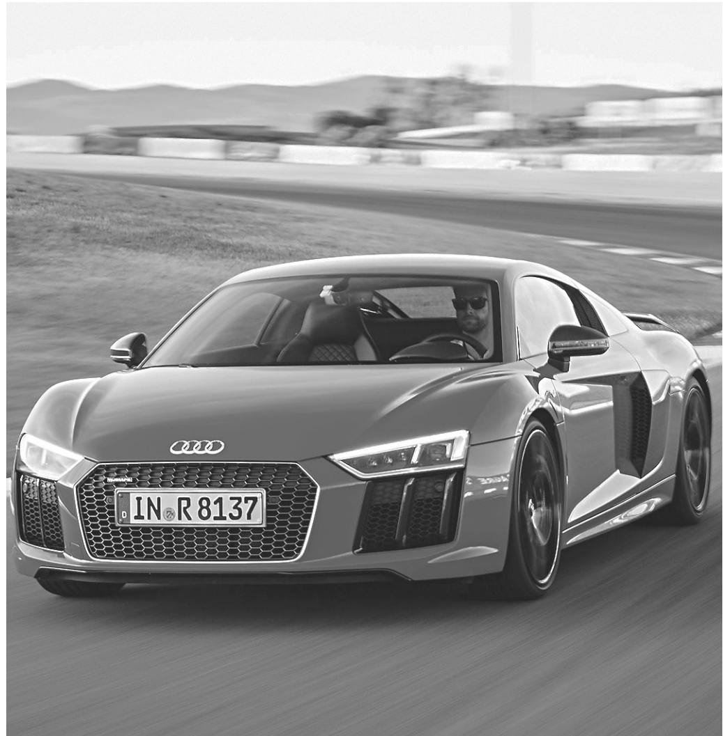
// Um dos carros mais caros do mundo, Audi R8 é oferecido como prêmio aos grandes investidores

O primeiro desses centros a ser inaugurado, em março, será o de Cuiabá. De acordo com a assessoria de comunicação do grupo, a finalidade dos centros de distribuição é acompanhar o desenvolvimento de cada franquia, auxiliar na expansão do negócio e dar treinamento aos franqueados.