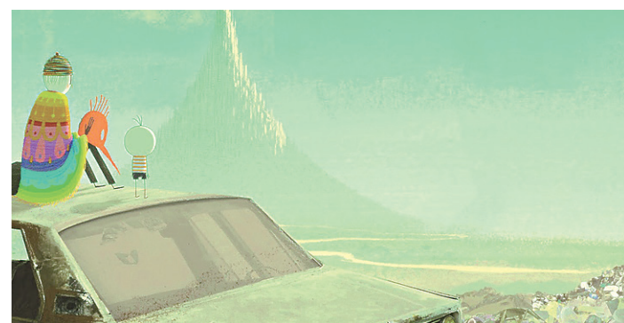
// Animação brasileira "O Menino e o Mundo"

faz a diferença. "O belo "O Menino e O Mundo" conta com uma trilha-sonora de cair o queixo e uma estupenda edição de som", afirma. Para ele, o desenho levaria o prêmio, não fossem as produções dos grandes estúdios.