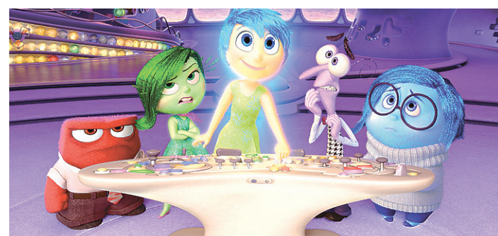
// "Divertida Mente", dos estúdios Pixar, é favorito à melhor animação