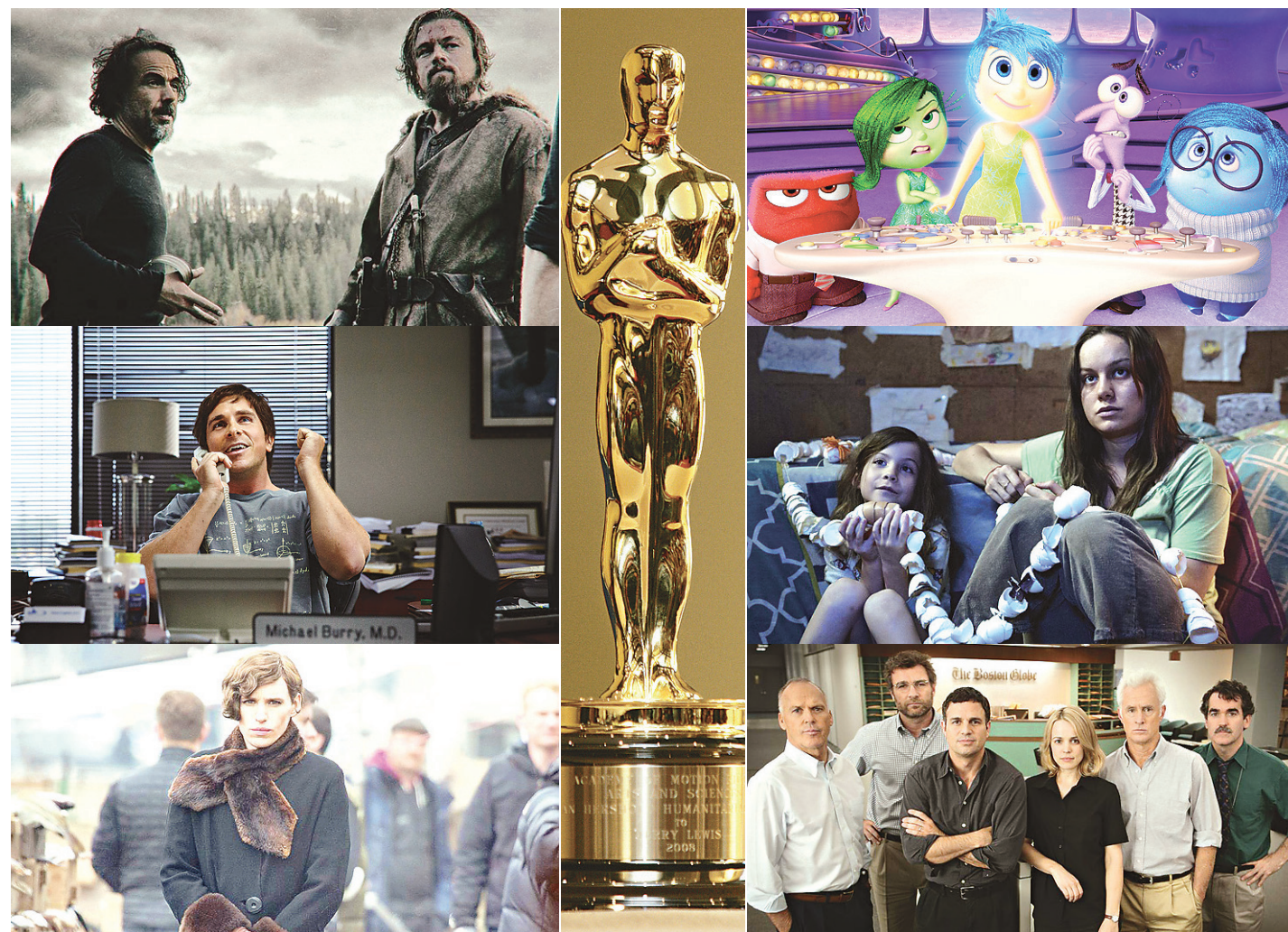
//NOVO ouve jornalistas e cinéfilos para formar o seu "bolão" do Oscar. Entre eles, Leonardo DiCaprio é favorito a melhor ator

A falsidade nasce na não existência da federação e se consolida na inutilidade do órgão protetor. #5