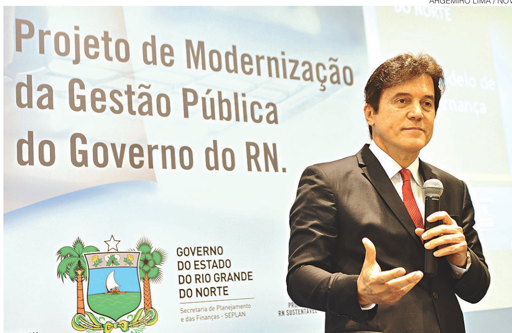
// Projeto de modernização da gestão foi lançado pelo governador Robinson Faria em agosto de 2015