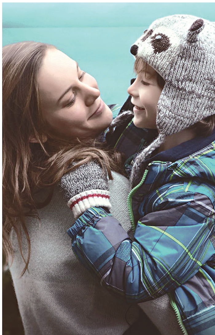
// Brie Larson, "O Quarto de Jack", concorre ao prêmio de melhor atriz

além da menor popularidade da atriz com relação a Lawrence [que concorre por sua atuação em "Joy"], chamam atenção para a sua atuação, que provavelmente sairá vitoriosa na noite", opina.