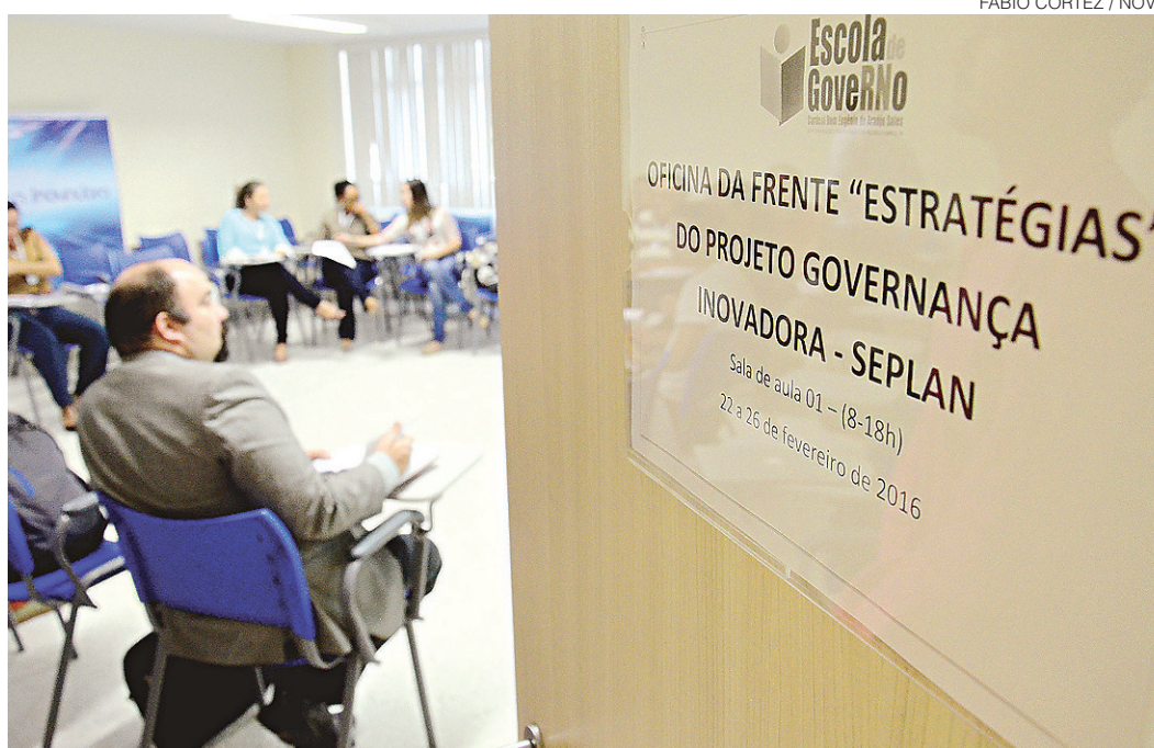
// Projeto compreende a formação de grupos de trabalho e estudo para capacitar servidores

Para isto é fundamental desdobrar os principais compromissos para cada unidade da estrutura administrativa pactuando resultados sob a forma de contratos de gestão. Por fim serão estabelecidos mecanismos de monitoramento e avaliação, sob o formato de uma sala de situação onde o governador e secretários irão acompanhar os avanços e corrigir eventuais desvios visando o aperfeiçoamento contínuo do projeto.