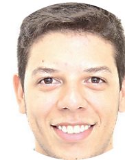
Norton Rafael Repórter

Final em jogo único é um brinde à emoção, que por vezes dá sinais que anda em litígio com o futebol. Mas, deixando o saudosismo de lado, essa modalidade também pode favorecer um lado. Ganha quem acorda melhor no dia. E creio que essa condição estará ao lado do Globo. Com foco apenas no Estadual e com a semana cheia de preparação, o time de Ceará-Mirim me parece melhor condicionado para vencer esses 90 minutos.