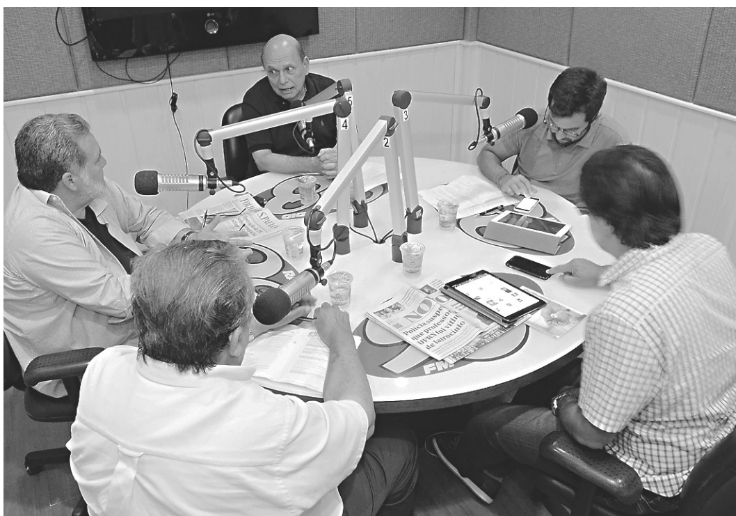
// Programa transmitirá notícias do portal do NOVO, além de destaques da edição impressa do dia seguinte

Para não perder nenhuma novidade entre a parceria entre o NOVO e a Rádio 98FM basta seguir nas redes sociais o perfil @novojournalrn, acompanhar a produção de conteúdo através do www.novojournal.jor.br e não desgrudar o ouvido da programação líder de audiência do rádio potiguar através da frequência 98,9 FM.