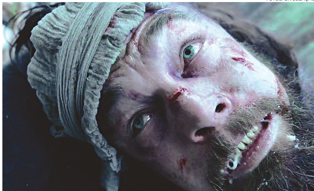
// Leonardo DiCaprio, de "O Regresso"; já venceu três prêmios em 2016, pela atuação como Hugh Glass