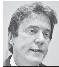
"A população tem pressa e o governador também; a sociedade quer eficiência".

A Defensoria Pública do Estado estuda mover uma ação civil pública por causa da demora no atendimento pelo SUS dos procedimentos urológicos. Somente de janeiro a abril desse ano foram ajuizadas pela Defensoria Pública, apenas em Natal, 119 ações individuais na área de Saúde, sendo que 28 delas são ligados a procedimentos