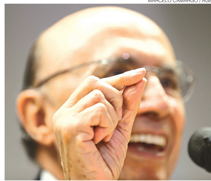
// Henrique Meirelles, ministro da Fazenda

Se os gastos sociais terão de ser importantes, a OIT aponta que o Brasil, por conta de um PIB significativo, não vive a mesma situação de outros países em desenvolvimento. Para erradicar sua pobreza, o Malawi precisaria o equivalente a 77% de seu PIB. Na média, os emergentes teriam de realizar gastos extras de 21% de seu PIB.