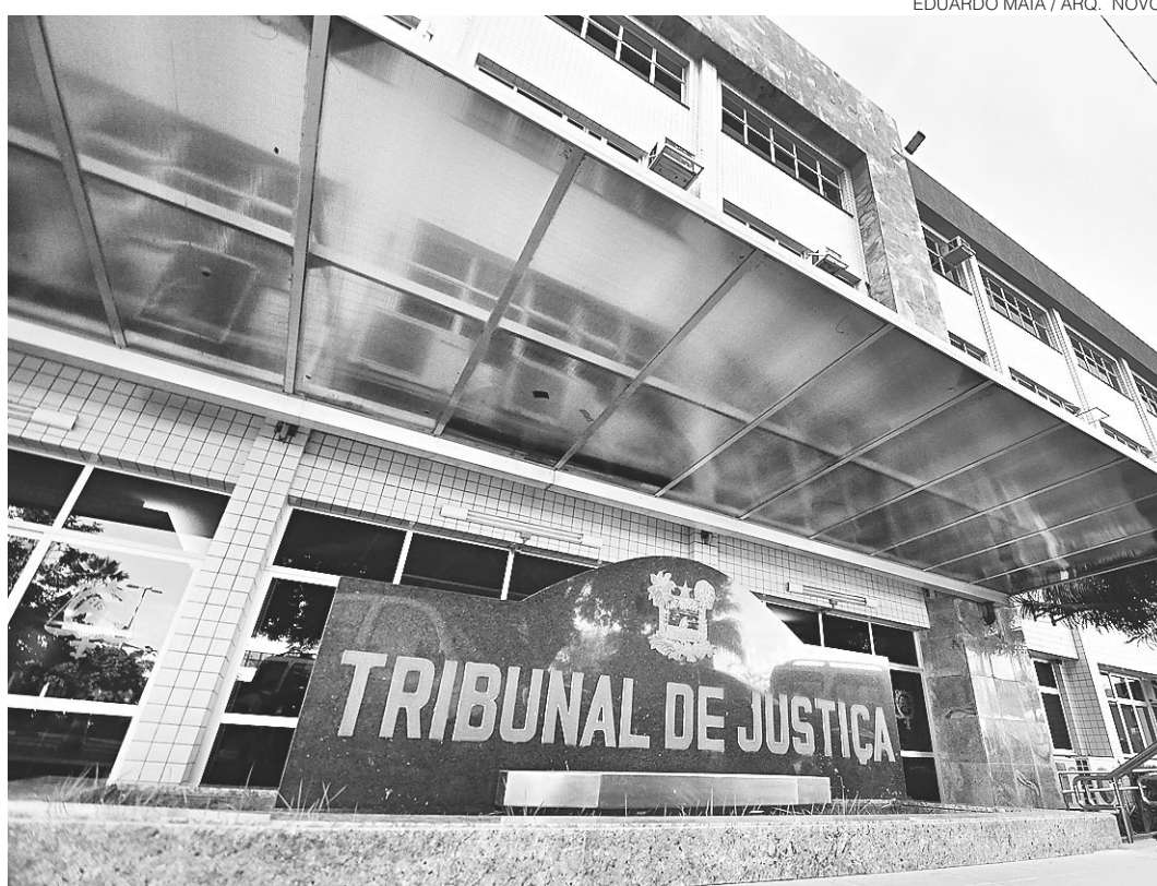
// Sede do TJRN deve sair da Cidade Alta para o bairro Nazaré, na Zona Oeste, num prazo de três anos