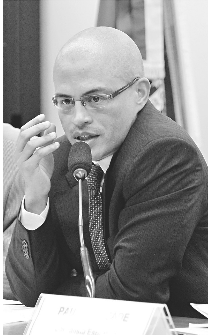
// Alex: "É preciso saber como ele (o código) será na prática"

O código prevê penas que vão desde o afastamento do cargo, passando por suspensão, podendo chegar ao banimento. A CBF planeja aprovar e implementar o código no segundo semestre deste ano, mas não descarta deixá-lo para 2017.