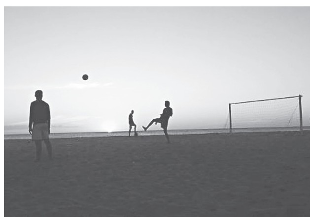
Caicara do Norte é um município da microrregião de Macau, no Rio Grande do Norte.