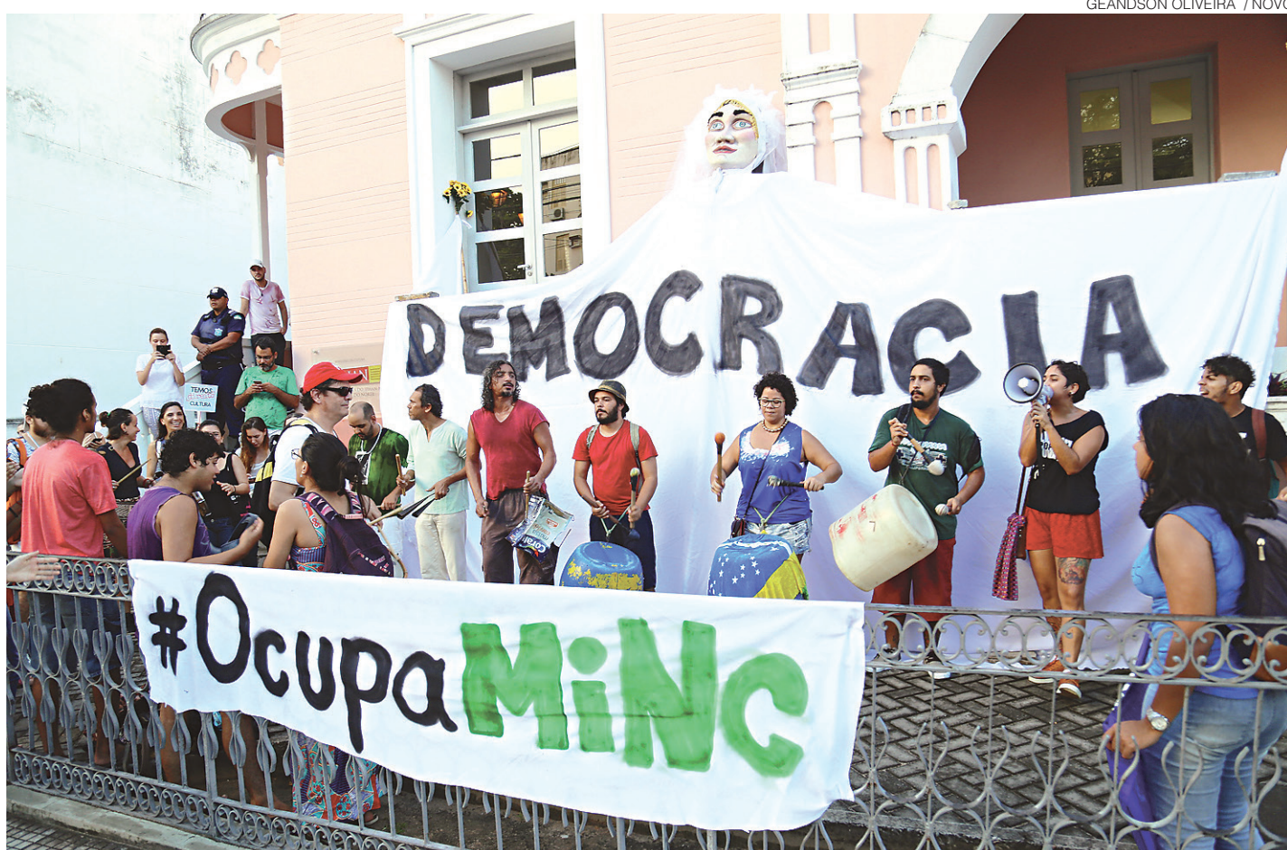
GEANDSON OLIVEIRA / NOVO

Onde? Parque das Dunas Que horas? 10h *Espetáculo gratuito | R$ 1 para entrar no Parque