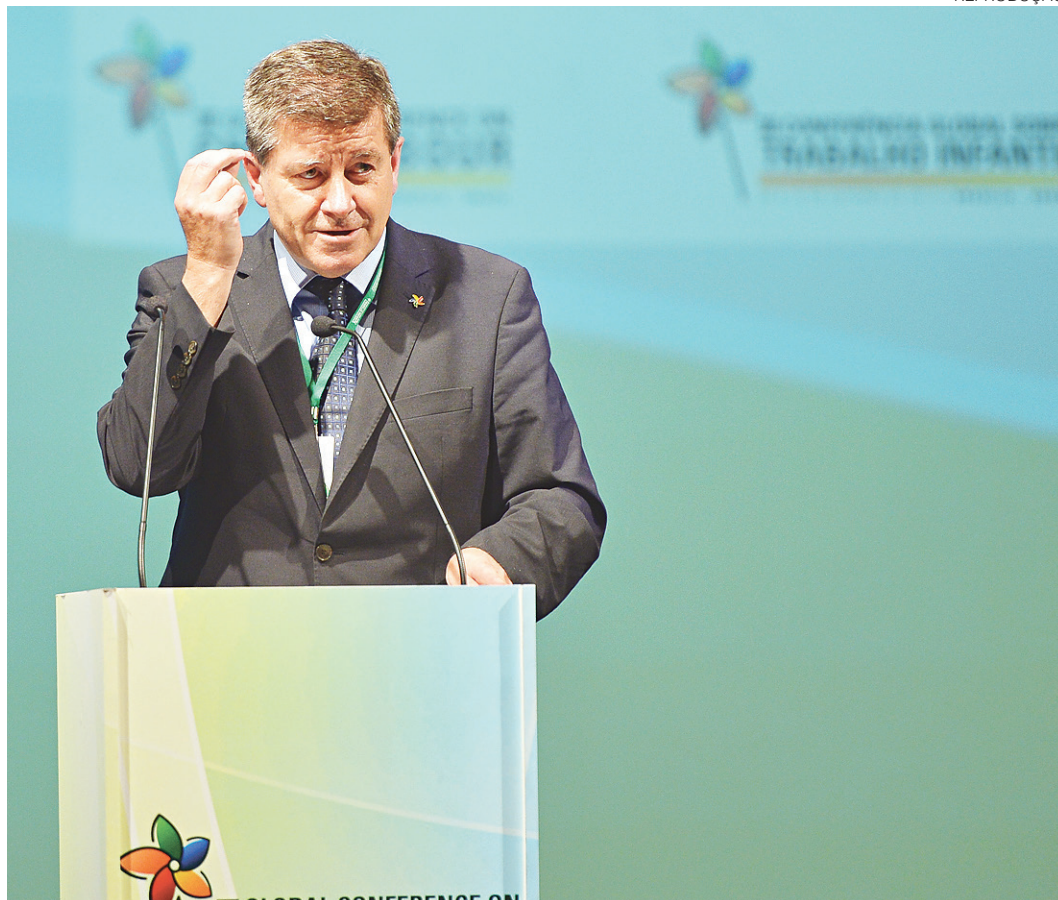
// Guy Ryder, diretor-geral da OIT: "Desemprego aumenta e a pobreza tende a se perpetuar"

teriria todos da pobreza com mais 0,3% do PIB por ano em gastos sociais. Isso garantiria que todos no País teriam uma renda acima de US$ 3,1 por dia, o nível que estabelece a fronteira da pobreza, segundo os organismos internacionais. O valor total seria o equivalente ao que o Tribunal de Contas da União estimou ter sido gasto no Mundial de 2014, de R$ 25 bilhões.