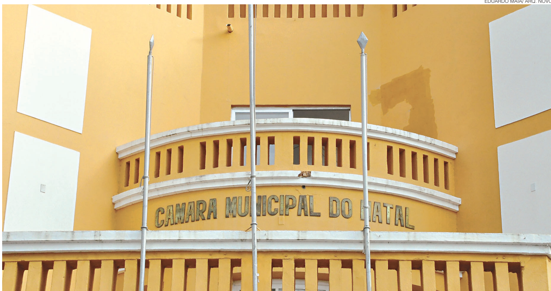
// Câmara Municipal de Natal aprova medidas para reduzir gastos, seguindo a mesma tendência dos outros órgãos e instituições públicas

"Em consonância com vereadores e com o Executivo, que também impôs medidas restritivas quanto aos gastos da máquina pública, não poderíamos ficar inertes e também definimos medidas para reduzir gastos com água, energia, limpeza, locomoção