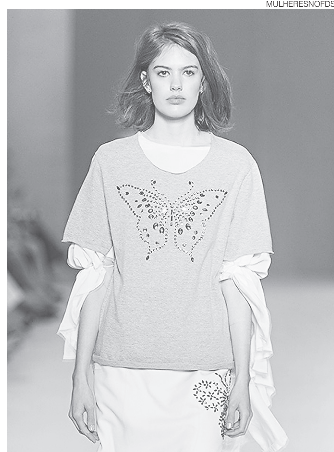
// Desfile Viva por Vivaz no Minas Trend Verão 2017

A entrega dos kits aos cerca de 1.200 inscritos na Carreira Jurídica será realizada hoje (20) e amanhã (21), em estande na feira ExpoImóveis, no terceiro piso do Midway Mall, no horário de funcionamento do shopping - 10h às 22h. A corrida será realizada neste domingo (22) na Base Aérea de Natal (BANT), em Emaús - um local inédito para corridas de rua. O kit do atleta conta com camiseta em tecido tecnológico, boné, sacomochila, toalha de rosto, número de peito e chip. Durante a entrega, também será possível fazer inscrição para últimas vagas.