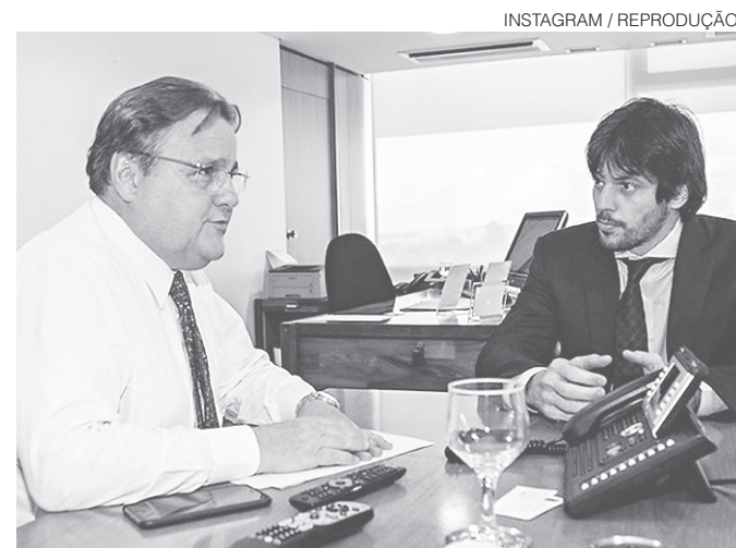
// O deputado federal Fábio Faria esteve em audiência sobre o Rio Grande do Norte na tarde desta quinta-feira (19), no Palácio do Planalto, com o novo ministro da Secretaria de Governo, Geddel Vieira

O Grande Leilão Seridó é uma das atrações da 43ª Exposição Agropecuária do Seridó, que começa nesta sexta e segue até domingo (22) em Caicó, no Parque de Exposição Walfredo Gurgel. O tradicional leilão acontece no sábado (21), a partir das 20h, e trará 40 lotes de animais de alta qualidade. O evento faz parte do Circuito Estadual de Exposições Agropecuárias realizado pelo Governo do Estado por meio da Secretaria Estadual de Agricultura, Pecuária e Pesca (Sape).