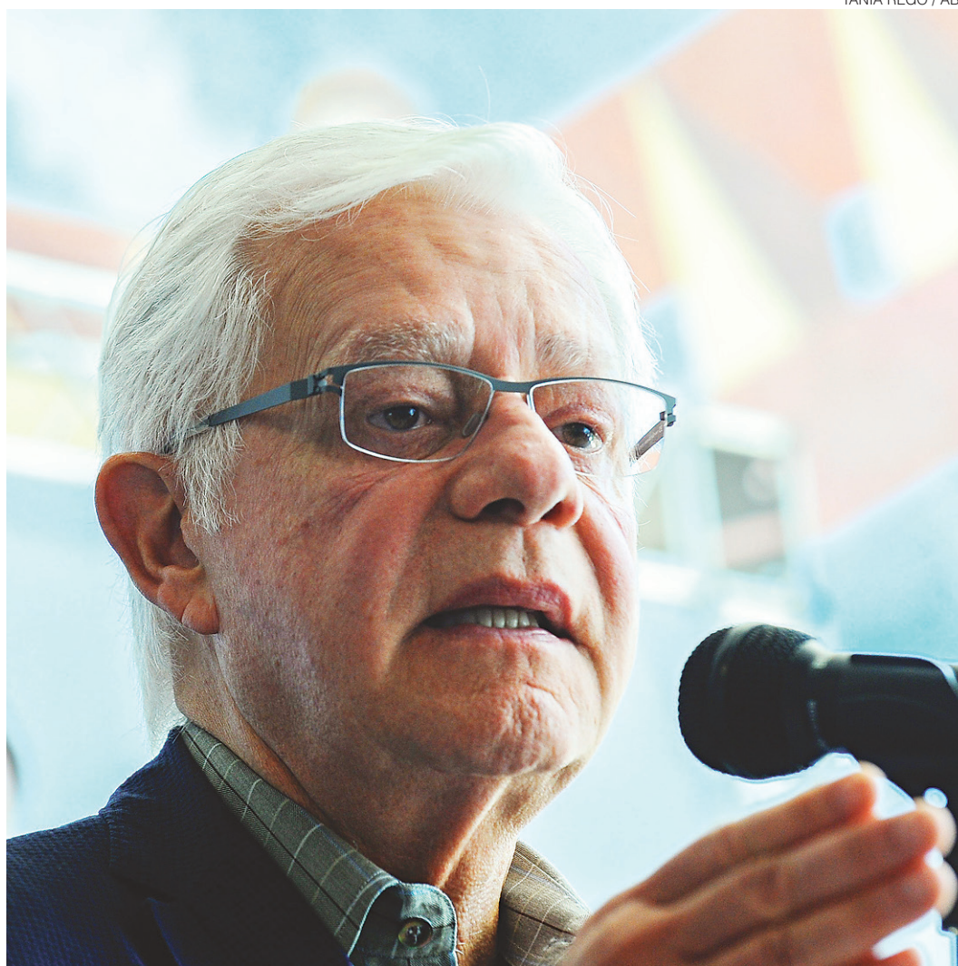
// Moreira Franco, ministro da Secretaria do Programa de Parceria de Investimentos

Segundo ele, há atratividade no leilão dos quatro aeroportos (Porto Alegre, Fortaleza, Florianópolis e Salvador) e até mesmo no terminal de Cuiabá, cujo projeto é embrionário. As renovações das concessões de rodovias, portos e ferrovias - que podem render até R$ 42 bilhões - também devem ser exito-