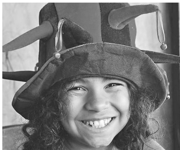
Registro da alegria de ser criança. Viva a vida sorrindo, leve como um sorriso de uma criança!