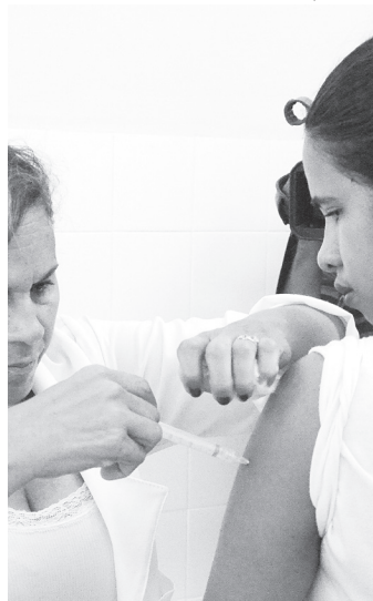
// Vacinação contra a gripe influenza vai até 03 de junho

gestantes (53,50%), 851 puérperas (58,21%), 19.164 trabalhadores de saúde (92,72%), 30.076 crianças entre seis meses e cinco anos de idade incompletos (60,88%), além de 24.809 pessoas portadoras de doenças crônicas.