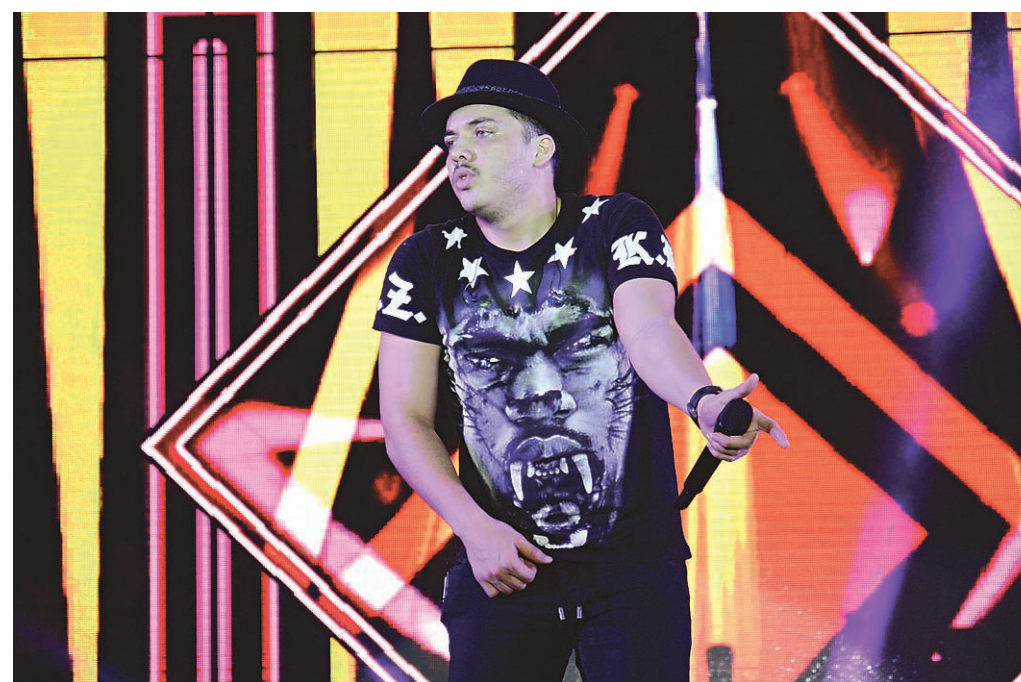
// Sucesso: a música "Camarote" tem mais de 120 milhões de visualizações no youtube