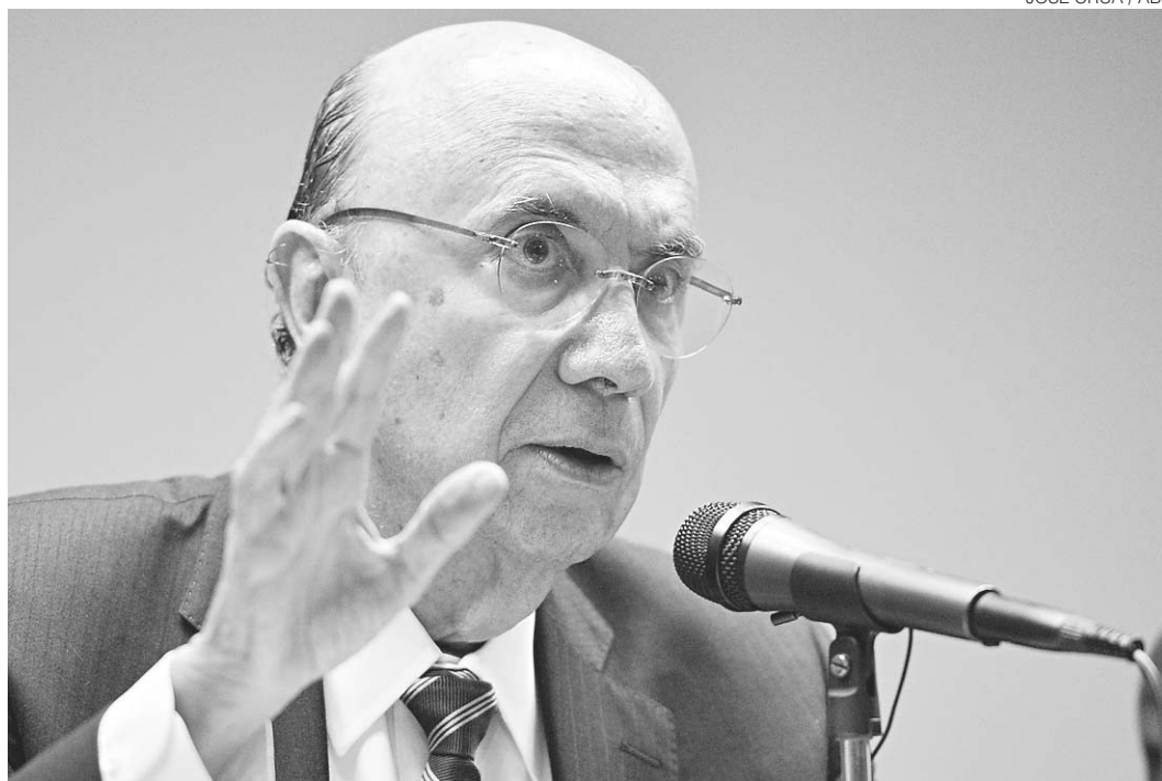
// Segundo Henrique Meirelles, aumento de impostos é um entrave dado o tamanho da carga tributária

O objetivo inicial da equipe comandada por Meirelles é, segundo ele, dar uma ideia do "plano de voo, da direção" do que está sendo planejado.