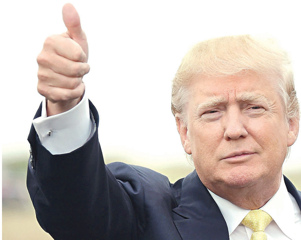
// Donald Trump venceu a ex-primeira dama e ex-secretária de Estado Hillary Clinton

“Como o discurso de Trump é muito protecionista e um tanto xenófobo, o receio é que isso represente uma restrição maior do mercado norte-americano em relação às exportações. O discurso apontava para a defesa de empregos norte-americanos e, especificamente, para a China como uma destruidora de empregos nos Estados Unidos, o que faria supor que eles seriam menos receptivos com relação ao