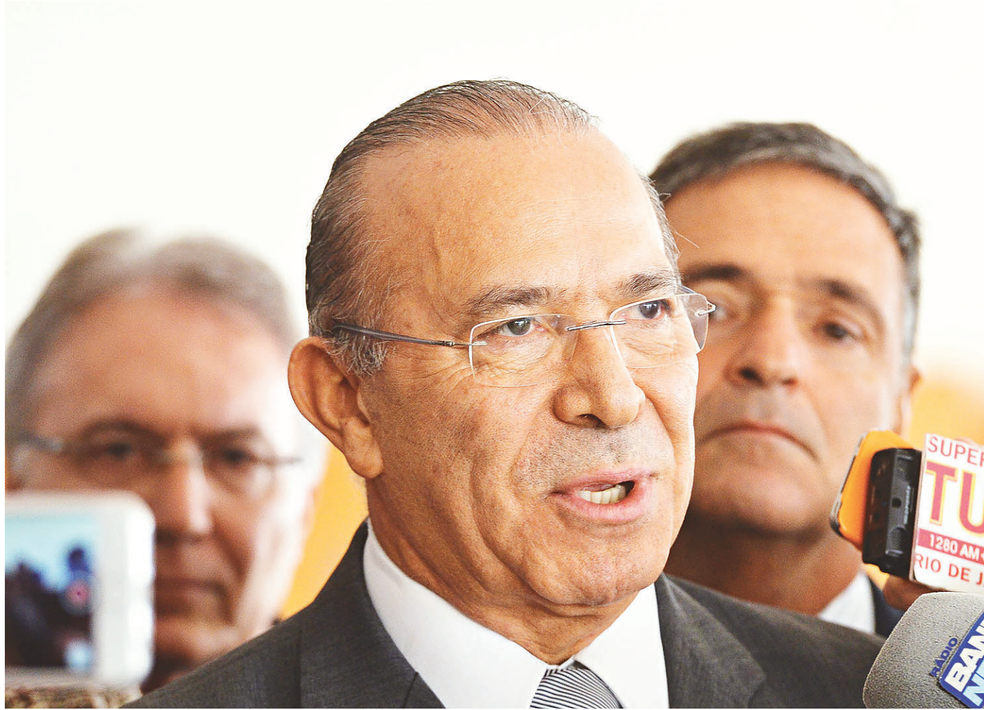
// Eliseu Padilha, ministro-chefe da Casa Civil, disse que o governo quer aprovar a Reforma da Previdência "de primeiro"

Padilha disse que os presidentes do Senado, Renan Calheiros (PMDB-AL), e da Câmara, Rodrigo Maia (DEM-RJ), estão estudando um calendário que viabilize a aprovação da reforma ainda no primeiro semestre de 2017. "Vamos propor o que o mundo está fazendo. Nada