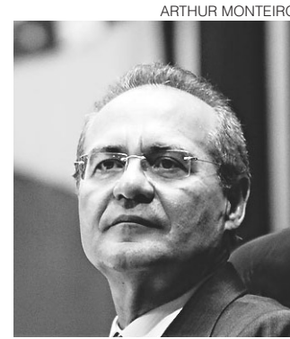
// Renan Calheiros, presidente do Senado

A sugestão surgiu após dificuldade de reajustar sa-