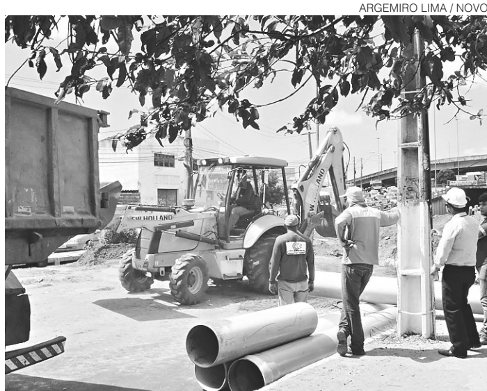
// RN está entre os 18 estados que manifestaram esse interesse

O banco também poderá fazer a prospecção de investidores e a realização do leilão de concessão ou outra forma de parceria com a iniciativa privada. Nesta quarta-feira, o BNDES publicou o edital de pré-qualificação para a habilitação de consultores especializados em fazer os estudos técnicos para a estruturação dos projetos