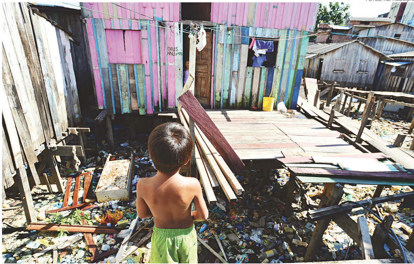
// Até o fim do ano, a União terá gasto R$ 1,87 bilhão no combate ao mosquito; epidemia do vírus Zika está mais concentrada na região Nordeste

A epidemia do vírus Zika atingiu todas as regiões do