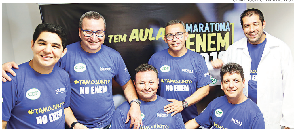
GEANDSON OLIVEIRA / NOVO

Gabaritos oficiais são divulgados e confirmam qualidade das aulas gratuitas disponibilizadas pelo NOVO em parceria com o CDF, com conteúdos que beneficiaram mais de 200 mil pessoas. Vem mais por aí! Cidades #9