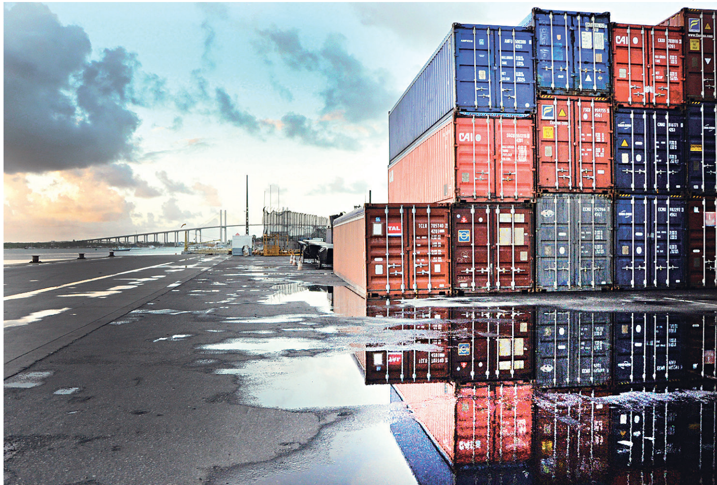
// Do total das exportações do Rio Grande do Norte para o mercado externo, 19% vão para os Estados Unidos