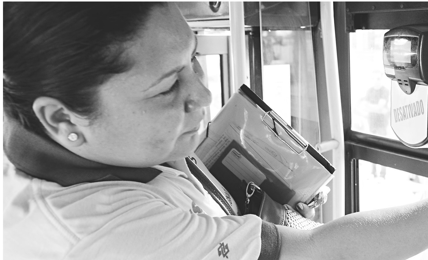
// De acordo com a licitação, a passagem para ônibus e alternativos subirá dos atuais R$ 2,90 para R$ 3,45, um reajuste de 18,9%