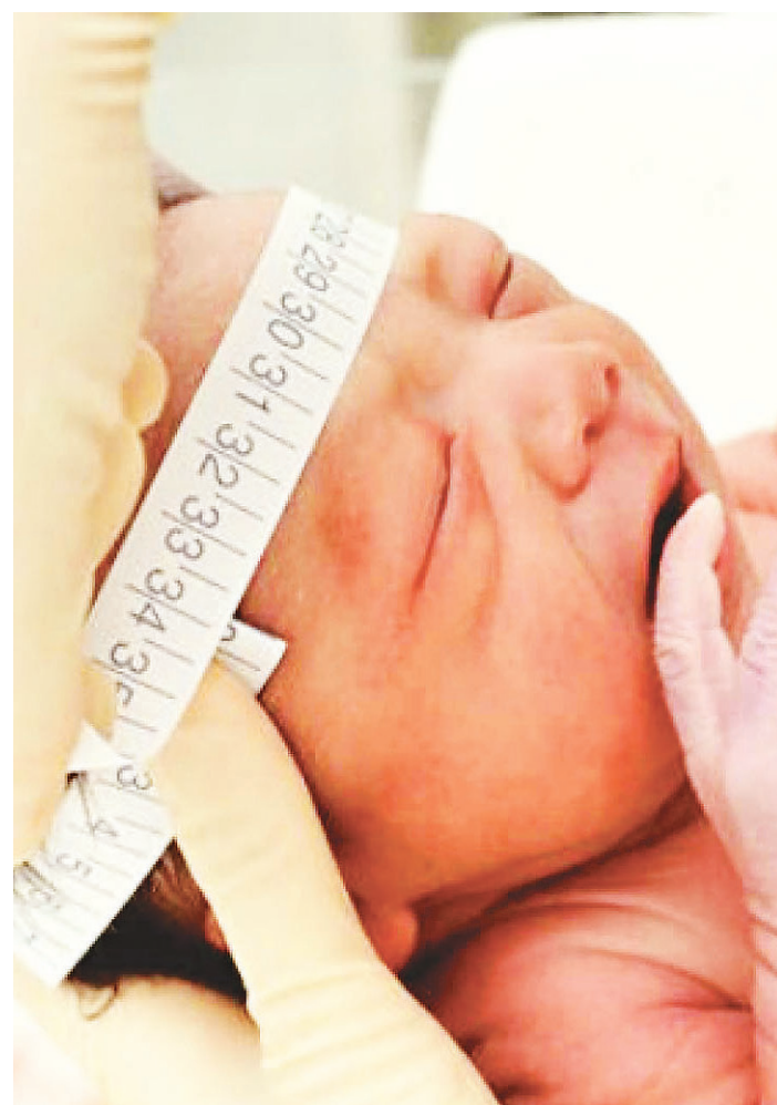
// Brasil tornou-se referência mundial nos estudos sobre a Zika

A resposta brasileira à epidemia do zika é elogiada por muitos especialistas e instituições de saúde. Os institutos de pesquisa brasileiros se destacaram na busca de informações e novas tecnologias. O país tornou-se referência mundial.