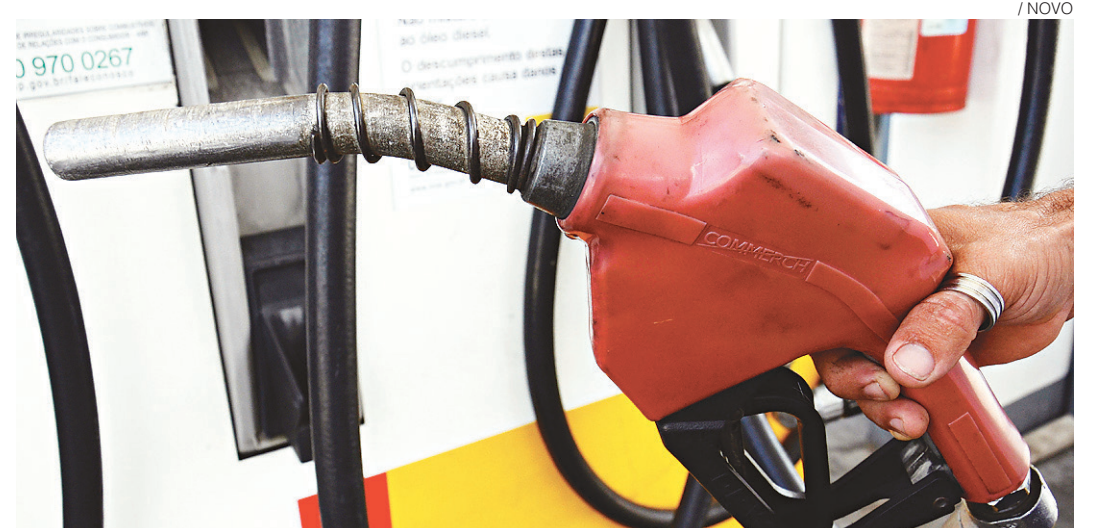
// Petrobras anunciou na terça-feira a redução no preço da gasolina em 3,1% e do diesel em 10,4%