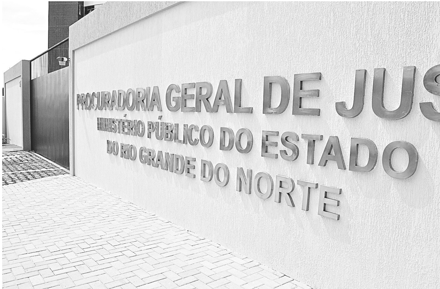
// MP informou que estuda reforçar segurança, mas que ainda não determinou procedimento algum nesse sentido de imediato

E assim deve permanecer, pelo menos por enquanto. O MPRN, por meio de sua assessoria de imprensa, informou que estuda, a partir do que ocorreu na semana passada, adotar melhorias na segurança, mas não há nenhum proce-