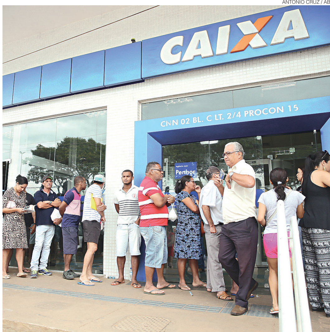
// Margem financeira operacional da Caixa em 2016 chegou ao patamar de R$ 47 bilhões

Além disso, foi mantido o perfil histórico de qualidade da carteira, com 90,8% do crédito classificado nos ratings de melhor qualidade, de AA-C. A ampliação do relacionamento com clientes gerou aumento de 8,4% nas receitas com pres-