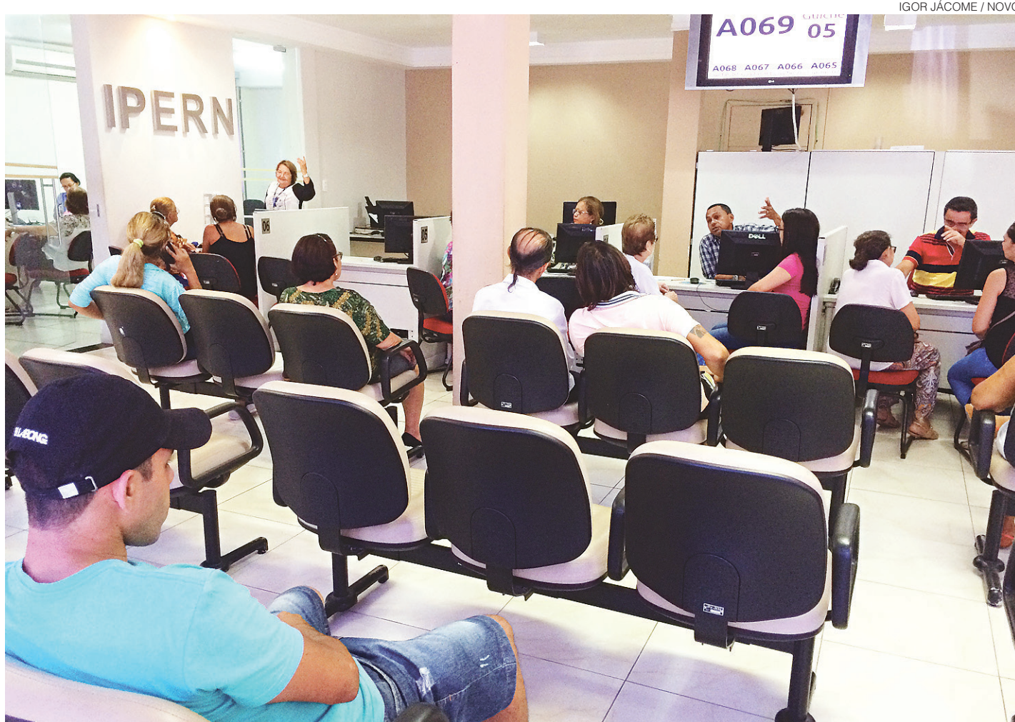
// No Instituto de Previdência do Estado, o número de pedidos de aposentadorias passou de 200 para 400 mensais, de 2012 para 2016

Até 2015, as pastas estaduais eram responsáveis pelo processo de aposentadoria. Uma decisão interna da administração mudou isso, mas a transferência para o Ipern