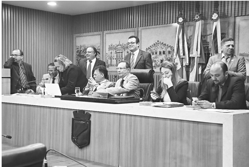
// Sessão na Câmara dos Vereadores de Natal: base do prefeito ganha queda de braço com a oposição

Já a oposição teceu duras críticas à aprovação da urgência e disse que o projeto necessitava de maior debate com os servidores, com técni-