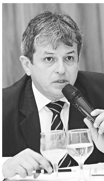
// Procurador-geral Rinaldo Reis era um dos alvos do atentado

dimento determinado. Na portaria também costumava haver um equipamento semelhante ao usado em agências bancárias. Ontem ele não estava lá porque estaria em manutenção, de acordo com informações passadas por servidores.