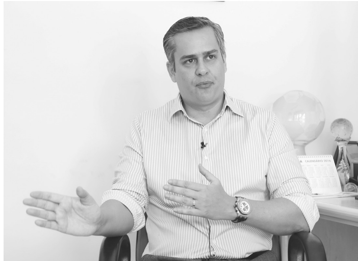
// Em nota, presidente reafirma que não será empecilho

"Concordei com tudo e dei autonomia total no comando do futebol do América, inclusive se fosse preciso que tirasse licença da presidência, eu o faria, pois