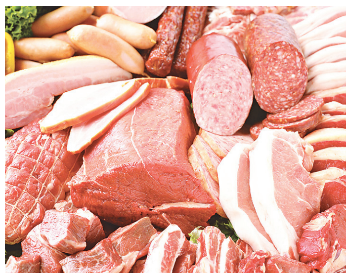
// Pesquisa mostra que excesso de carne na mesa pode ser prejudicial

> Apesar dos cuidados com o intestino e os quatro estômagos do boi, é possível que bactérias escapem > Algumas podem ser patogênicas, mas geralmente o grau de contaminação é pequeno > Facas e serras utilizadas devem ser constantemente esterilizadas