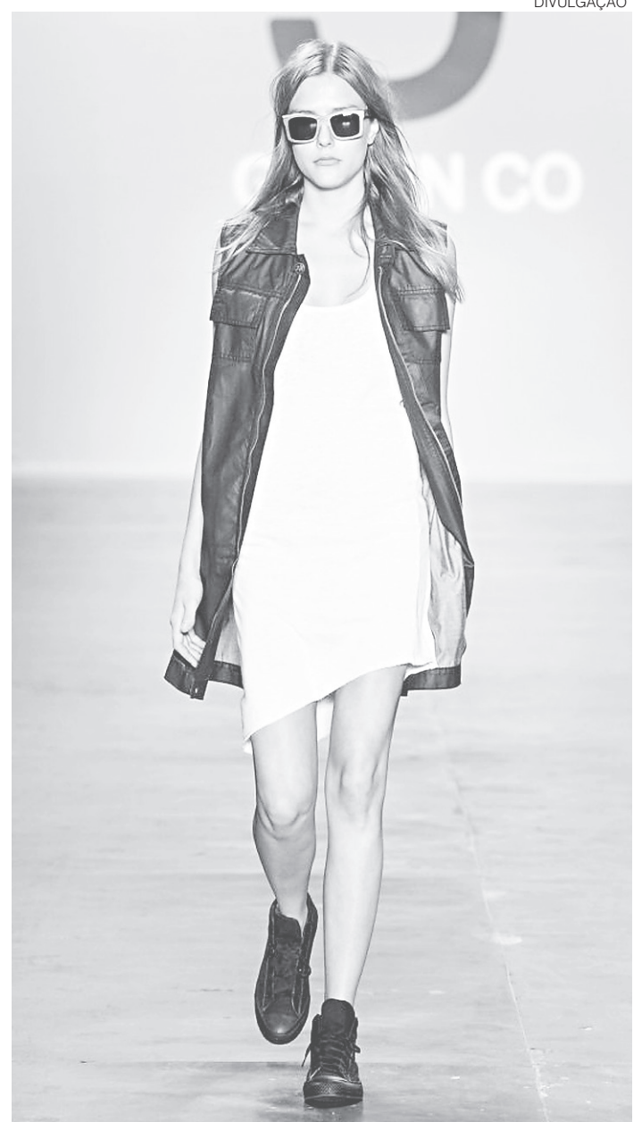
Desfile Sebrae Inverno 2017 no SPFW

O investimento desafogará o fluxo no Centro Clínico Nascimento de Castro, onde estão localizados o Centro de Imagens, um Laboratório e o Centro Pediátrico, que com a ampliação passará a atender unicamente as consultas eletivas.