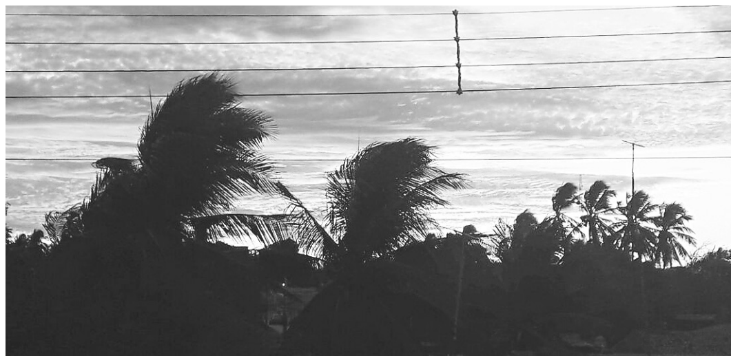
Linda imagem de Barra de Maxaranguape feita pelo leitor Otávio Araújo.

Tudo sobre o NOVO num canal pra lá de especial, #zOOngando, onde você vai poder saber sobre as novidades da empresa e tudo que estamos aprontando. Acesse: bit.ly/zoongando