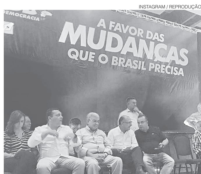
/Senador Garibaldi Filho divulgando nas suas redes sociais a ida ao ato de filiação de prefeitos do RN ao PSDB, neste fim de semana, com a presença do governador de São Paulo Geraldo Alckmin