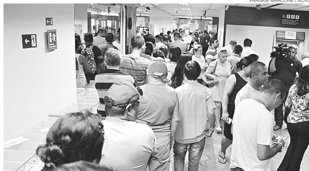
FRANKIE MARCONE / NOVO

// Caixa paga contas inativas do FGTS a mais de 181 mil trabalhadores