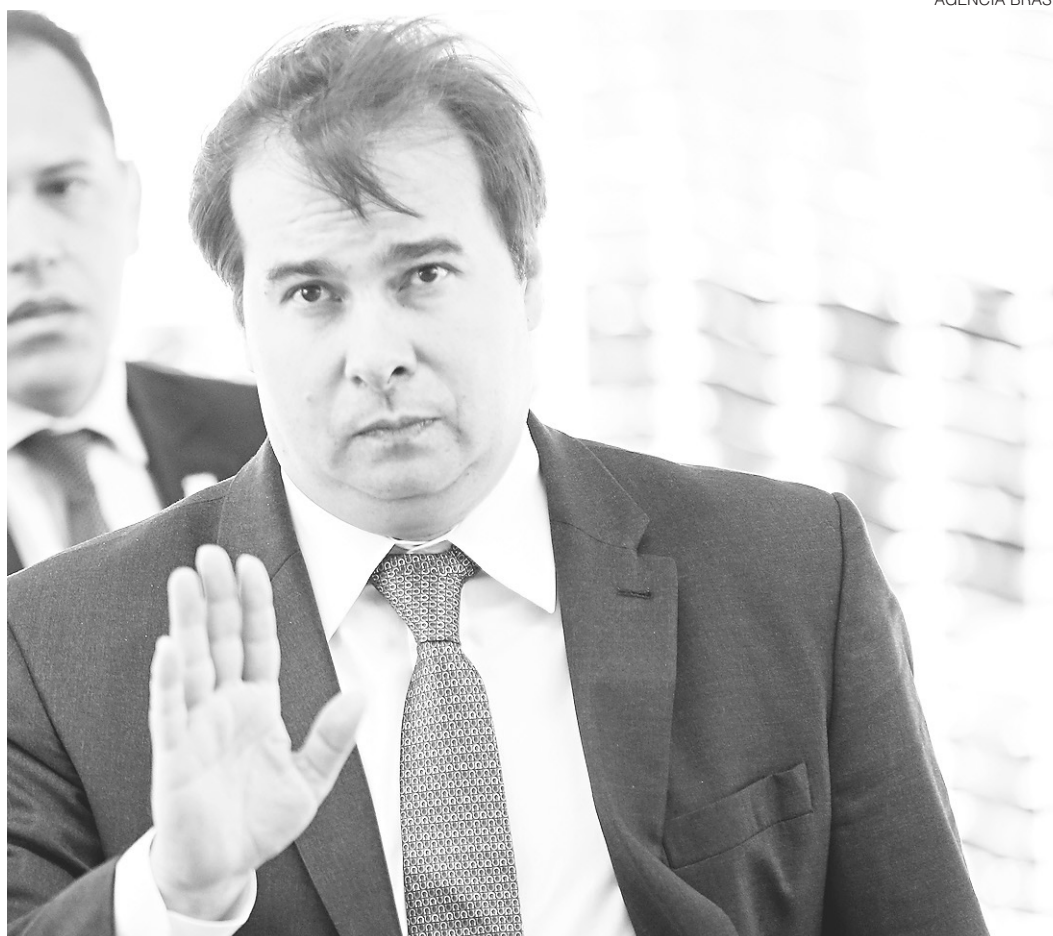
// Rodrigo Maia disse esperar que a base do Governo esteja organizada no final deste mês

“Na minha agenda, a Câmara precisa estar votando essa matéria em setembro, a gente precisa estar pronto pra votar a partir do início