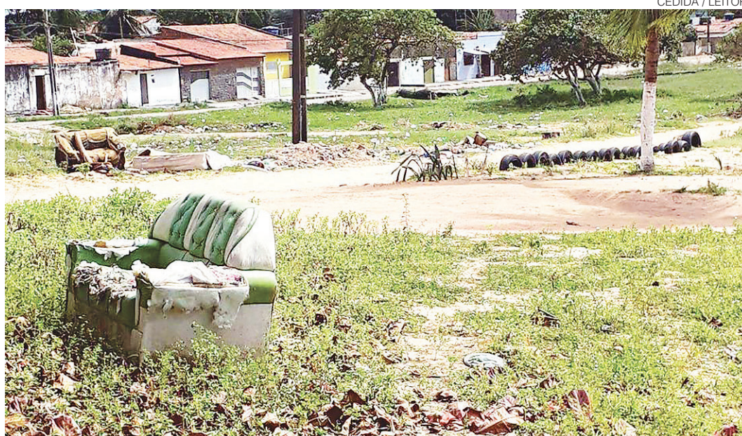
// Canteiro da Avenida Dr. Juliano Moreira, no Bairro Pajuçara, na zona Norte, virou depósito de lixo