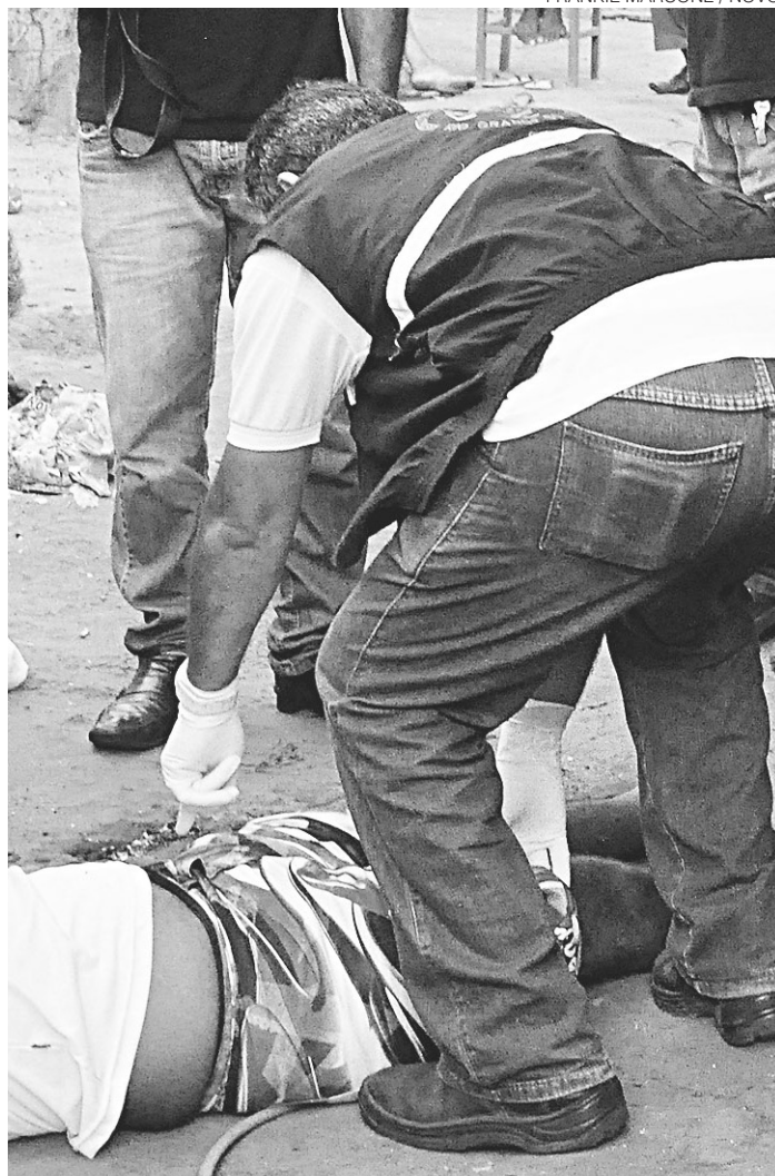
// Região Metropolitana de Natal registrou 16 homicídios, 59% do total

Essas mortes foram duas das 27 registradas neste último fim de semana, mais um violento. Da sexta-feira, dia 4, até este último domingo (6), foram 27 homicídios no estado, que com esses números, chegou a um total de 1.466 condutas violentas letais intencionais (CVLIs), nome técnico para assassinatos. Os dados apontam para um aumento de 26,3% em relação