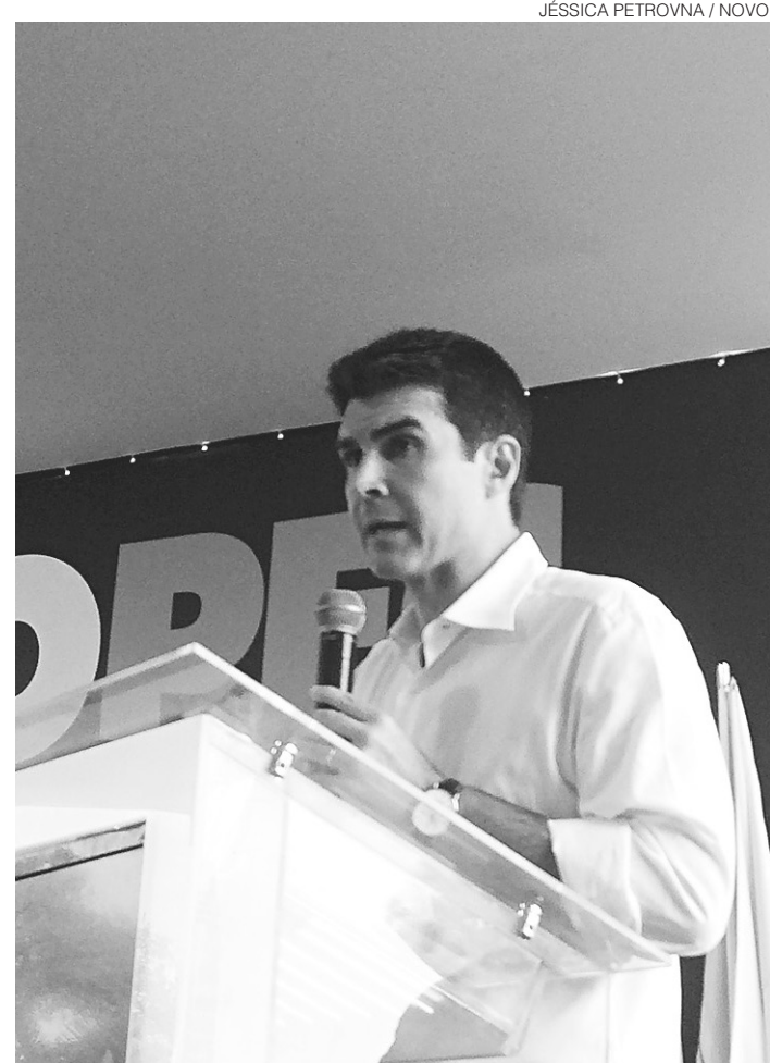
JÉSSICA PETROVNA / NOVO

Em seguida, terão continuidade as obras do Ramal Apodi, que deve levar água para outros 97 municípios na Região Oeste do Rio Grande do Norte. Dessa forma, 121 das 167 cidades que compõem o estado vão ser abastecidas pelas águas do Rio São Francisco em alguma instância de redistribuição.