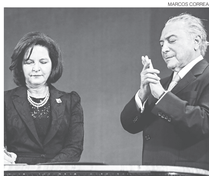
// Raquel Dodge dá andamento à petição que cita Temer em MP

As suspeitas sobre Temer em torno da edição do Decreto dos Portos surgiram a partir de uma conversa de pouco mais de 2 minutos com Loures interceptada pela Polícia Federal em 4 de maio. Loures, que foi assessor especial da Presidência, estava grampeado. O deputado tentava saber sobre a assinatura do Decreto dos Portos e Temer informou o parlamentar que iria assinar o decreto na outra semana.