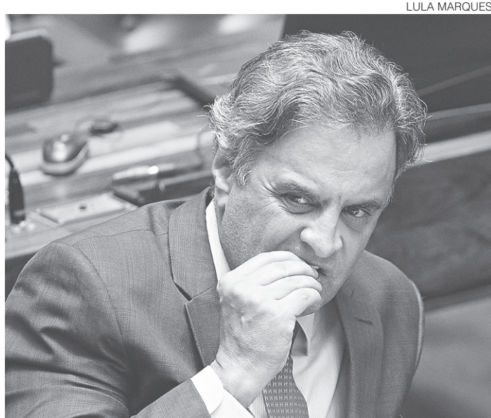
// Aécio Neves está submetido a recolhimento noturno pelo STF

Na semana passada, Eunício estudava esperar a de-