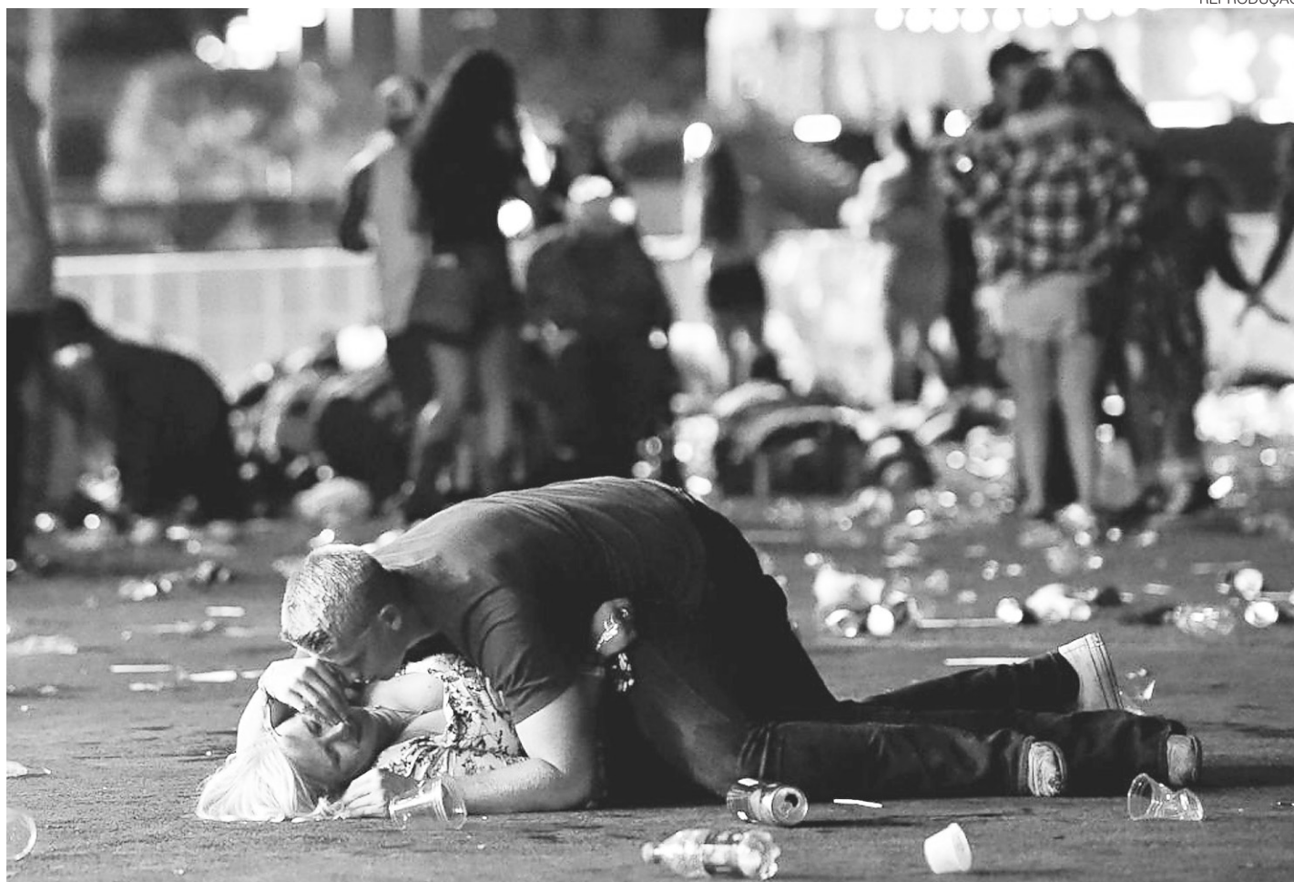
// Cantor country Jason Aldean fazia um show na noite de domingo quando homem armado abriu fogo a partir do 32º andar de um hotel

Segundo Lombardo, Paddock teria feito check-in no