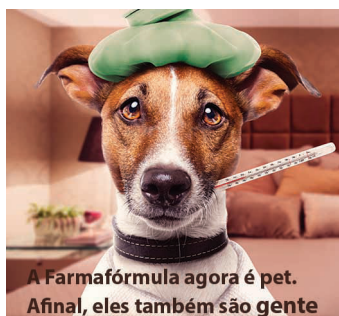
A Farmafórmula agora é pet. Afinal, eles também são gente