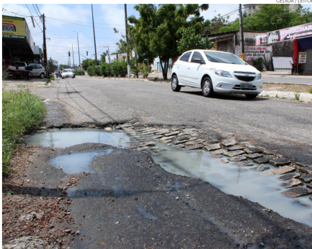
// Leitor entrou em contato com o NOVO para buscar resposta das autoridades