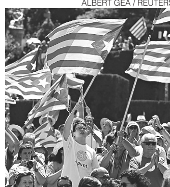
// Catalães foram às urnas num plebiscito considerado ilegal

"Segundo a Constituição espanhola, o voto de ontem (domingo) na Catalunha não foi legal", disse. "Para a Comissão, esse é um assunto interno da Espanha que deve ser gerido de acordo com a ordem constitucional. Também reiteramos a posição legal mantida por essa Comissão: se um plebiscito não foi organizado de acordo com Constituição, ele implicaria que o território ficaria de fora da UE", explicou.