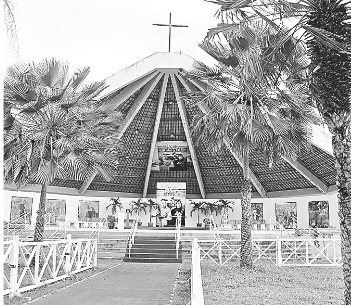
// Santuário de Uruaçu, em São Gonçalo do Amarante