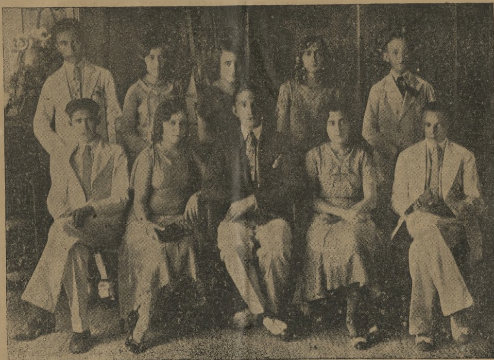
Diretoria da Associação de Normalistas que terminou o mandato a 2 de março p. passado.