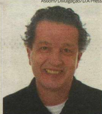
Imparcialidade é a marca do colunista

de perto um universo que envolve, além do esporte, interesses políticos e financeiros sob a perspectiva de um dos mais conhecidos e polêmicos personagens da crônica esportiva brasileira. O que Juca diz e publica na internet, na TV e no jornal já ensejou tantos processos contra o jornalista que ele nem se dá mais ao trabalho de contar quantas vezes foi acionado na Justiça - seguramente, mais de 100. Polêmico, sabe que quem noticia informa em benefício do coletivo.