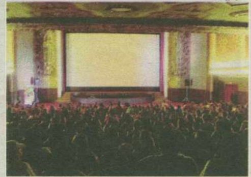
Mais de três mil projetos nordestinos já concorreram ao patrocínio do Programa Petrobras Cultural, dos quais 222 foram aprovados até agora