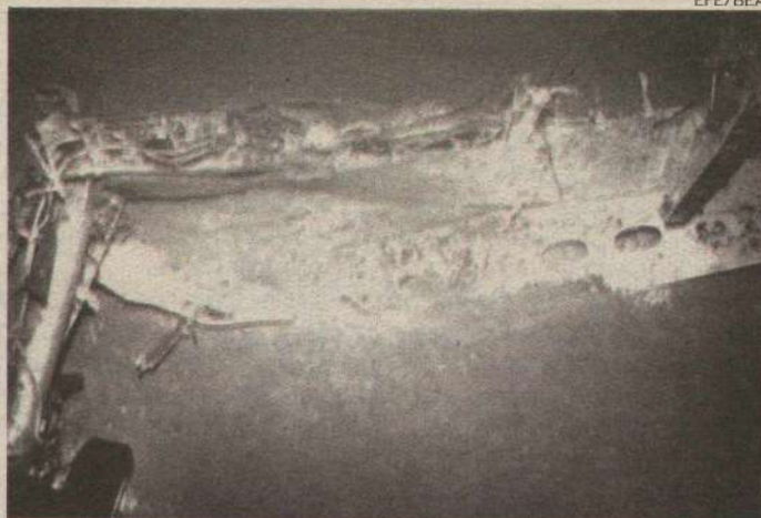
Destroços foram localizados em uma área ainda não explorada