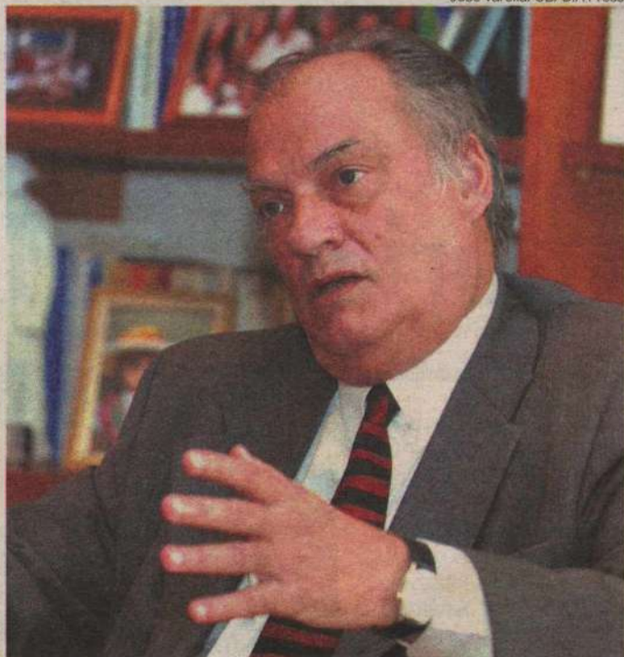
Deputado Roberto Freire (PPS-SP) vai cobrar que MP analise a denúncia

Já o líder do governo na Câmara, Cândido Vaccarezza (PT-SP), disse que o relatório não traz fato novo e descartou o envolvimento do ex-presidente Lula. "Não tem novidade. São assuntos antigos já divulgados. As pessoas que foram indici-