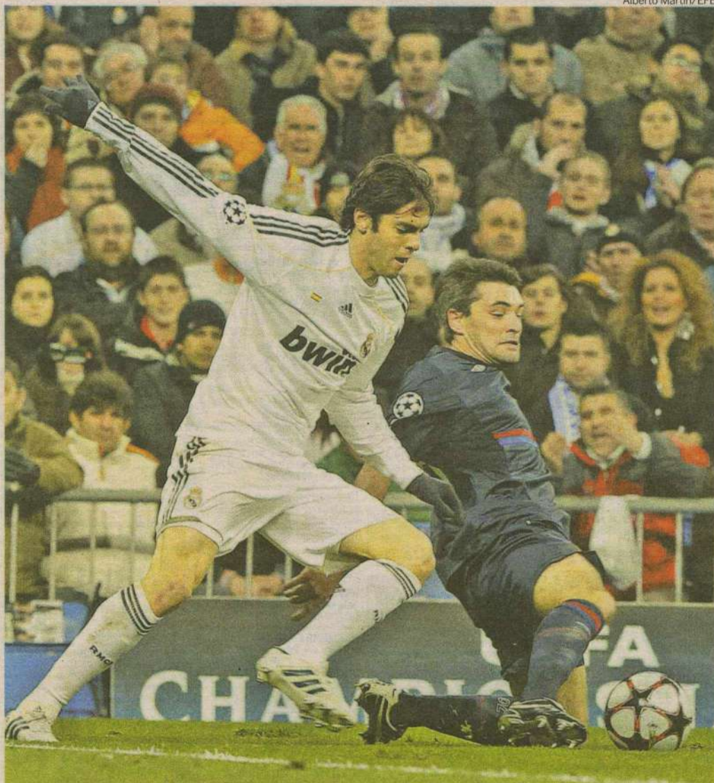
Meia brasileiro do Real Madrid está em fase final de recuperação de lesão no joelho

Os atletas não receberam alta, e os médicos desaconselham a participação de ambos na partida, mas Mourinho pensa em utilizá-los por pelo menos alguns minutos. A inclusão de Kaká também foi inesperada, já que o brasileiro ainda está em fase final de recuperação de uma lesão no joelho esquerdo e voltou aos treinos apenas nesta segunda-feira. O argentino Di María também foi convocado apesar de não ter participado das atividades desta segunda. No sábado passado, o meia-atacante sofreu uma dura pancada na coxa esquerda e teve que ser substituído. Se alguns voltam, o técnico português não poderá contar com o atacante Karim Benzema, que sentiu a coxa esquerda no amistoso entre França e Croácia, na terça-feira passada.