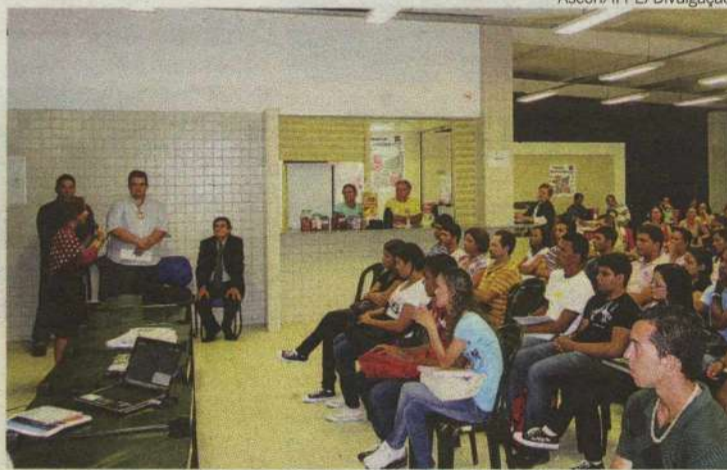
IFPE abriu a primeira turma do curso de Construção Naval em Ipojuca (PE)

Além de Construção Naval, o Instituto oferece os cursos técnicos de Segurança do Trabalho,