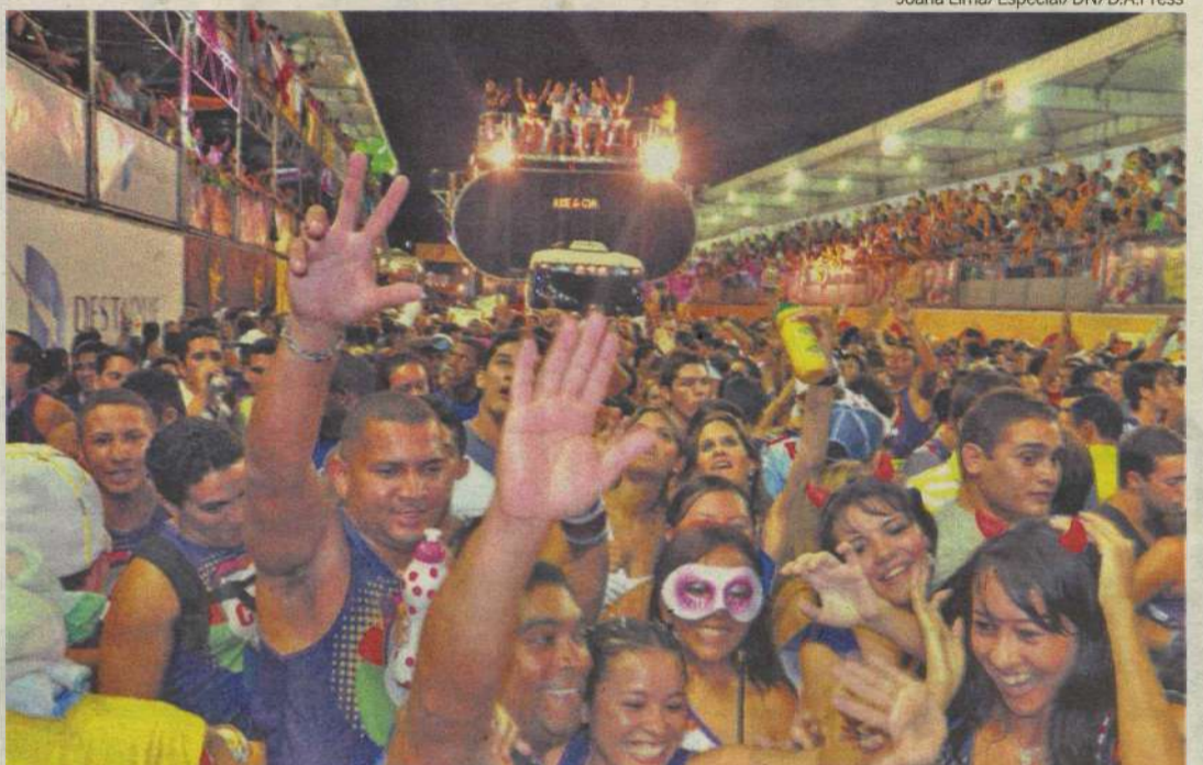
Festa está agendada para o período de 1 a 4 de dezembro. Vistoria dará parecer final sobre a viabilidade de realização