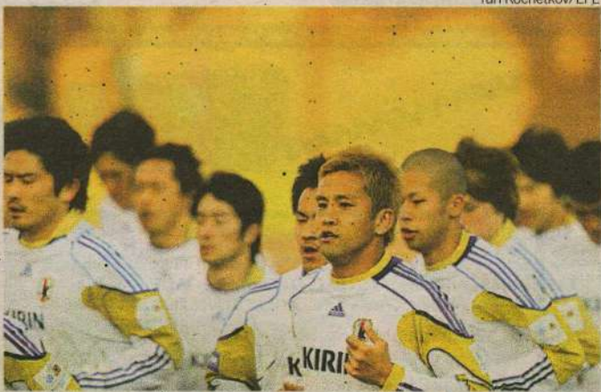
Seleção japonesa deve ser substituída pela Costa Rica ou Espanha

lizada no Paraguai, integraria o Grupo 1 com Argentina, Bolívia e Colômbia. A Copa América começará a ser disputada no dia 1º de julho e o Brasil está no Grupo B ao lado de Para-