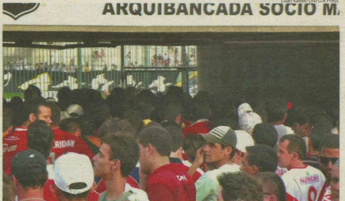
Falta de ingressos e revista da PM causou aglomeração e tumulto no acesso da torcida americana ao Frasqueirão