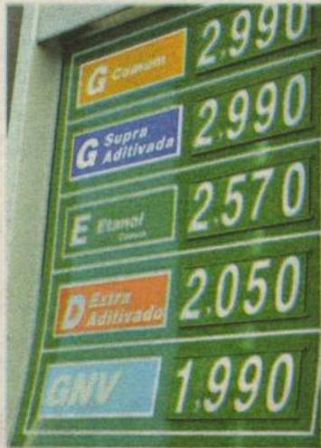
Etanol sofreu aumento de 13,72% e não é vantajoso para o consumidor. Preços pegaram consumidores desprevenidos