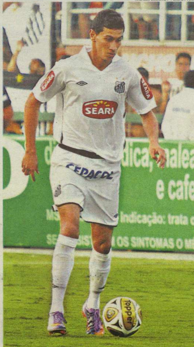
Ídolo da torcida santista pode ir parar no Parque São Jorge