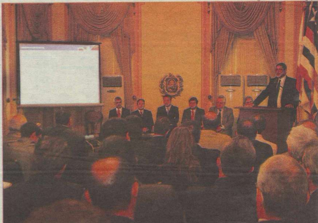
Presidente da Petrobras, Sergio Gabrielli, no encontro com empresários e políticos nordestinos sobre a cadeia produtiva do petróleo