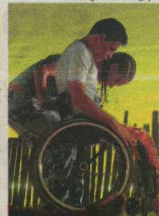
A cura será um dos espetáculos