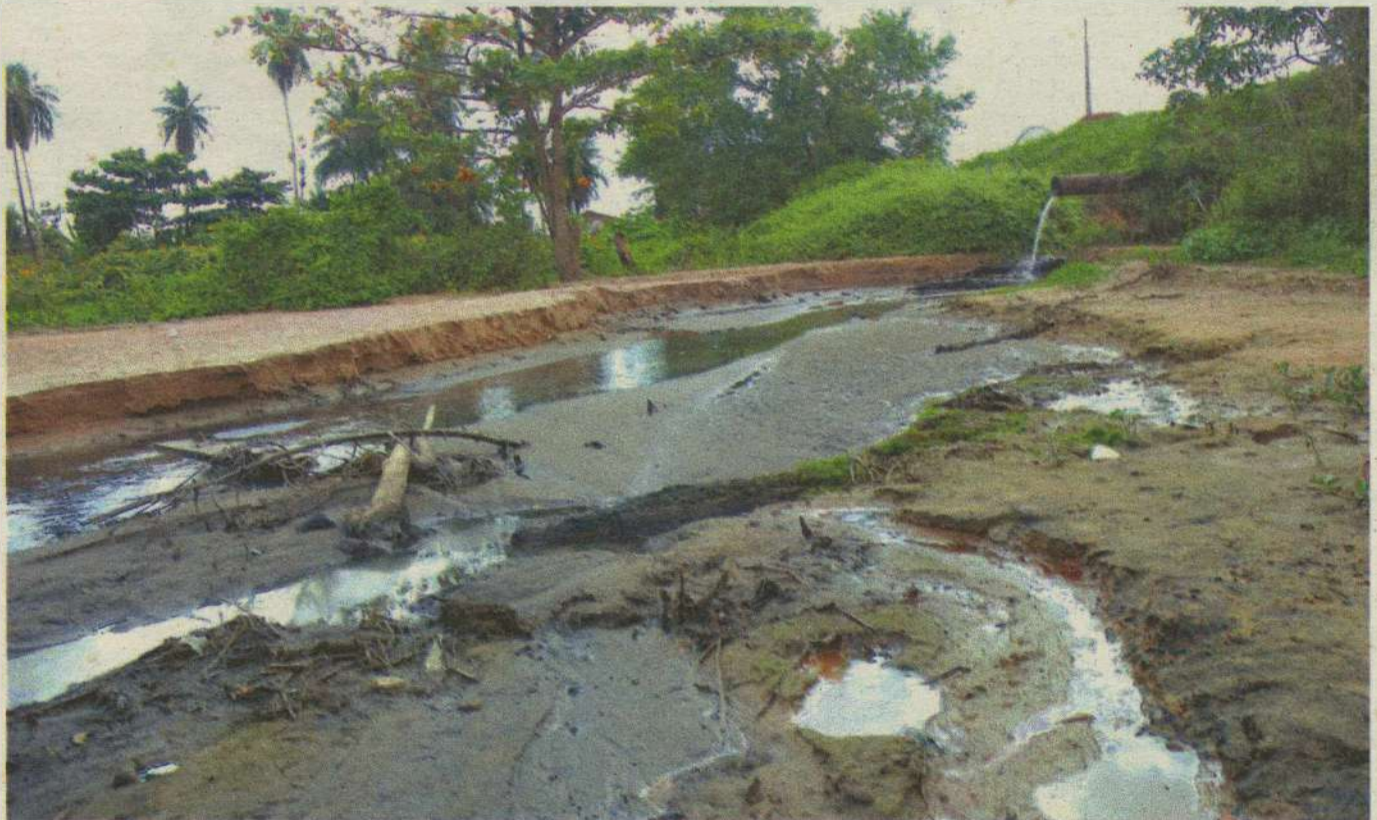
PERIGO // Caern não cumpre acordo e ETEs continuam lançando 13 milhões de litros de esgoto não tratado no Rio Potengi. PÁG. 10

PROFESSORES CONVOCADOS GOVERNO NOMEOU MAIS 427 APROVADOS PARA ACABAR COM O DÉFICIT DE PROFISSIONAIS NO RN PÁGINA 9