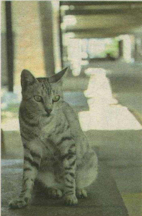
Fábio Cortez (DN/D.A. Press)

HOJE, AO VIVO, AUDIÊNCIA PÚBLICA PARA DISCUTIR A SUPER POPULAÇÃO DE GATOS EM NATAL, NA TV CÂMARA