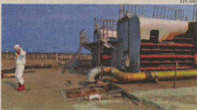
Foi encontrada uma rachadura de 20 centímetros no reator 2

Essa água excede em cem vezes o limite legal de iodo-131, um nível relativamente baixo em comparação com o da água que inunda algumas áreas da usina nuclear, com uma radiação até 100 mil vezes superior. A Agência para a Segurança Nuclear do Japão insistiu que a operação não representa riscos