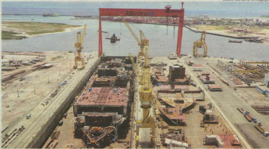
Estaleiro Atlântico Sul foi uma das primeiras empresas a capacitar e contratar mão de obra

Para traduzir os investimentos do setor em geração de emprego e renda para o país foi criado o Portal do Fornecedor, um canal onde os empresários interessados em integrar essa rede podem se cadastrar e se informar sobre a demanda real da companhia em produtos e serviços. No site constam informações como as listas de bens e as de serviços de interesse da Petrobras, inclusive com antecipação das demandas. "O portal é uma importante vitrine