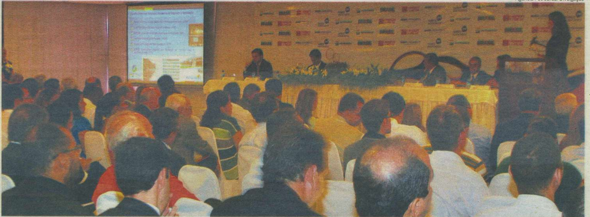
Empresários, técnicos, professores e estudantes participaram do evento promovido, no Recife, pelos Diários Associados para debater os reflexos econômicos e sociais do pré-sal na região