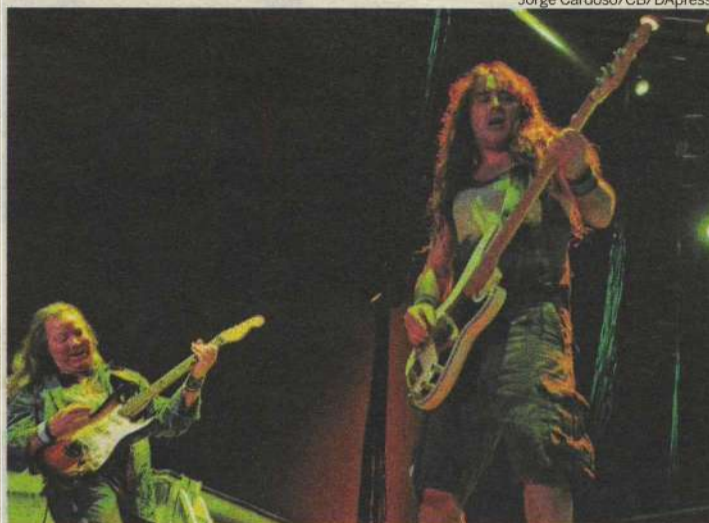
Somente de Natal, sete ônibus partiram lotados de fanáticos para ver os ídolos

Segundo Mauro, o show começou poucos minutos depois das 20h, quando milhares de fãs começaram a gritar "Maiden! Maiden!". A abertura, com Satellite 15... The Final Frontier , foi a única música que utilizou os dois telões nas laterais do palco com imagens espaciais e futuristas. Depois, os equipamentos serviram para ampliar cenas dos músicos, seja