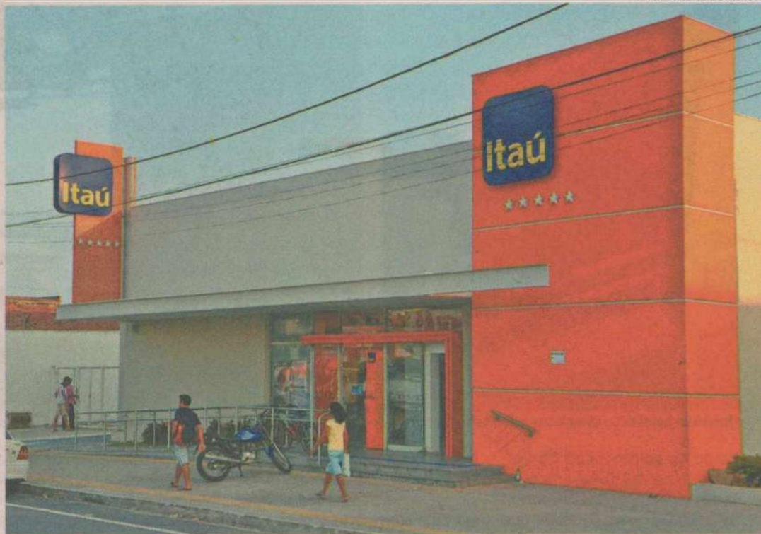
Itaú Unibanco teve o maior lucro no período: R$ 13,960 bilhões. Arrecadação dos três maiores cresceu 11,4% no ano

O Itaú Unibanco apresentou receitas com prestação de serviços