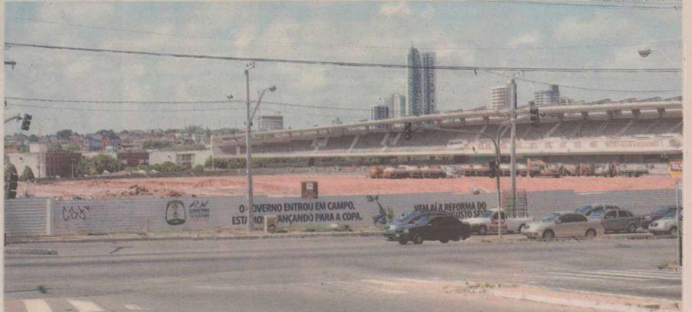
VAZIO NA PAISAGEM // Demolição do Machadão e Machadinho modificam a aparência do bairro de Lagoa Nova. Celeridade das obras assusta natalenses que circulam nos arredores da área onde será construída a Arena das Dunas. PÁGINA 7