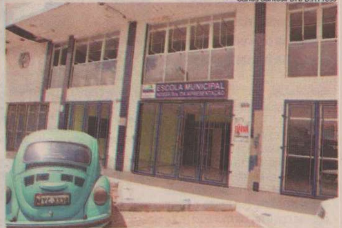
Escola Municipal Nossa Senhora da Apresentação convive com problemas

Francisco Francerle franciscofrancerle.m@dabr.com.br