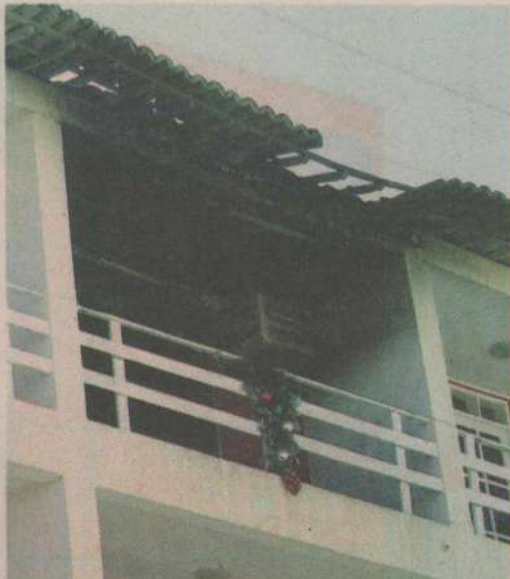
Quarto de hotel ficou completamente destruído em Ponta Negra. No Tirol, todo o edifício foi interditado após suspeita de comprometimento da estrutura

A primeira chamada foi para o residencial Amadeus Mozart, na Rua Juvenal Lamartine, no bairro Tirol, por volta das 2h30 de ontem. As chamas tomaram conta de um apartamento loca-