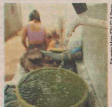
Bairros da Zona Sul, Leste e Oeste serão afetados pela interrupção

O Sistema Jiqui produz 2,4 milhões de litros de água por hora e voltará a operar normalmente na manhã da sexta-feira, 18, quando a oferta de água começará a ser regularizada, de forma gradual, atendendo inicialmente as casas situadas nas partes mais baixas de cada uma das regiões. As partes mais elevadas serão atendidas até o domingo, conforme expectativa dos técnicos da Caern para regularizar totalmente o abastecimento.