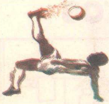
Kleber Sales/CB/D.A. Press