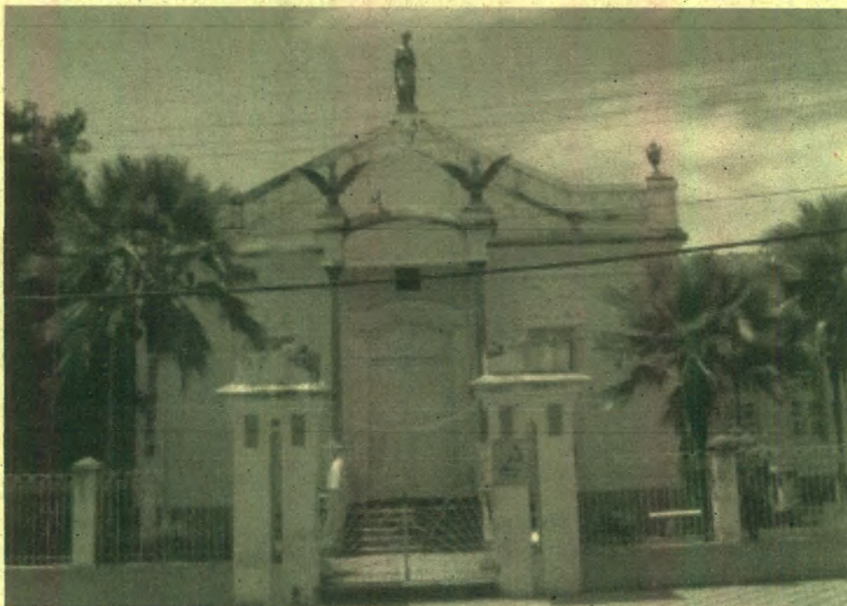
Figura 1 - Grupo Escolar Augusto Severo, Natal-RN.