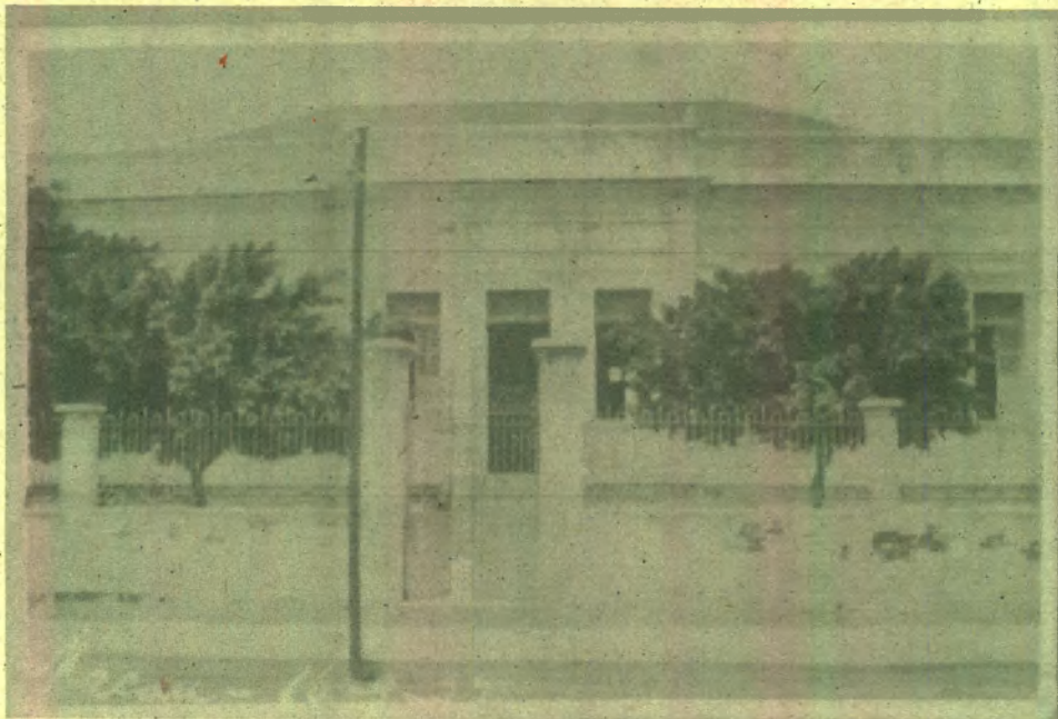
Figura 4 - Grupo Escolar Duque de Caxias, Macau-RN.

De fato, quando observamos a arquitetura dos primeiros grupos escolares do Rio Grande do Norte e os de outros estados (Figuras 2, 3, 4 e 5), percebemos menos detalhamento em termos arquitetônicos, prédios menores e com fachadas mais simples existiam. Roger