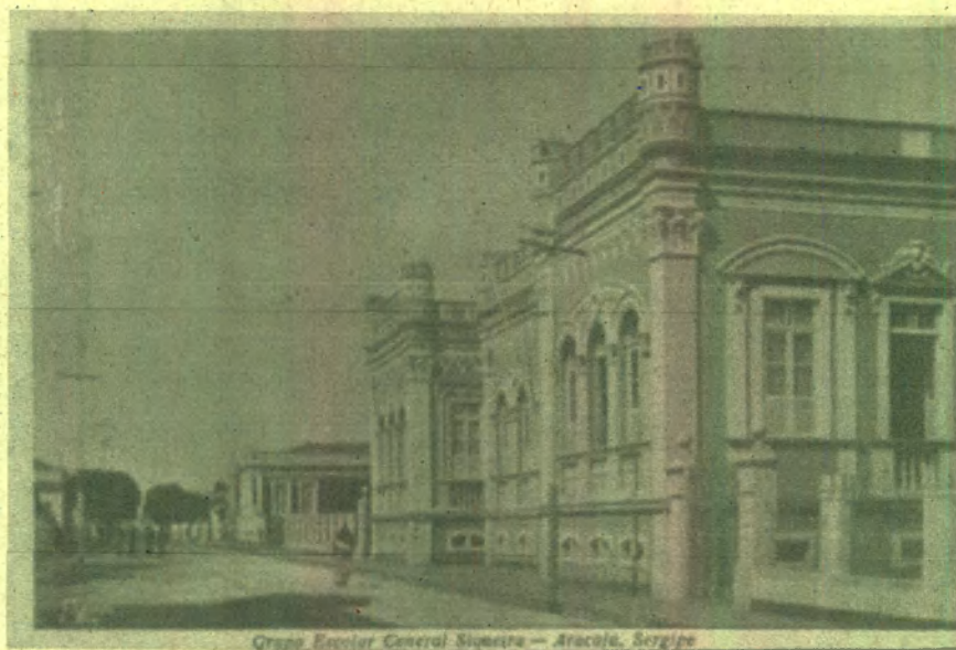
Figura 2 - Grupo Escolar General Siqueira, Aracaju-SE.

Verificamos, assim, que os grupos tinham seus prédios erguidos no centro das cidades, de preferência em regiões elevadas, afastadas de esgotos a céu aberto, cemitérios, terrenos baldios que tivessem acúmulo de lixo, lugares baixos que pudessem empossar água, enfim, evitava-se a disseminação de doenças que contagiassem os alunos.